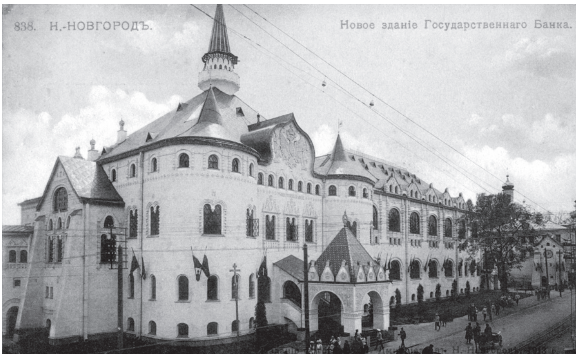
Здание конторы Государственного банка в Нижнем Новгороде. Открытка. 1910-е годы

К сожалению, до 1910 года нам не встречались сводные данные по количеству собственных зданий отделений Государственного банка. Известно лишь, что в 1910 году из 115 постоянных контор и отделений всего 19 отделений (17% от общего числа учрежде-