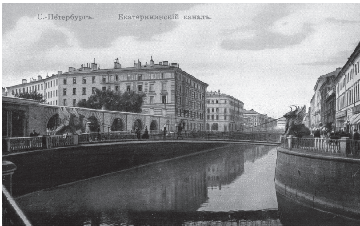
Набережная Екатерининского канала в Санкт-Петербурге с жилым домом для чиновников Государственного банка. Открытка. Начало XX века

и отделений привлекались как петербургские и московские, так и местные архитекторы. Самые известные здания были спроектированы, конечно, столичными зодчими: москвичом К.М. Быковским (Москва, 1890—1894 годы), петербуржцами В.А. Покровским (Нижний Новгород, 1911—1913 годы) и М.М. Перетятковичем (Ростов-на-Дону, 1911—1915 годы). Построенные ими дома — настоящие дворцы, стоившие многие сотни тысяч рублей (строительство одного дома для Московской конторы банка в Неглинном проезде обошлось в сумму более 800 тыс. рублей 18 , что в пересчете соответствовало около 623 кг чистого золота) и ставшие “притчей во языцех” в самом Государственном банке 19 . Их строили в центрах городов; архитектурно выделенные фасады обращали на себя внимание даже случайных прохожих. Управляющий Нижегородской