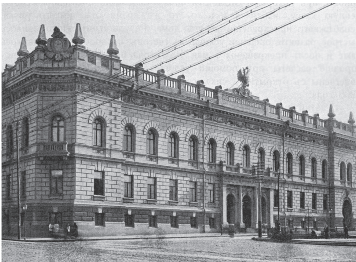
Здание конторы Государственного банка в Харькове. Фото. 1900-е годы