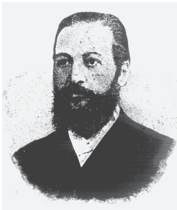
Г.А. Бертельс (портрет с фотографии конца XIX века)

16-го Ладожского пехотных полков в посаде Замброве Ломжинской губернии. Его работы были высоко оценены: военный министр П.С. Ванновский лично ходатайствовал перед императором Александром III о присвоении Голенищеву ордена Св. Станислава третьей степени (в 1893 году).