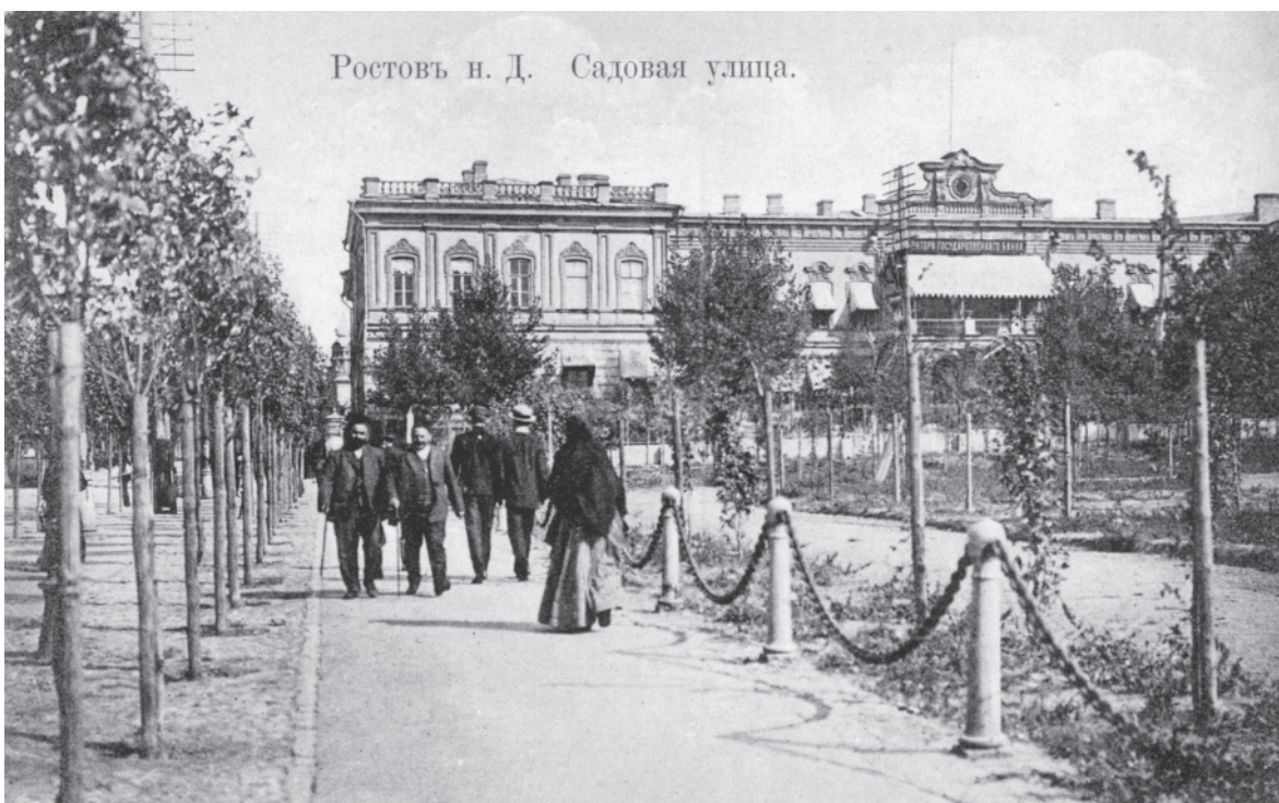
Старое здание Ростовской конторы Государственного банка (Ростов-на-Дону, ул. Садовая). Открытка. 1900-е годы