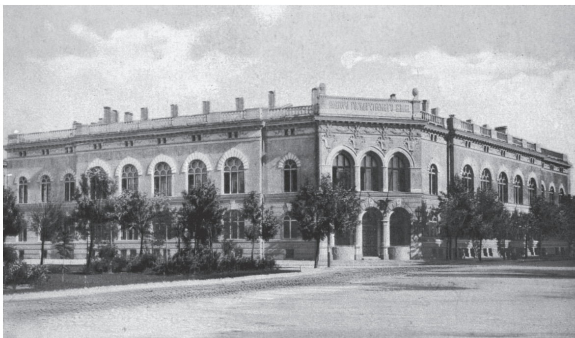
Здание конторы Государственного банка в Риге. Открытка. Начало XX века

В 1904 году Р.П. Голенищев был назначен архитектором Государственного банка. В том же году под его руководством было закончено возведение здания для конторы банка в Риге, рядом с замком и гауптвахтой. Его построили на угловом участке с использованием в оформлении фасада элементов итальянского Возрождения. Архитектор также наблюдал за ремонтными работами в здании Бухарского отделения (с 1897 по 1907 год), привлекался к работам по проектированию домов отделений в Омске (1900—1904 годы), Казани (1908 год) и Нижнем Новгороде (1911—1913 годы). За участие в проектировании здания для Нижегородского отделения (конторы) он был «всемилощивейше» пожалован подарком с вензелем царя ценой в 600 рублей (13 апреля 1913 года) и получил императорское «благоволение». К тому времени его парадный мундир украшали многие российские (Св. Анны второй степени, Св. Владимира четвертой степени) и иностранные (Бухарской золотой звезды второй степени) ордена.