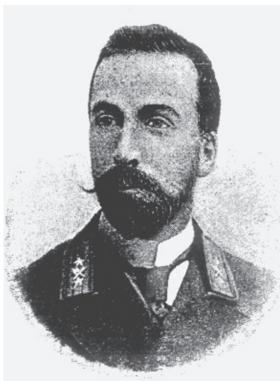
Р.П. Голенищев (портрет с фотографии конца XIX века)

В архиве Государственного банка сохранилось Дело об определении Р.П. Голенищева