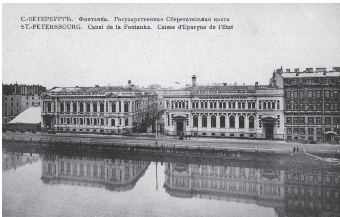
Здание Государственной сберегательной кассы (Санкт-Петербург, Набережная реки Фонтанки). Открытка. Начало XX века