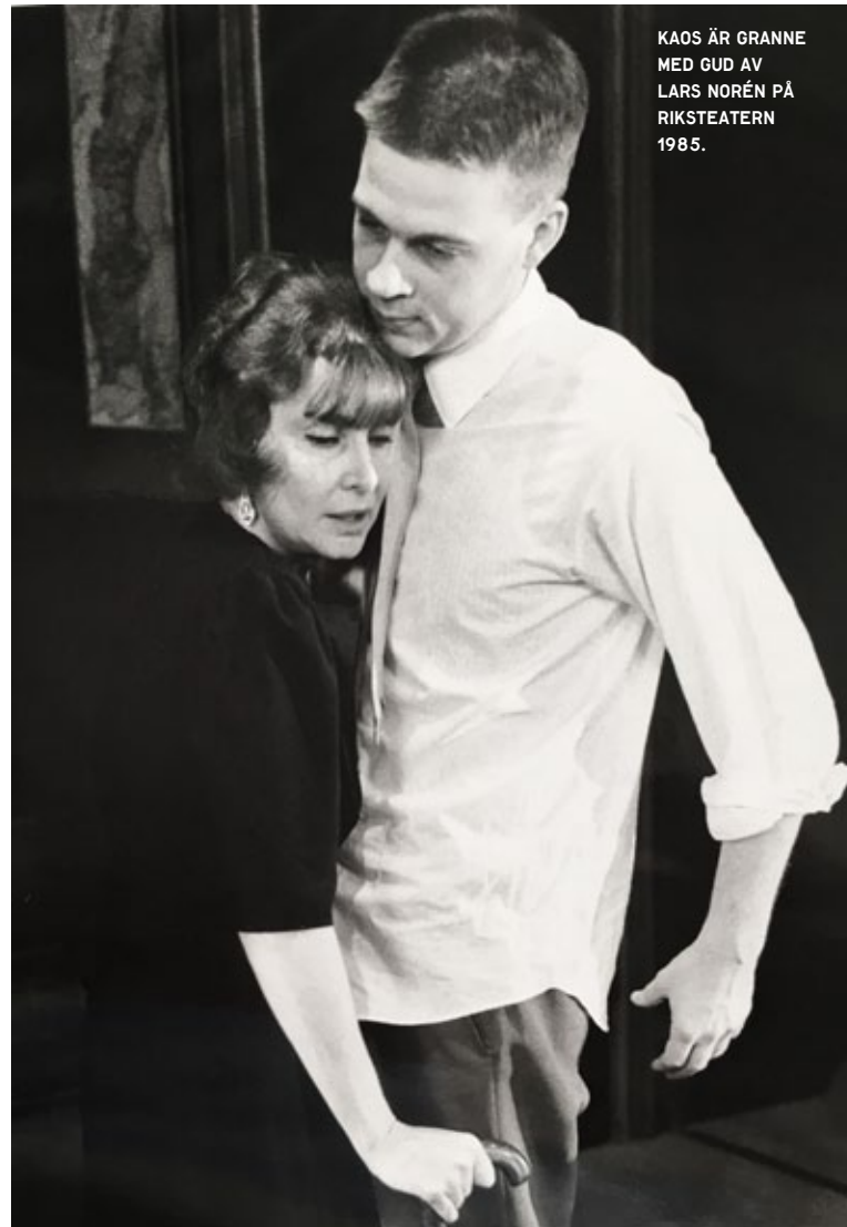
KAOS ÄR GRANNE MED GUD AV LARS NORÉN PÅ RIKSTEATERN 1985.