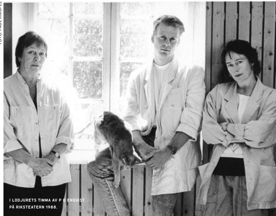
I LODJURETS TIMMA AV P O ENQUIST PÅ RIKSTEATERN 1988.