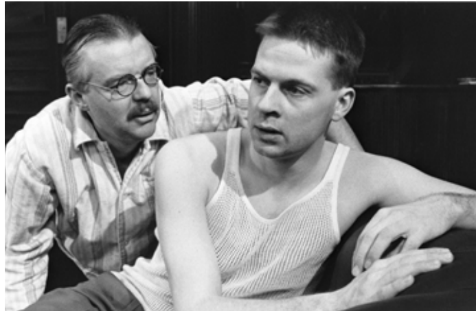
KAOS ÄR GRANNE MED GUD AV LARS NORÉN PÅ RIKSTEATERN 1985.

»Men visst blev vi nervösa i alla fall strax innan den här riktiga premiären«, erkänner de alla med en mun sedan pärsen väl är över.