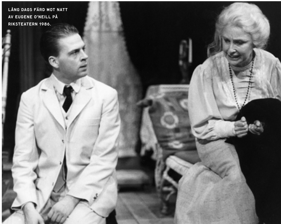
LÅNG DAGS FÄRD MOT NATT AV EUGENE O'NEILL PÅ RIKSTEATERN 1986.