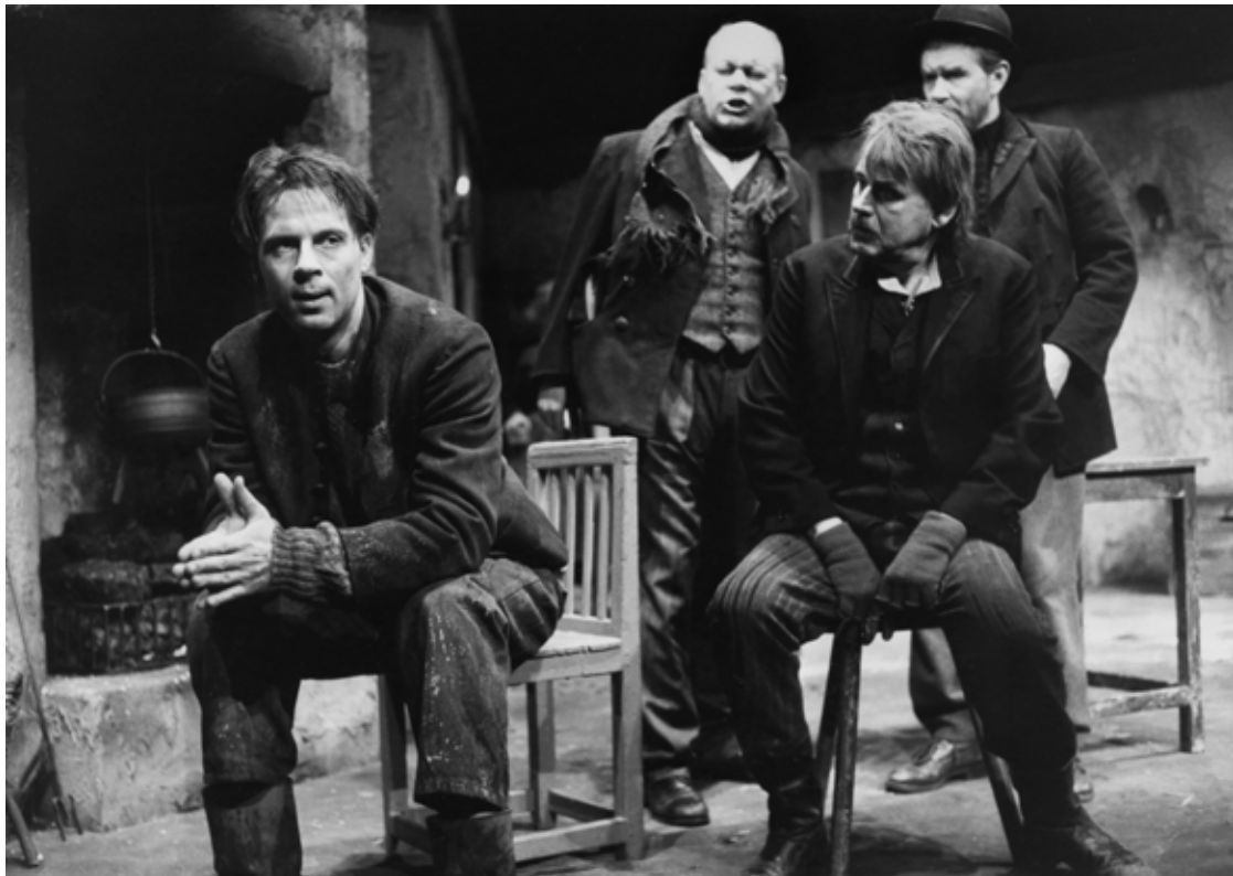
HJÄLTEN PÅ DEN GRÖNA ÖN AV JOHN MILLINGTON SYNGE PÅ RIKSTEATERN 1987.

EN TUMMAT BLAD i ett kollegieblock. Sextioåtta punkter med Bennys handstil var hans ansökan. Jobbet blev hans och han jublade. »Tack. Min dröm har gått i uppfyllelse, Stockholms stadsteater ska bli en angelägenhet för alla stockholmare. Ge mig det som uppdrag är du snäll!«