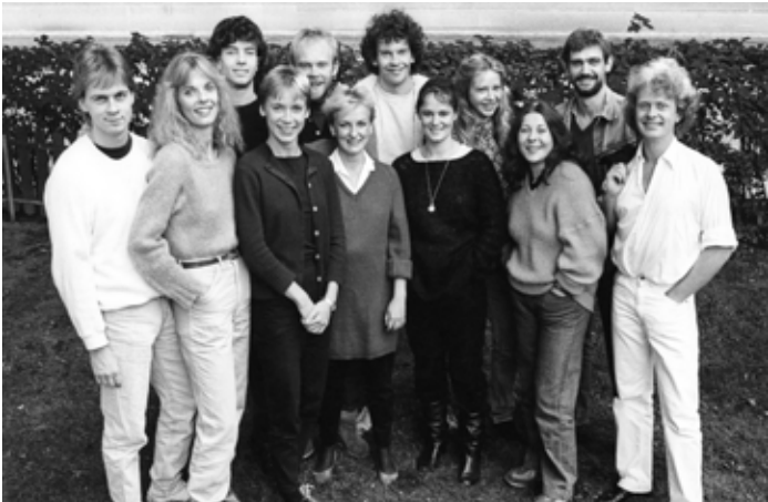
BENNYS KLASS PÅ SCENSKOLAN I STOCKHOLM 1982.