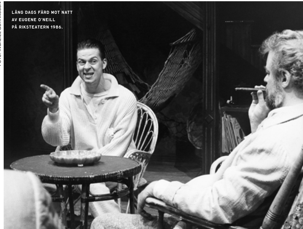
LÅNG DAGS FÄRD MOT NATT AV EUGENE O'NEILL PÅ RIKSTEATERN 1986.