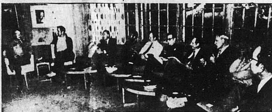
Новообраний президент Картер і віцепрезидент Мондейл під час наради з новонайменованими членами Уряду під час наради на острові св. Сімона. На фото (зліва): Джіммі Картер, Волтер Мондейл, Сесіл Елдрюс, Елдрю Янг, Боб Бергленд, Геролд Бровн, Майкел Блументал, Джеймс Шлесінджер, Чарлс Шульце і Гріффіні Бел.

Ст. Сімонс, Джорджія. — Новообраний президент ЗСА Джіммі Картер зустрівся у вівторок, 28-го грудня ц. р., у відпочинковій місцевості Ст. Сімонс Авленд з членами свого кабінету та деякими спеціалістами поодиноких ділянок і просив їх, щоб кожний з них окремо і всі спільно, після перебрання Адміністрації від президента Форда 20-го січня 1977 р., працювали в напрямі сповнення обіцянок, даних американському народові в часі виборчої кампанії.