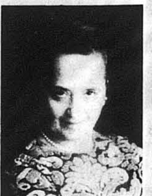
Проф. Валентина Переславцев

Нью Йорк. — В грудні ц. р. українська громада в ЗСА і американські балетні кола відзначили подвійний Ювілей української прима-балерини Валентини Переславцев, яка пістолити працює на сцені 1976-го театру, балетних шкіл і студій українських і неукраїнських, та чверть століття зокрема є провідним педагогом-хореографом в ньюйоркському Американському Балет-Театрі.