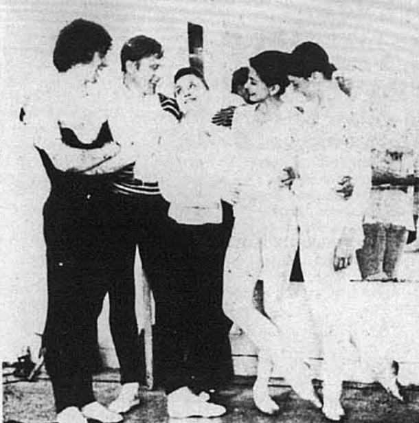
В Американському Балет-Театрі в Нью Йорку (зліва направо): Рудольф Нурсев, Ерік Брюн, Валентина Переславець, Маргог Фонтейн і Карла Фраччі.

Артистка ніколи не забуде того триумфального вечора: Копеліса грав сам Рябєв; після другої дії їх обох публіка вітала оваційно, особливо же ентузіастично оплескували молоденьку дебютантку. Вони дістала два велетенські