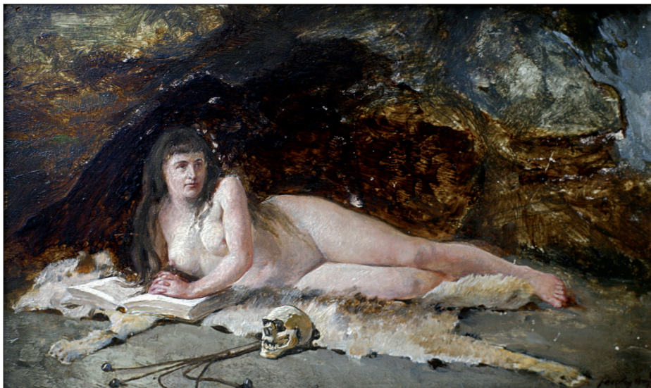
23. Mária Magdolna, 1910 körül, olaj, fa, 18x30 cm, magántulajdon