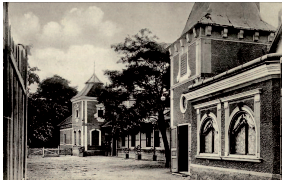
3. A Feszty (egykori Szuha) kúria Ógyallán az 1910-es években