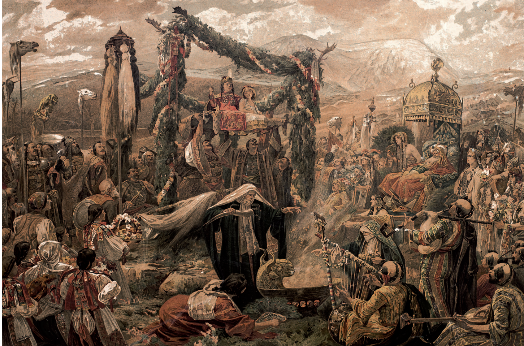
22. Zsolt eljegyzése Hamzsával, 1898, színes nyomat (eredetije 1896–1898, olaj, vászon, 400x600 cm, lappang)

Máig Komárom városának büszkesége, és egyben a Duna Menti Múzeum féltett kincse – a lenyűgöző méretű alkotás, A bánhidai csata. A kép a honfoglalás döntő csatáját ábrázolja, melynek során Árpád legyőzte a szláv vezért, Szvatoplukot, és ezzel elnyerte a Kárpát-medence feletti teljes uralmat. A kompozíció kissé túlszűfolt, ugyanis a festő az alkotást megelőző gondos történelmi kutatás szinte valamennyi eredményét ábrázolni kívánta. A kiváló színezésű, hangulatos tájképi részletek is hozzájárulnak a mű hatásához. Érdekességként említendő, hogy a festményen ábrázolt fegyverek modellje szintén megtekinthetők a Duna Menti Múzeum gyűjteményében, mely intézmény a Feszty-örökösöktől vásárolta azokat.