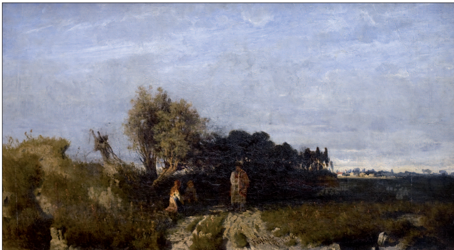
6. A pásztor (Ógyallai füzes), 1878, olaj, vászon, 44x78 cm, Duna Menti Múzeum, Komárom

Fesztyre jelentős hatást gyakorolt még Mészöly Géza, akinek müncheni műtermében szintén gyakran megfordult. Az idősebb mesterhez hasonlóan, ezekben az években ő is főként alföldi tanyákat ábrázoló tájképeket készített. A művészetek bőkezű támogatója, Ipolyi Arnold püspök is felfigyelt a tehetséges festőre. Az ő megrendelésére festette 1878-ban a Barsszentkereszti püspöki park című képet, mely jelenleg az esztergomi Keresztény Múzeumban