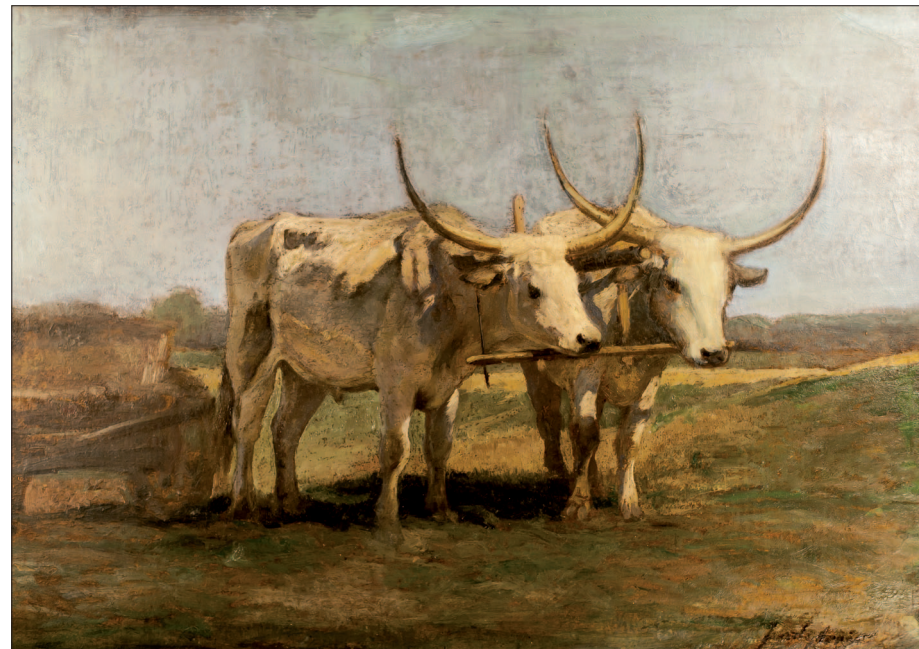
21. Ökrösfogat (tanulmány a körképhez), 1892 körül, olaj, karton, 48x70,5 cm, magántulajdon

kat dédelgetett. A házaspár a Bajza utca 21. (ma 39.) szám alatt építtette fel emeletes villáját, melyet főként a velencei nászútjukról hozott tárgyakkal rendeztek be. Az épületben, a lakoszobák mellett helyet kapott Feszty hatalmas műterme és egy külön lakosztály is Jókainak, aki második házasságának megkötéséig velük lakott a legigazabb szeretetben és egyetértésben. A házaspár az 1890-es évek elején hozta létre a kor legjelentősebb művészeti szalonját, az ún. Feszty-szalont, ahol rendszeresen találkoztak a magyar képzőművészet, irodalom és társadalom legkiválóbb tagjai. A szellemi műhelyként is funkcionáló szalon sokat segített abban, hogy a XIX. századi megrendelői réteg, és a művészek közelebb kerüljenek egymáshoz. Ilyen környezetben született meg a magyar historizáló történelmi festészet legnagyobb méretű, és egyik leghíresebb alkotása – A magyarok bejövetele elnevezésű körkép. A körkép elnevezés helyett kifejezőbb a cikloráma – ugyanis ez magában foglalja a mesterségesen kiépített előteret is, mely szintén a mű részét képezi.