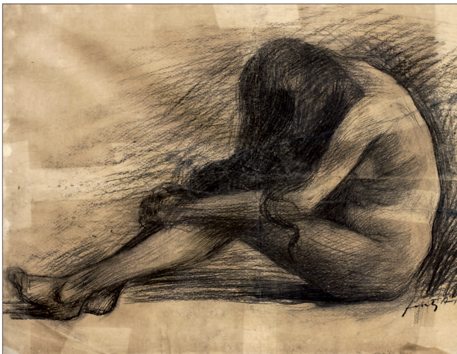
24. Vázlat egy szláv rabnő alakjához, 1892–1894, szénrajz, papír, 43x55,5 cm, magántulajdon