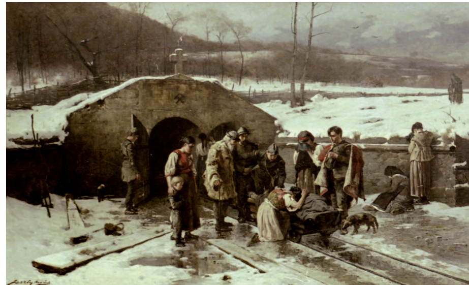
17. Bányaszerencsétlenség, 1885, olaj, vászon, 145x250 cm, Központi Bányászati Múzeum, Sopron

Feszty Árpád az 1880-as években nemcsak tájképekkel és murális munkákkal foglalkozott, hanem számos életképpel is képviseltette magát az Országos Magyar Képzőművészeti Társaság tárlatain. A segélyére várakozó, megtört negyvennyolcast ábrázoló Rokkant honvéd című – jelenleg lappangó – alkotásával kapcsolatban a korabeli kritika kiemelte az alak megformálásában kifejezésre jutó mély humánusmot.