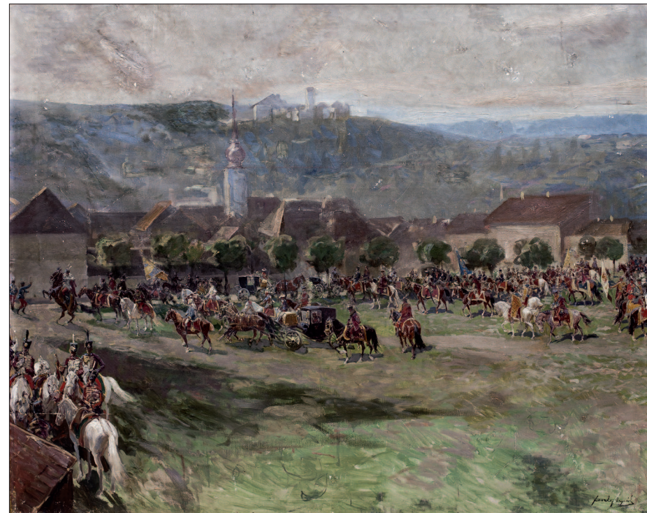
13. Az 1848-as szabadságharc ötvenéves jubileumi felvonulásának terve, 1898, olaj, vásznon, 115x147 cm, magántulajdon

hangulati aláfestését szolgáltatják a bravúrosan megfestett szétszórt sziklatömbök és a jelenetet uraló viharos égbolt.