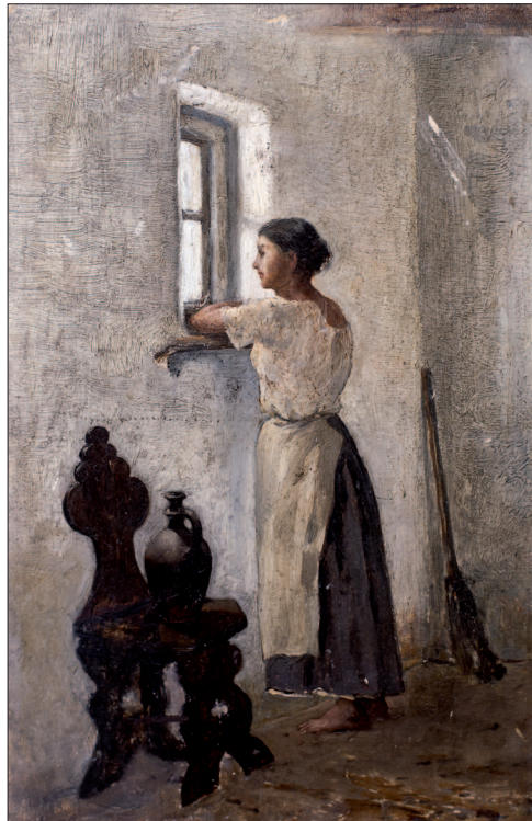
9. Bámészkodó lány, 1881 körül, olaj, fa, 25x15 cm, magántulajdon

A következő évben Feszty a Pusztai találkozás télen című alkotásával ért el nagy sikert. A kép érdekességét és feszültségét a havas tájban vágató betyár, és egy hóban fekvő halott alakja szolgáltatja. A művész 1880-ban és 1881-ben a bécsi Képzőművészeti Akadémián folytatta tanulmányait Eduard Lichtenfels felügyelete alatt. Az Országos Magyar Képzőművészeti Társulat 1881-es évi őszi tárlatán kiállította Golgota című festményét, mely csakhamar ismertté tette nevét. A kép különlegességéeként említendő, hogy a szakrális téma (a megfeszített Krisztus) ábrázolása háttérbe szorul a táji környezet mellett. A golgotai tragédia megjelenítésének erőteljes