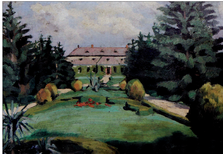
4. Ehrenfeld Antal ógyallai kastélya és parkja, 1875 körül, olaj, karton, 57,5x89 cm, magántulajdon

A fiatal művész ugyan az iskolát rendszerint kerülte, de sok időt töltött a német város múzeumaiban és galériáiban, valamint a kiváló lengyel tájképfestő, Karl Kubinsky műtermében. Feszty olyan jó kapcsolatot ápolt vele, hogy 1880-ban meghívta Ógyallára is. Onnan utaztak aztán tovább a Balkánra, hogy vázlatokat készítsenek egy Rudolf főhercegnek szánt album számára.