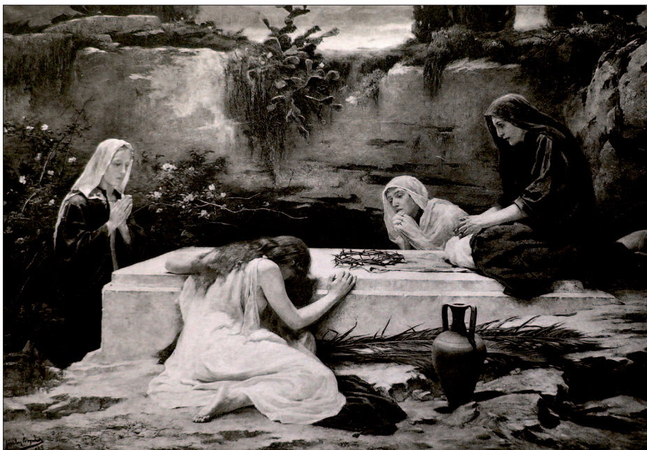
20. Sirató asszonyok Krisztus sírjánál, 1889, olaj, vászon, lappang

Feszty Árpád 1888-ban – a vele közel egy évtizede szoros kapcsolatban álló Jászai Marival történő viharos szakítását követően – feleségül vette Jókai Mór fogadott leányát, Jókai Rózát (1861–1936), aki szintén festői ambíció-