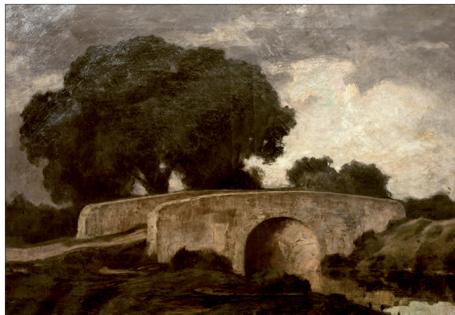
5. Ógyallai híd, 1875 körül, olaj, karton, 70x110 cm, Duna Menti Múzeum, Komárom (Szlovákia)