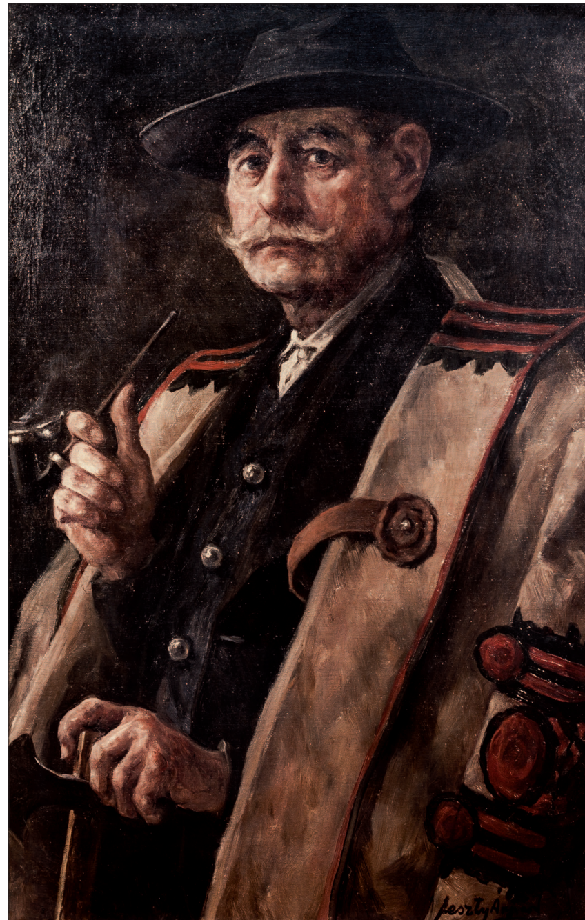
8. Pipás parasztember, színes nyomat, 59x39 cm, magántulajdon (eredetije 1907–1913, olaj, vászon)