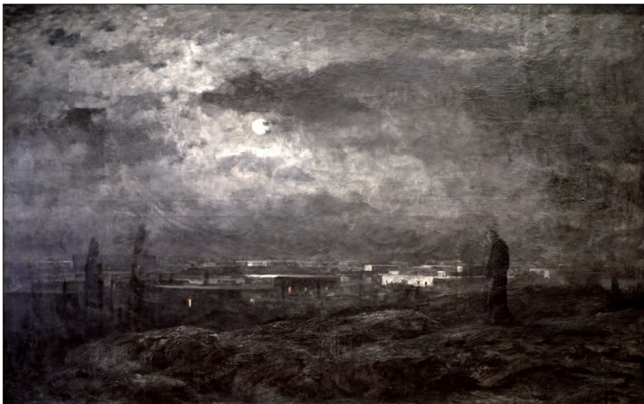
16. Jeruzsálem felett, 1910–1911, olaj, vászon, 160x250 cm, Duna Menti Múzeum, Komárom

Az operaházi falképek nagy sikere számos újabb megbízást hozott a művésznek, aki így budai Erzsébet kórház (ma Sportkórház) számára elkészítette az Alamizsnát osztó Szent Erzsébetet és a Vöröskereszt áldásos tevékenységét bemutató sekkókat, a Kerepesi (ma Rákóczi) úti Nemzeti Színházban pedig Homéroszt és Szapphót ábrázoló falképeket festett. Az 1885-ös évi Országos Kiállítás királyi pavilonjába négy frízt készített, melyeken Székely Bertalan műveinek mintájára az évszakokat megjelenítő puttócsoportok voltak láthatók.