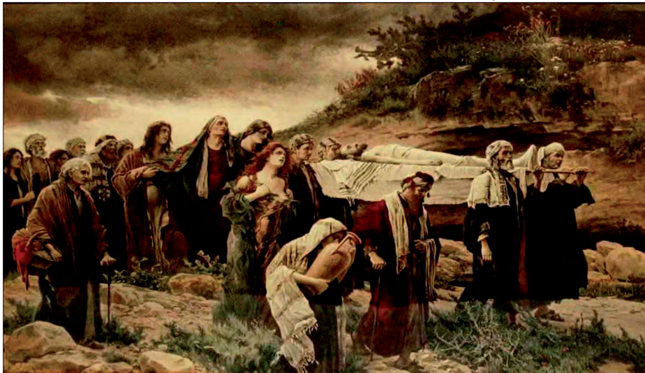
10. Triptichon középső része – A sírbavitel, műlap, 1901, magántulajdon (eredetije 1899–1901, olaj, vászon, 400 x 680 cm, Aradi Megyei Múzeum, Románia)