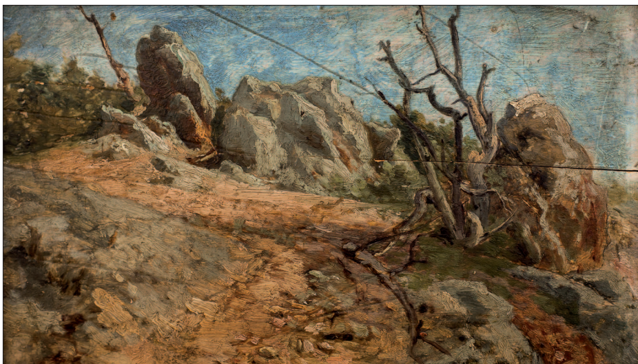
7. „Orlovo bojeste” – a sasok harctere (tájkép Feszty balkáni útjáról), 1880, olaj, fa, 16x26 cm, magántulajdon

Fesztyre jelentős hatást gyakorolt még Mészöly Géza, akinek müncheni műtermében szintén gyakran megfordult. Az idősebb mesterhez hasonlóan, ezekben az években ő is főként alföldi tanyákat ábrázoló tájképeket készített. A művészetek bőkezű támogatója, Ipolyi Arnold püspök is felfigyelt a tehetséges festőre. Az ő megrendelésére festette 1878-ban a Barsszentkereszti püspöki park című képet, mely jelenleg az esztergomi Keresztény Múzeumban