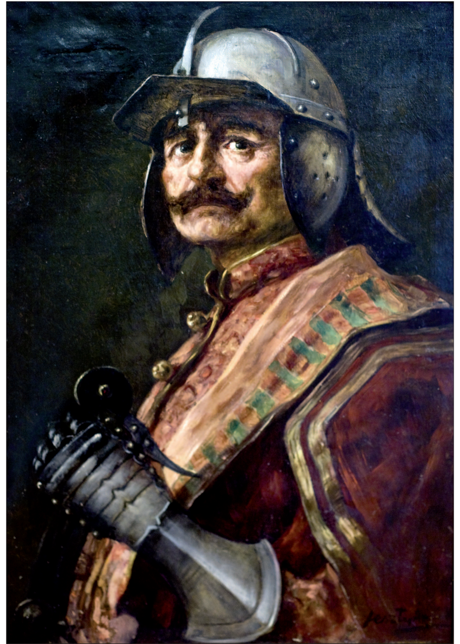
11. Sisakos vitéz, 1907–1913, olaj, vászon, 74x50 cm, Duna Menti Múzeum, Komárom