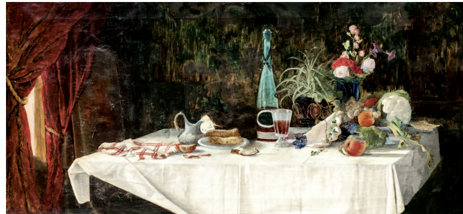
26. Reggeli után, 1877, olaj, vászon, 76x159 cm, magántulajdon

Letzte Seite: Grabmal des Árpád Feszty in der Familienkrypta Feszty in Hurbanovo