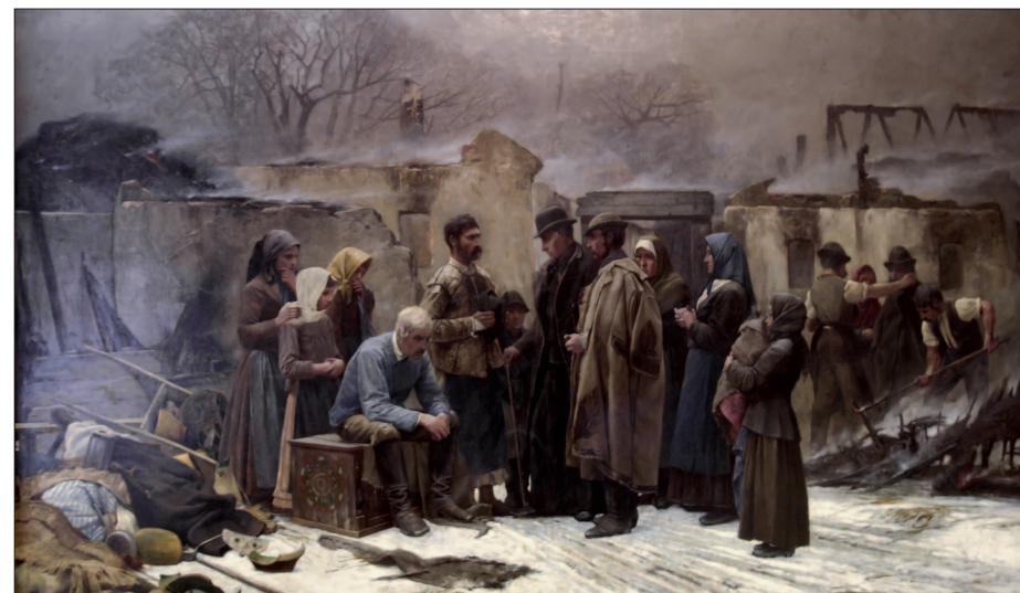
18. Kárvallottak, 1886–1887, olaj, vászon, 150x260 cm, Tűzoltó Múzeum, Budapest

Hasonló empátia és részvétel érzékelhető Feszty 1885-ben festett Bányaszerencsétlenség című művén is, mely egy bányabejárat előtt kiterített halottat, és az őt gyászolókat ábrázolja. A mű ötlete előző év végén, Nagybányán született, ahol barátja, gróf Teleki Sándor meghívására töltött pár hetet.