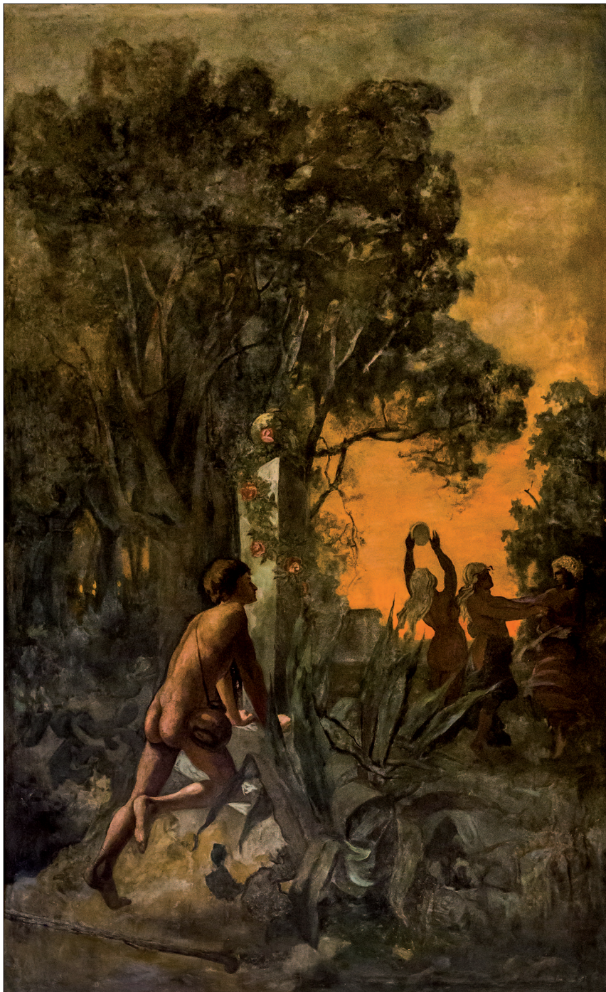
14. A múzsák tánca, 1883, szekő, 280x170 cm, Magyar Állami Operaház büféterme, Budapest