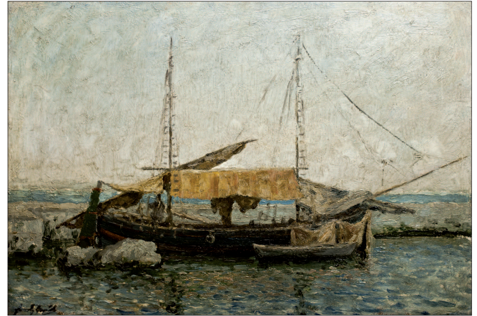
25. Lovranai bárka, 1914, olaj, vászon, 30x40 cm, magántulajdon

A nagy anyagi hasznot nem eredményező kiállítás után Feszty Árpád tovább festette kisméretű zsánerképeit, majd 1913 telén fűtetlen műtermében súlyosan meghűlt. Emiatt szanatóriumi kezelésre szorult, majd egyik rokona anyagi támogatása lehetővé tette, hogy kiutazzon a Földközi-tenger mellett fekvő Lovranába (ma Lovran, Horvátország), ahol élete utolsó heteit töltötte