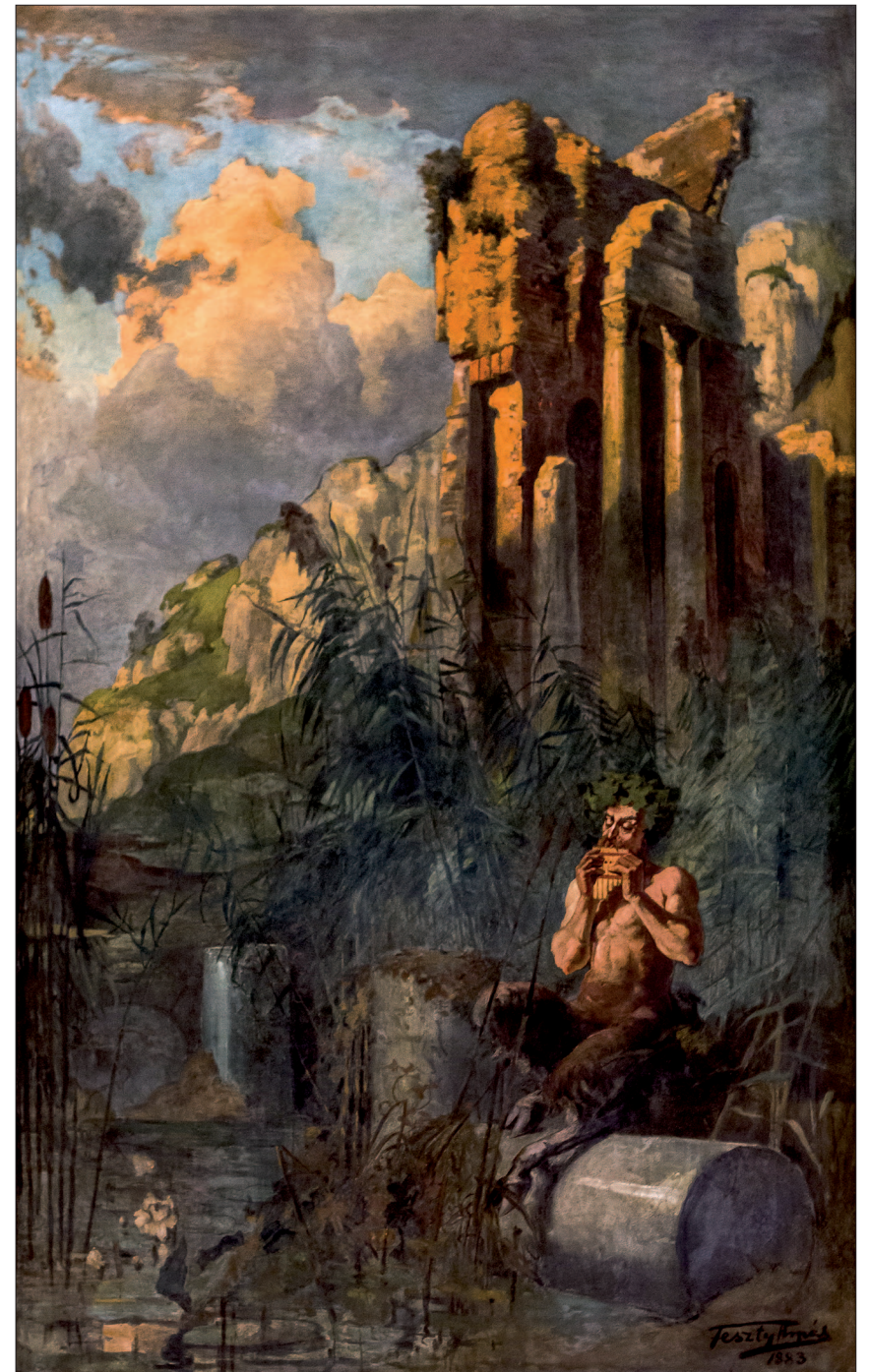
15. A Faun zenéje, 1883, szekő, 280x170 cm, Magyar Állami Operaház büféterme, Budapest