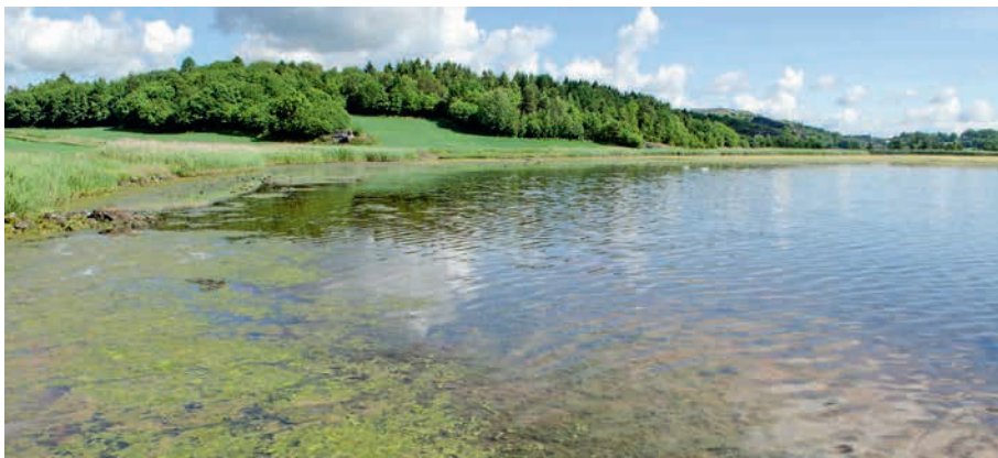
Indre Viksfjord mot Klåstadkilen. ▲

Klåstadkilen var opprinnelig en lang og smal kil som strakte seg fra indre deler av Viksfjord og innover mot Klåstadkryset. På begge sider av kilen og bekkeløpet var det beitede strandenger, som ble mer eller mindre oversvømt ved høyvann.