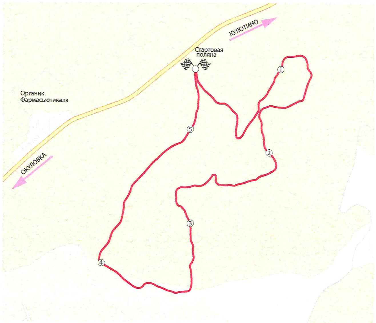
Схема основных дистанций

5,275 KM. = 1 КРУГ 10,55 KM. = 2 КРУГА 21,1 KM. = 4 КРУГА