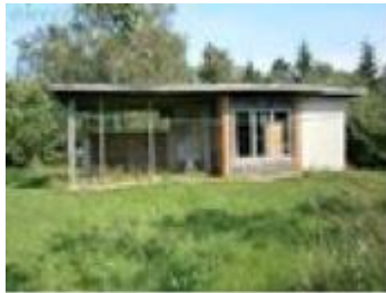
Näide tüüpilisest suvemajast.

Väljajagamisele kuulus Randvere tee äärne hooletusse jäetud märg lepavõssa kasvanud maa, kus uued asunikud pidid umbes 1000 m 2 -sed krundid esmalt lepavõsast ja kivi-külvist puhastama. See oli ränk töö, aga vaatamata raskustele kerkisid umbes 60-100m 2 hoonealuse pinnaga suvilad kiiresti, vaatamata tol ajal valitsenud ehitusmaterjalide kroonilisele puudusele. Puitmaterjali puudust aitas leevendada 1967. a orkaani mõõtu torm, mis rasis pea kogu Eestit. Kuna puitu oli metsades loogu maas, siis anti inimestele võimalus ise metsast materjali teha. Pea kõik Eesti selle aja suvilapiirkonnad on rajatud tollest tormipuidust. Enamus ehitas oma suvilad ise. 1970-ndatel olid enamikul suvilad valmis ja kasutuses. Rajati ka suvine veevõrk, mida toitis puhta veega ühiselt Ploomi teele rajatud pumbamaja, mis pumpas põhjavett 110 m sügavuselt arteesiavee kihist. Kõigil suvilatel olid kuivkäimlad. Sadevee äravoolud rajati osaliselt ühistööna 1970-ndatel käepäraste vahenditega. Riigi osa lõppes detailplaneeringu kehtestamisega ja pinnasteede rajamisega.