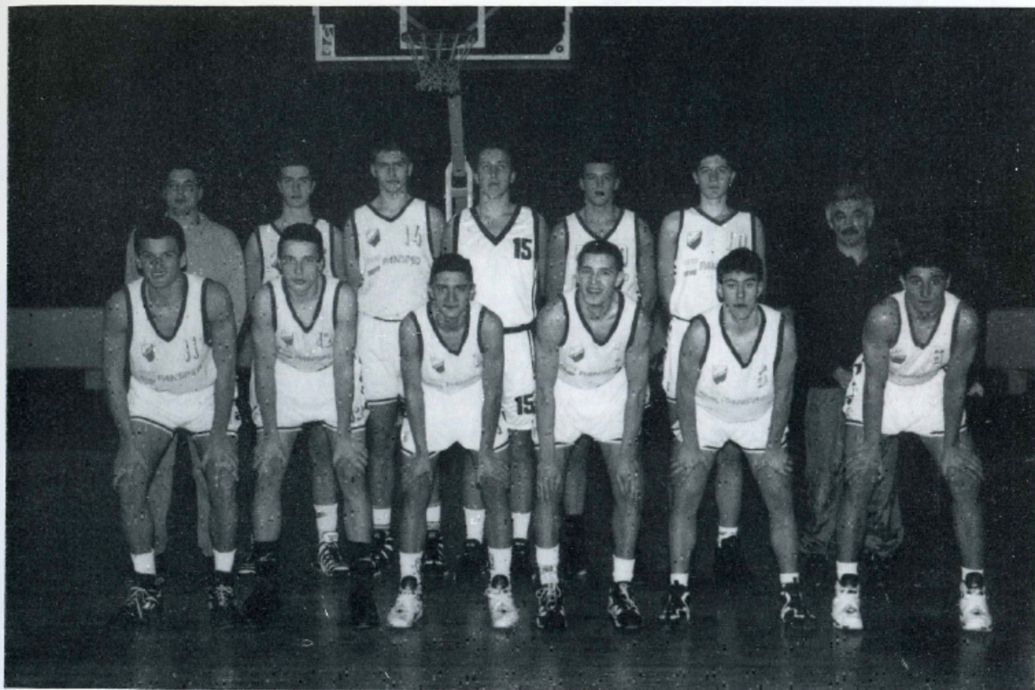
KADETSKI PRVACI SRBIJE SEZONA 1995/96 GODINA