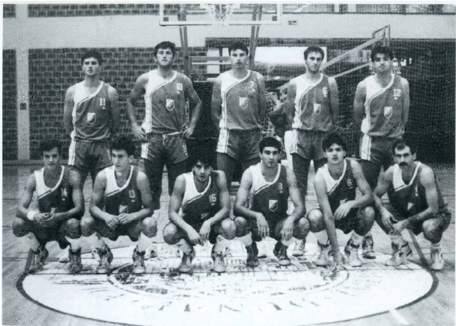
USPEŠNI U PRVOJ "A" SAVEZNOJ LIGI - SEZONA 1989/90. GODINA