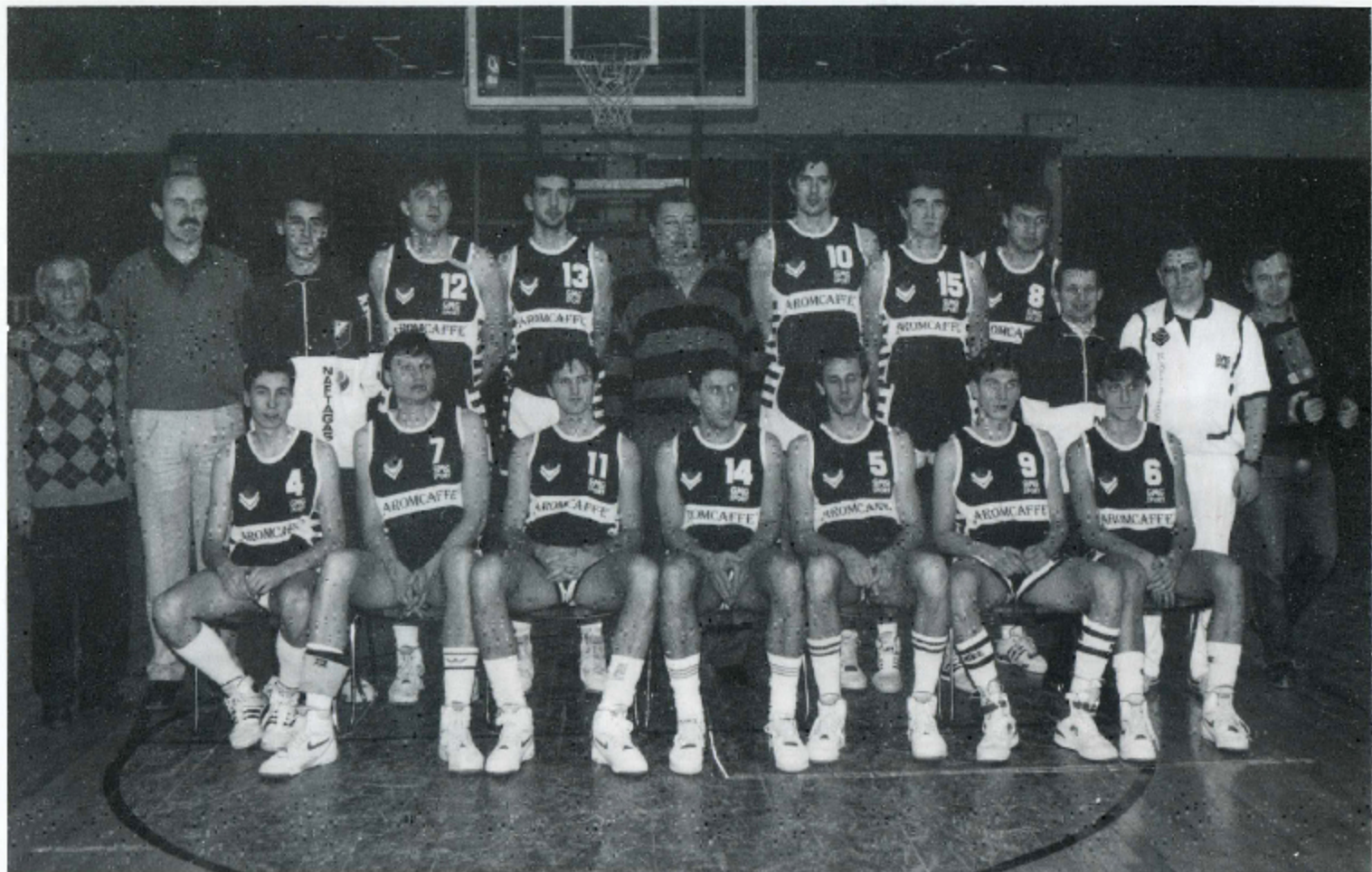
UČESNICI EVROPSKOG KUPA "RADIVOJ KORAC" - SEZONA 1990/91. GODINE