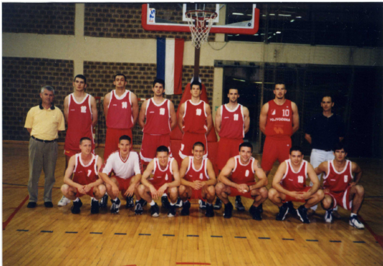
GENERACIJA VOJVODINE U SEZONI 2001/02. GODINE