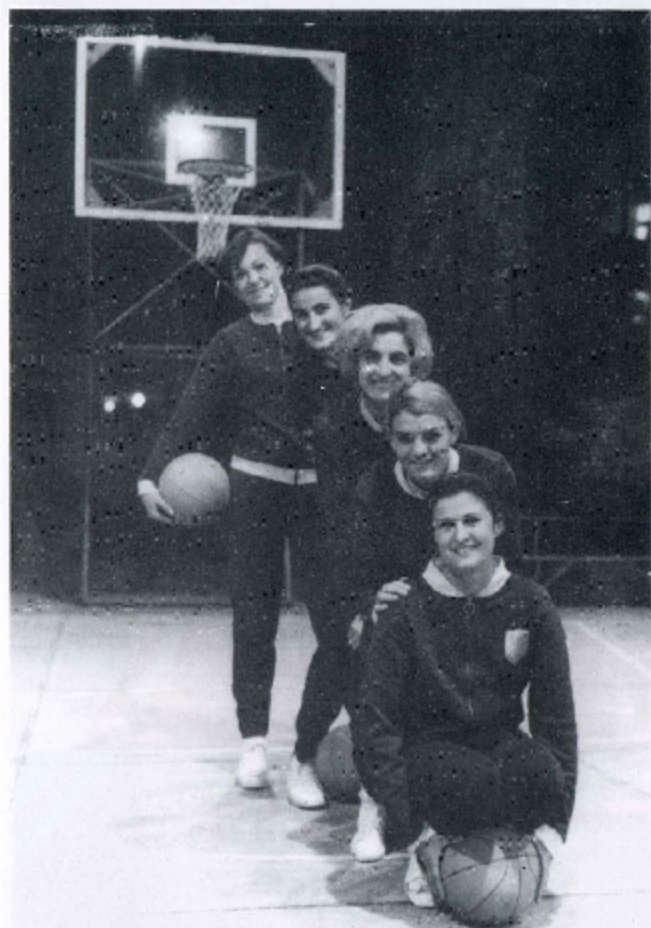
ŠAMPIONKE NA STAROM IGRALIŠTU U ANTONA ČEHOVA