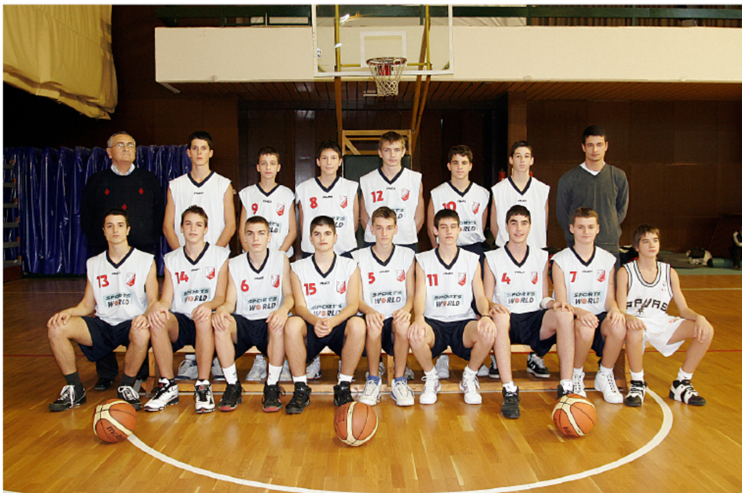
KADETI, SEZONA 2008/2009