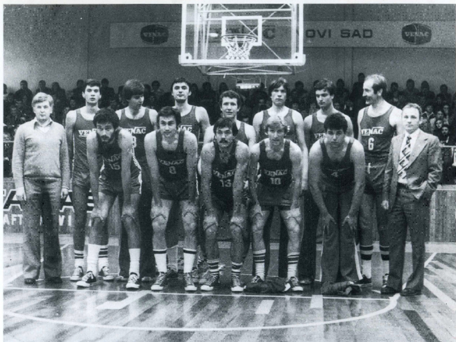
PLASMAN U PRVU "B" LIGU - GENERACIJA "CRVENO - BELIH" U 1978. GODINI