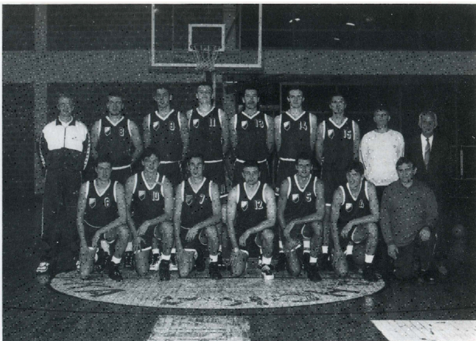
GENERACIJA VOJVODINE U SEZONI 1995/96. GODINE