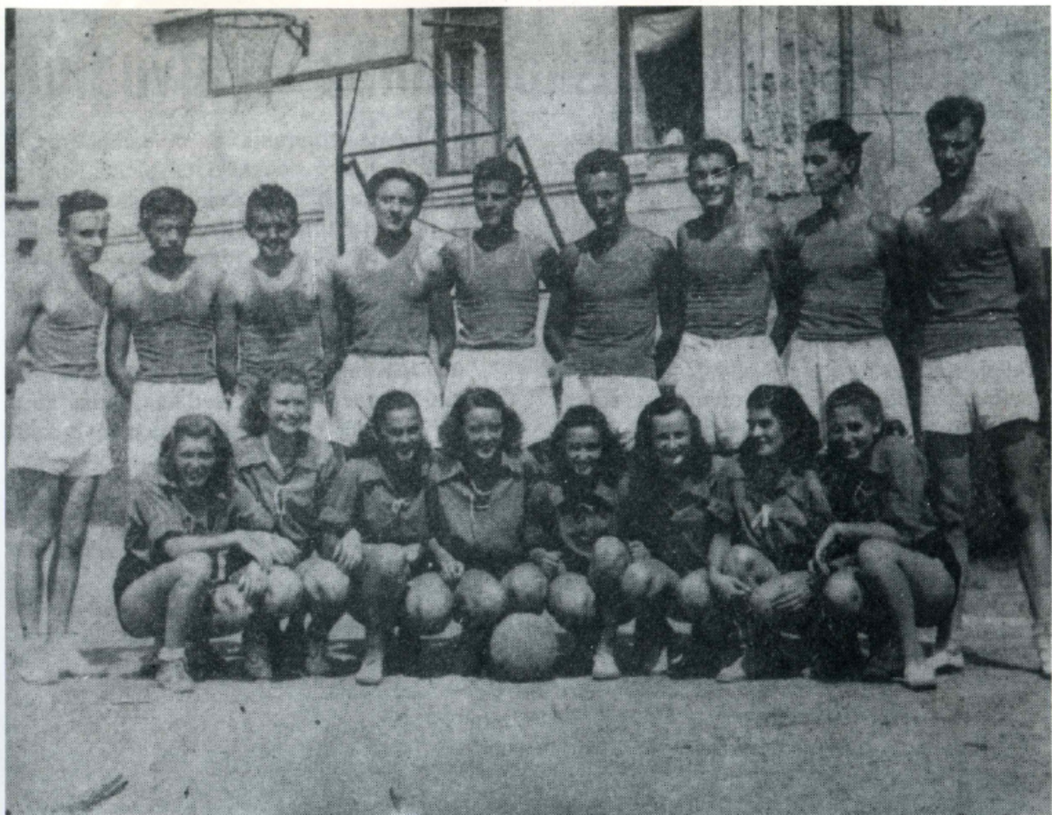
MUŠKA I ŽENSKA EKIPA IZ 1948. GODINE