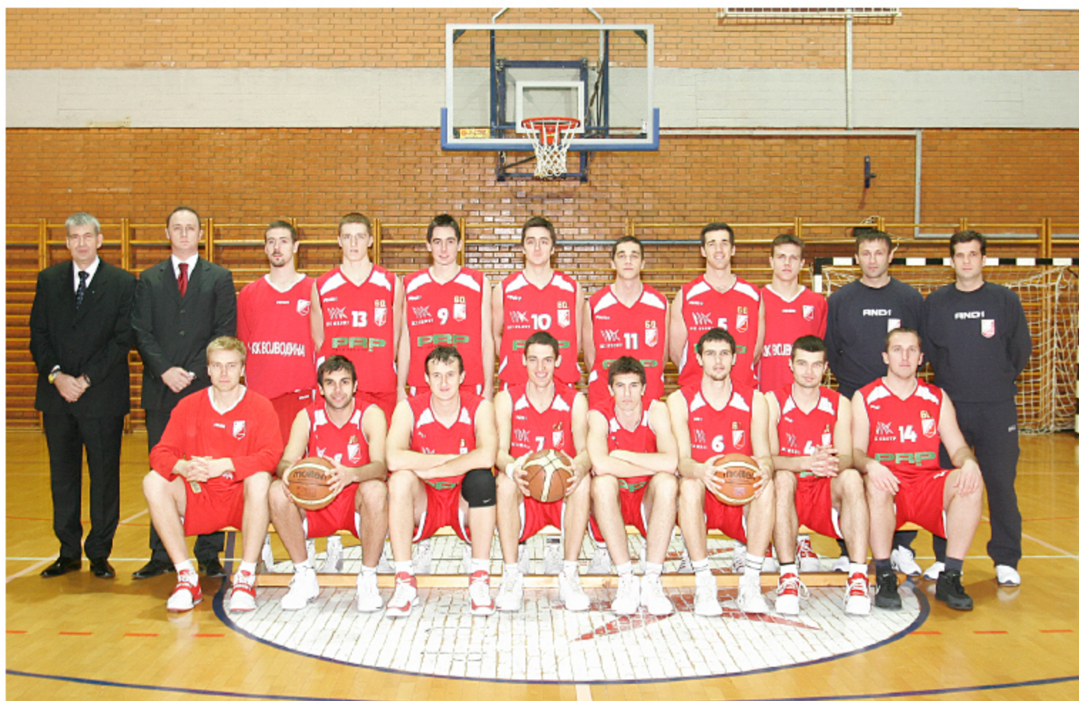
GENERACIJA VOJVODINE U SEZONI 2008/09. GODINE