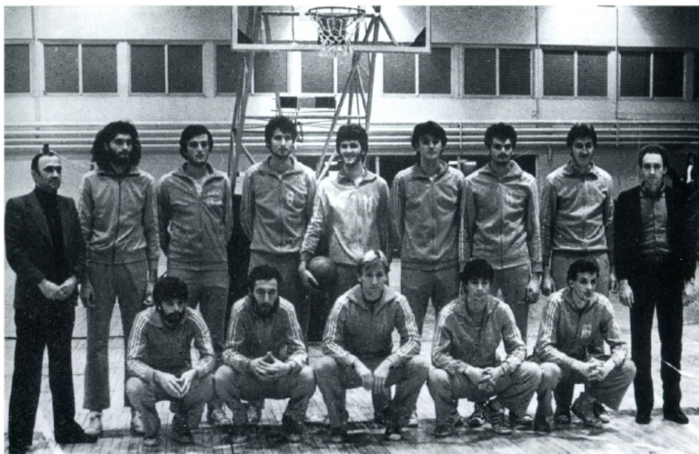
GENERACIJA VOJVODINE U SEZONI 1979/80. GODINE