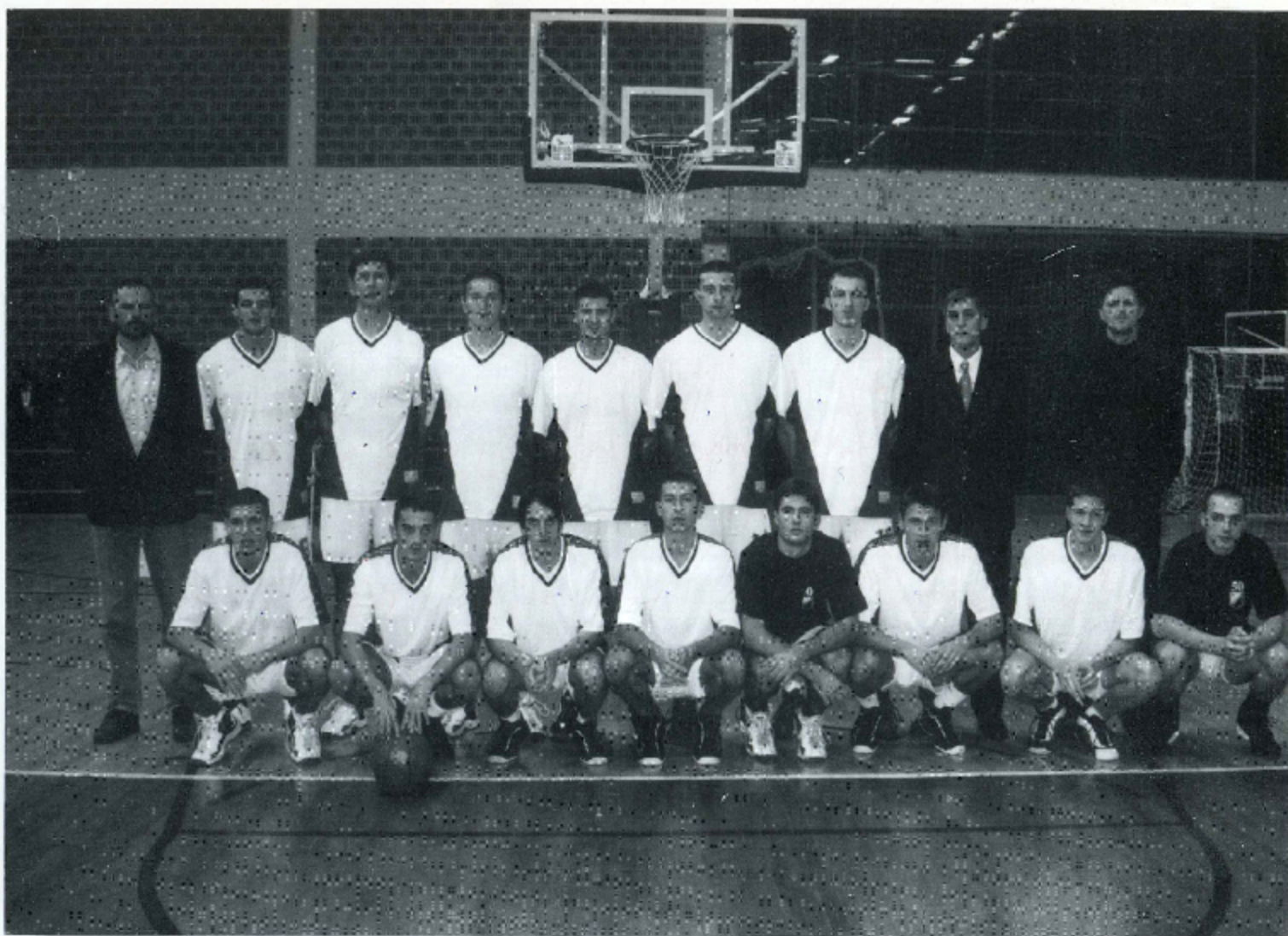
U GODINI JUBILEJA - GENERACIJA VOJVODINE U SEZONI 1998/99. GODINE