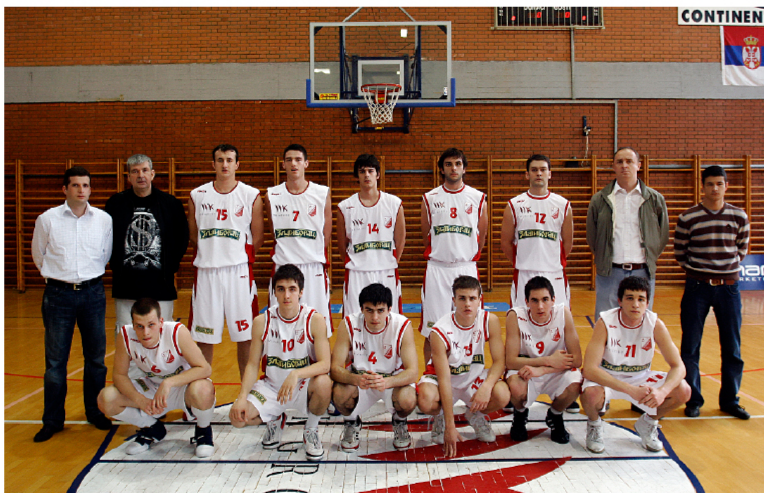
GENERACIJA VOJVODINE U SEZONI 2007/08. GODINE