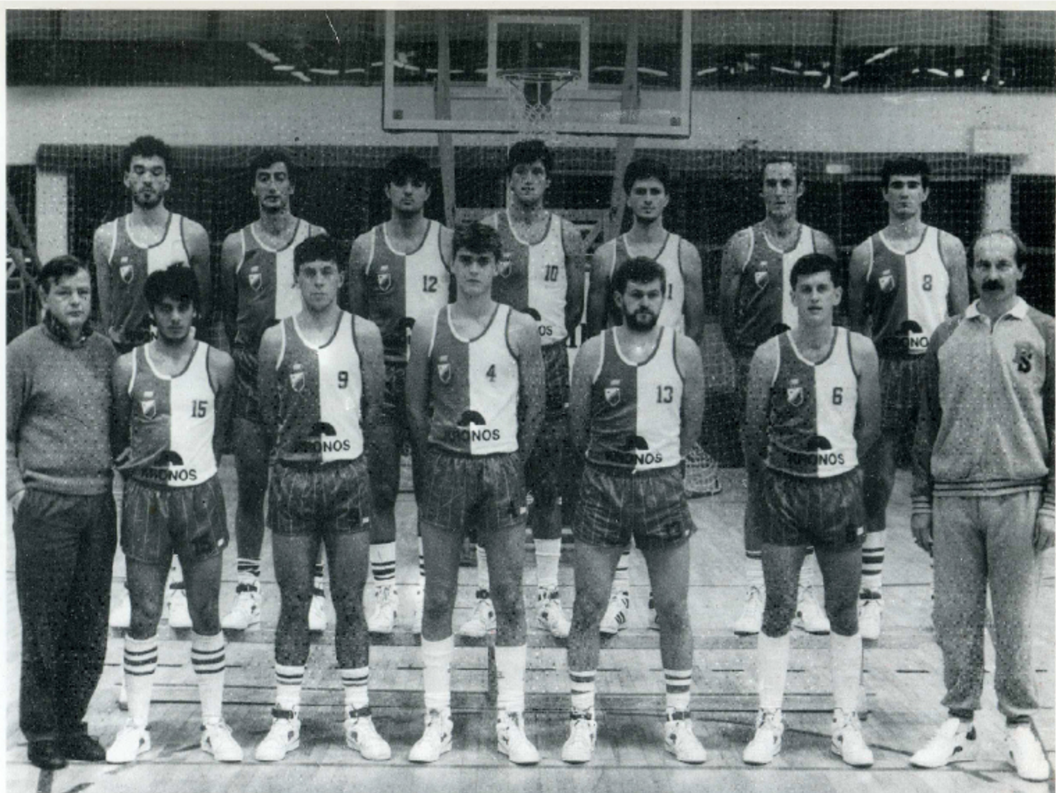
PRVACI PRVE "B" LIGE I NOVI ČLANOVI ELITE U SEZONI 1987/88. GODINE