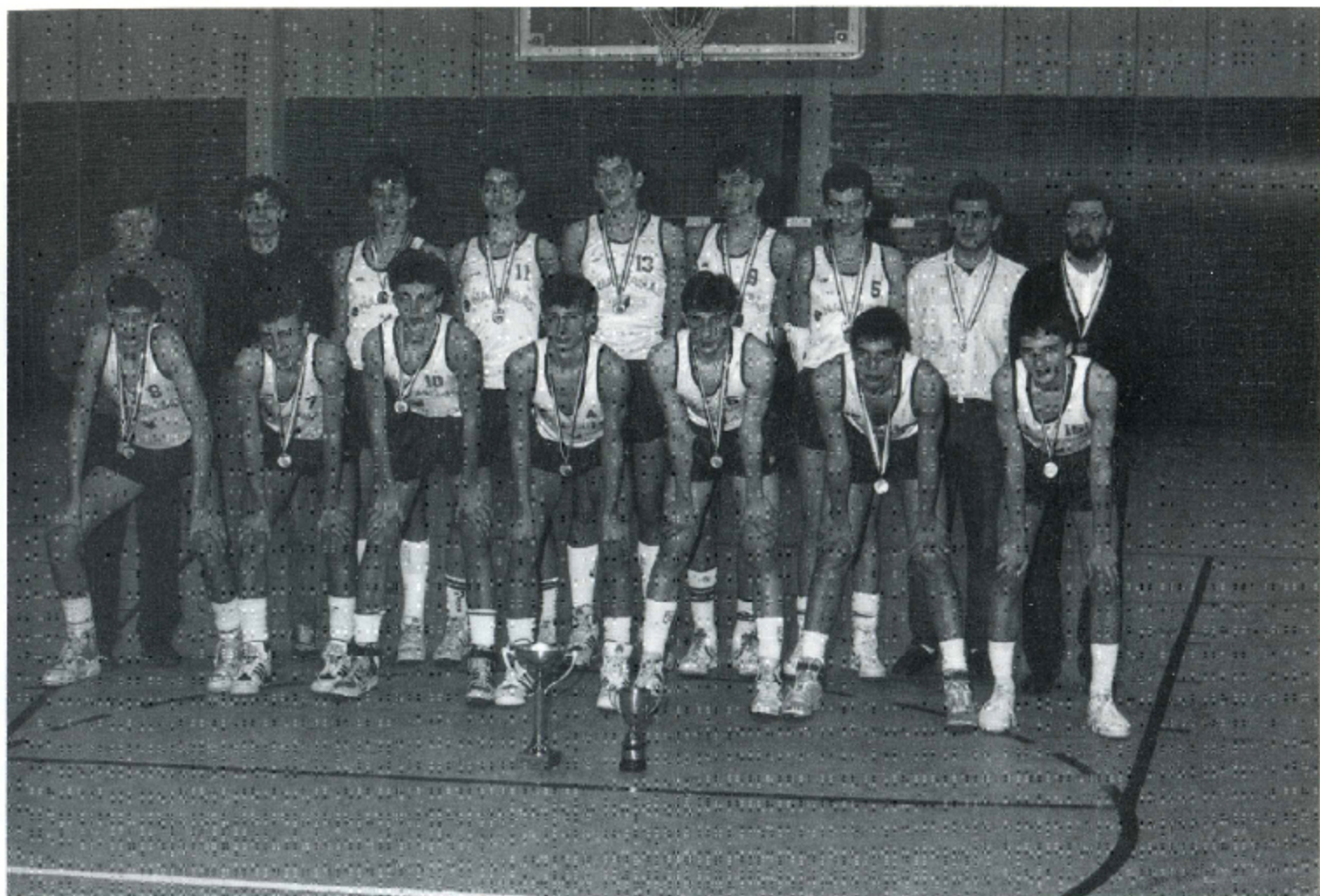
KADETSKI PRVACI JUGOSLAVIJE SEZONA 1988/89 GODINE VIROVITICA