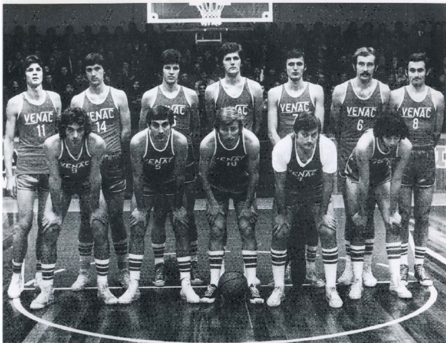
PRVACI DRUGE LIGE I NOVI ČLANOVI ELITE, GENERACIJA U SEZONI 1973/74.