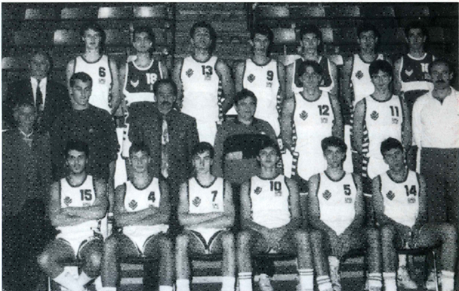
SJAJAN SPOJ ISKUSTVA I MLADOSTI U SEZONI 1991/92. GODINA