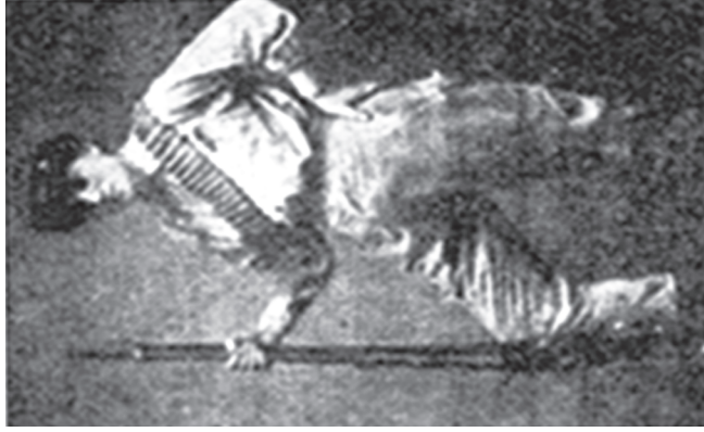
ՕՐ. ԱՎՅՈՒՆԻՆԵ ԽԱՆՋՅԱՆ (ՏԻԿ. Ա. ԹԱԹՈՒՆՅԱՆ)