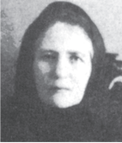
ՍՈՍԵ ՎԱՐԴԱՆՅԱՆ (ՍՈՍԵ ՄԱՅՐԻԿ) 1868-1953