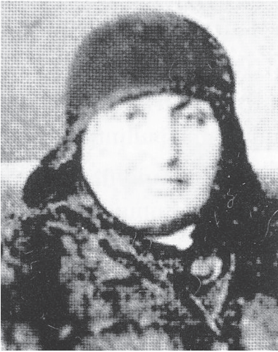
ՍՐԲՈՒՇԻ ՆՇԱՆԻ ԳԱԼՖԱՅԱՆ Հասարակական գործիչ