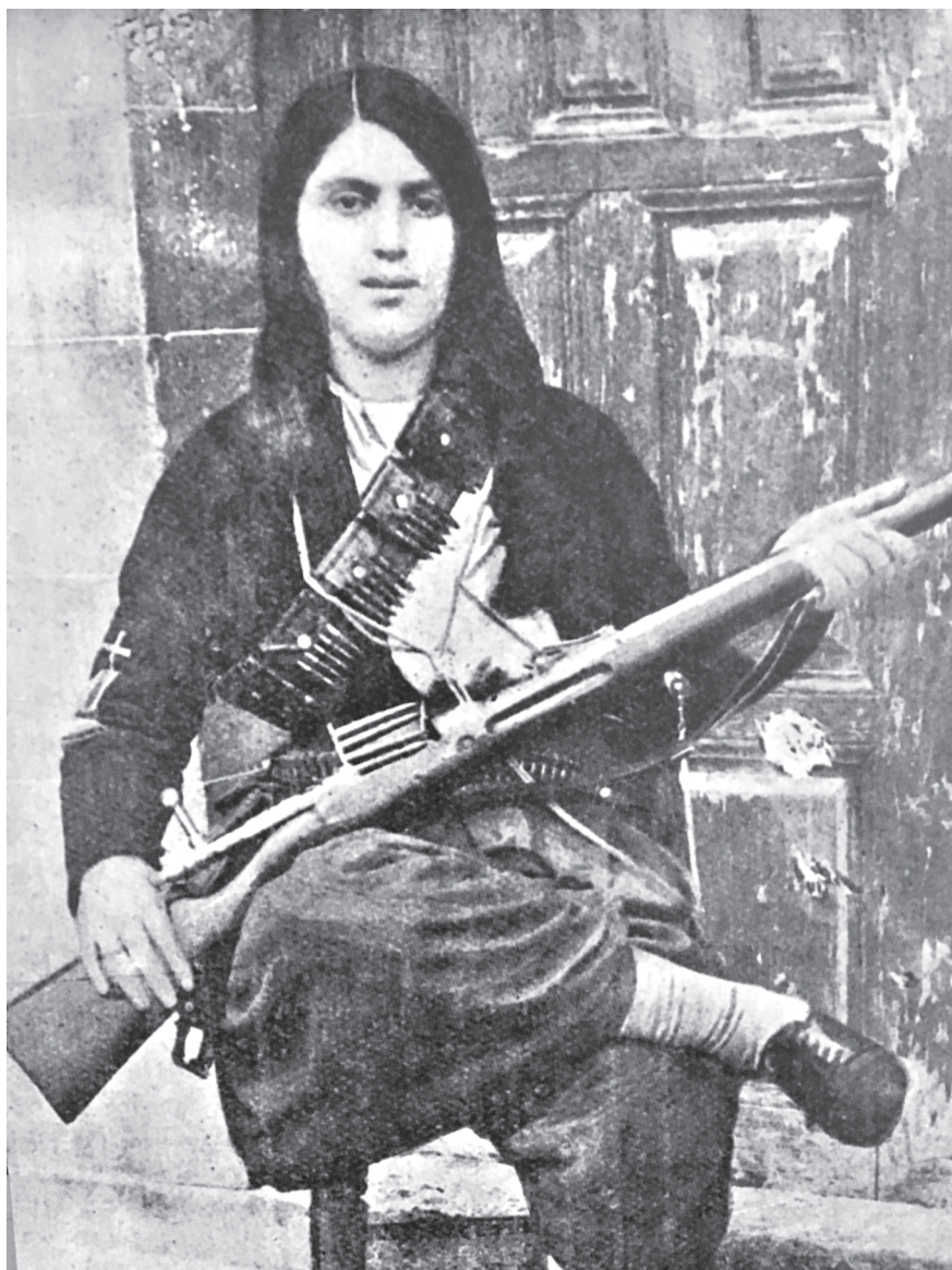
ՖԸՆՏԵՃԱԳՑԻ ՀԵՐՈՍՈՒԿԻ ԽԱԹՈՒՆ ՉԱՎՈՒՆ ՅԱՓՈՒՃՅԱՆԸ