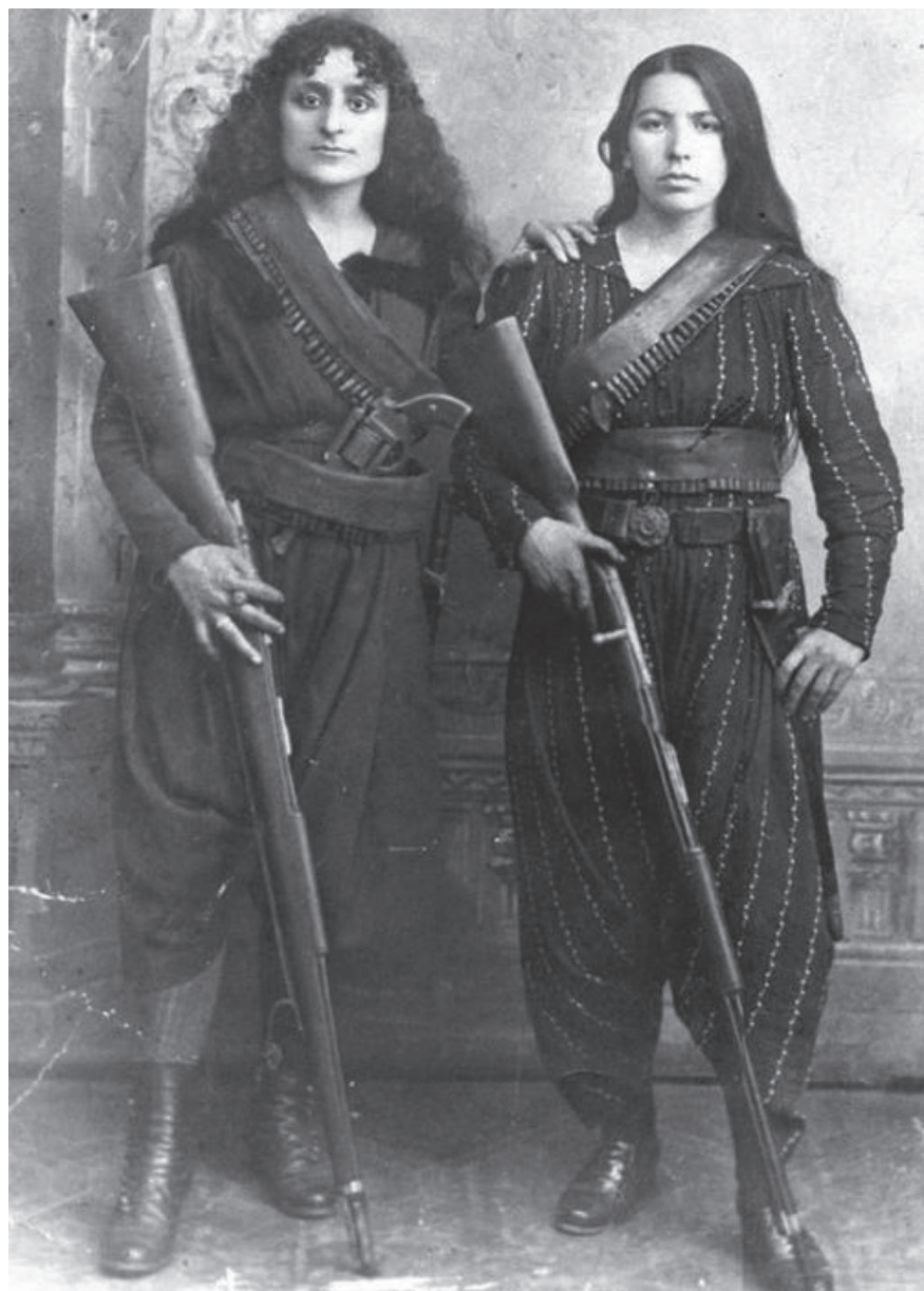
ՀԱՅ ՀԵՐՈՍՈՒԿԻ ԿԱՆԱՅՔ (1985)