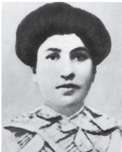
ԽԱՍԸՄ ՔԵԹԵՆՃՅԱՆ ?-1915