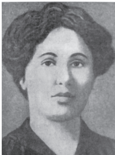
ԶԱՊԵԼ ԵՍԱՅԱՆ 1878-1943