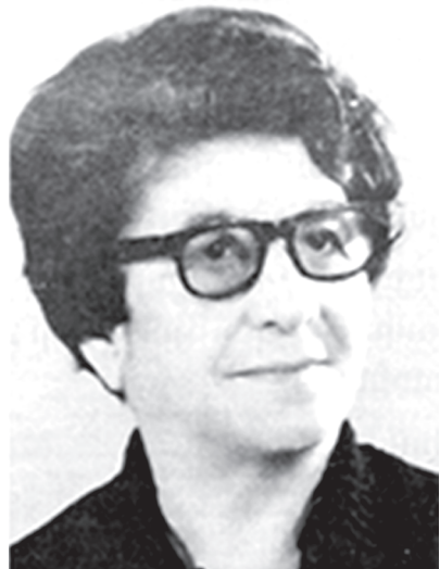
ՀՈՒՓՍԻՄԵ ՄԵՇԱՏՈՒՐՅԱՆ (ԼՈՒԱ ԱՍՍՈՒՆԻ) Հասարակական գործիչ, ազգային- ազատագրական պայքարի մասնակից