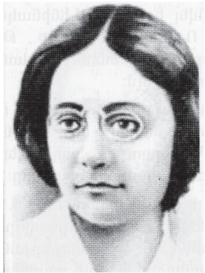
ԼՈՒՍԻԿ ՀԱՐՈՒԹՅՈՒՆԻ ԼԻՍԻՆՅԱՆ (ԼՅՈՒՍՅԱ ԱՐՏԵՄԻ ԼԻՍԻՆՈՎԱ) Հեղափոխական գործիչ