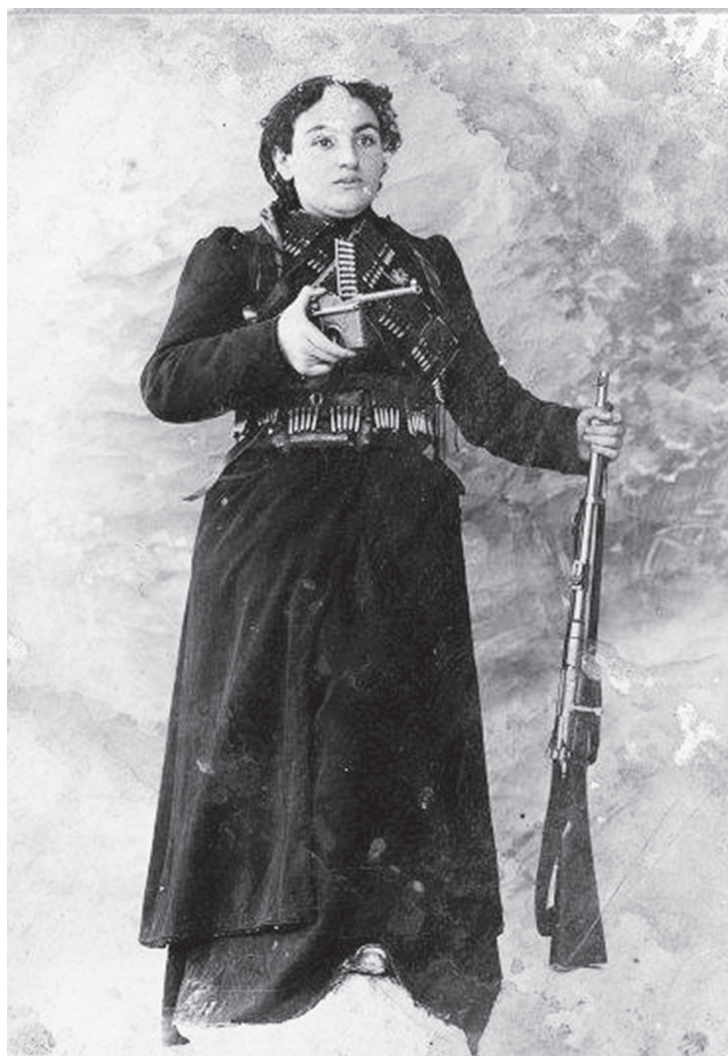
ԳԵՎՈՐԳ ՉԱՌԻՇԻ ԿԻՆԸ՝ ԵՂՍՈՆ