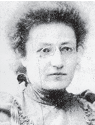
ԾԱՂԻԿ (ՍԱԹԵՆԻԿ ՄԱՏԻՆՅԱՆ - ԱՐԴՈՒԻԹՅԱՆ) 1874-1930