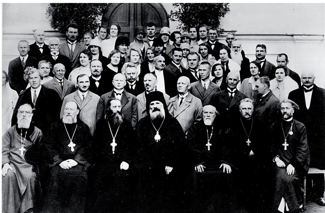
50-й юбилей латышского Вознесенского прихода (1929 г. Рига).