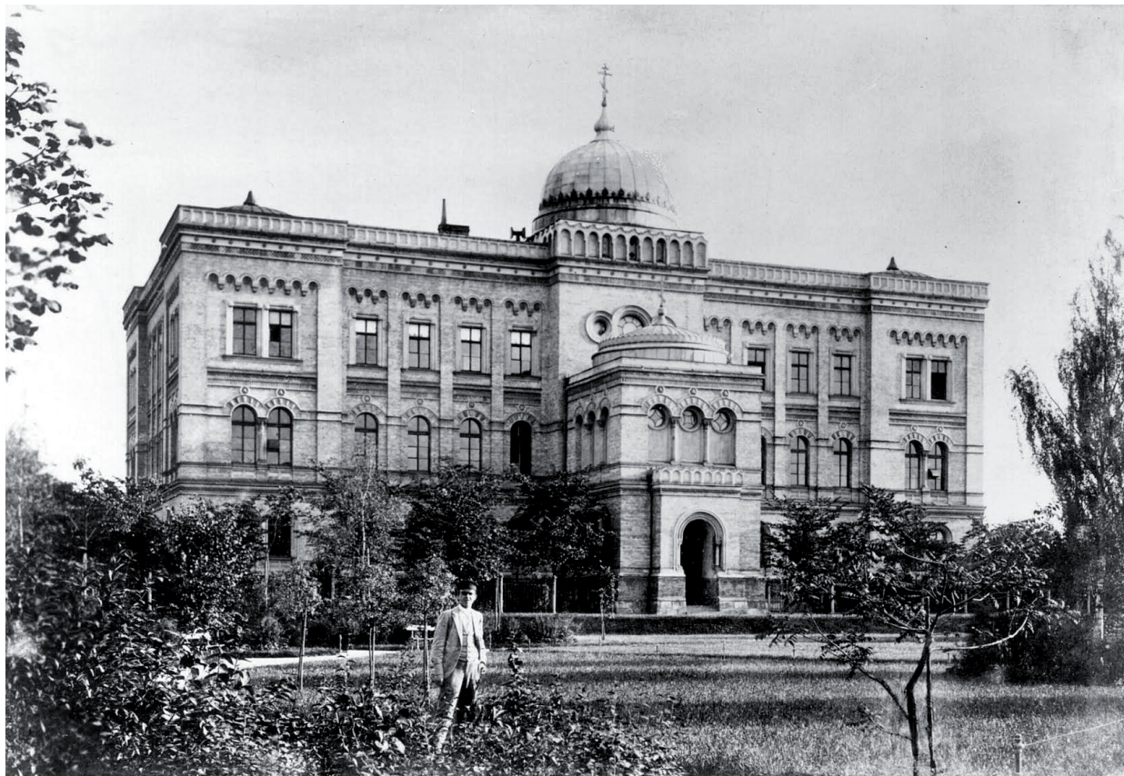
Рижская духовная семинария