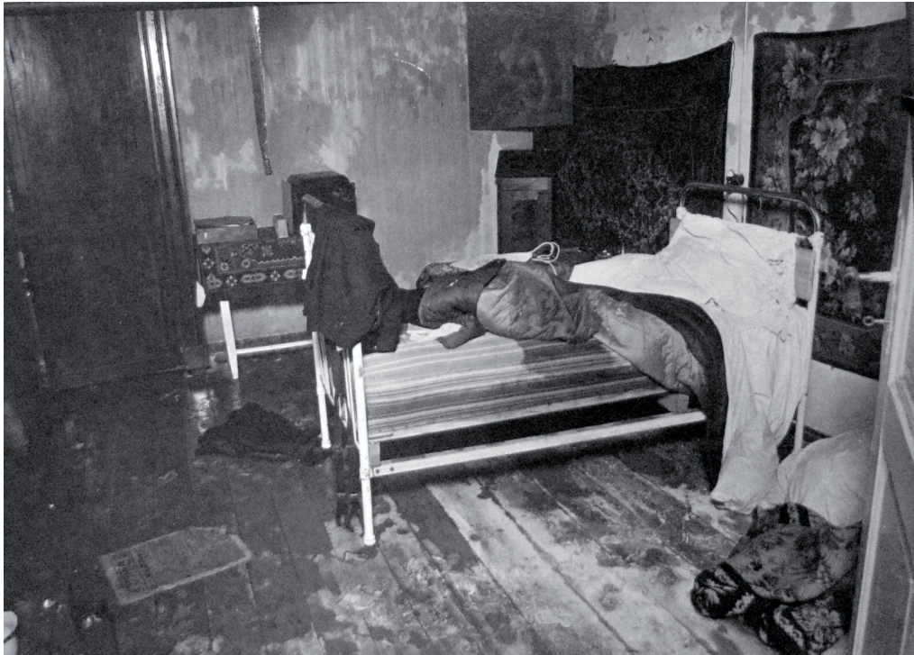
Комната архиепископа Иоанна (Поммера) после преступления. Такой ее увидели многочисленные посетители архиерейской дачи утром 12 октября 1934 года.