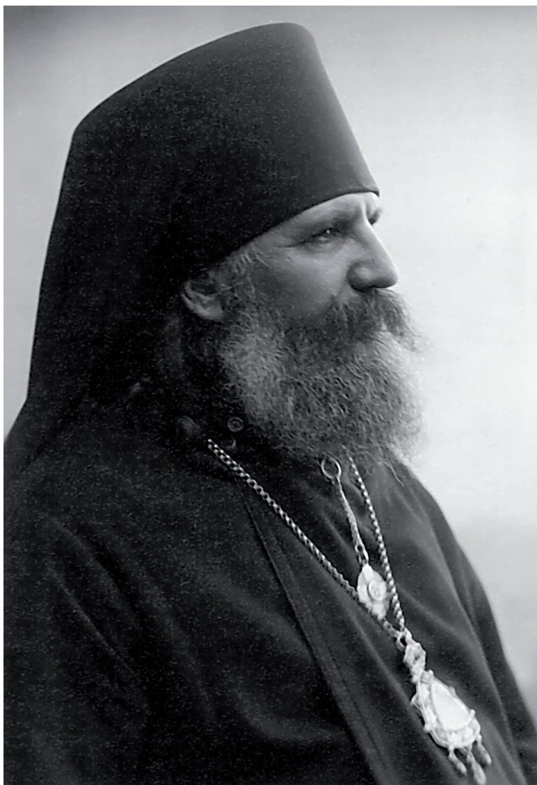
Архиепископ Иоанн (Поммер)