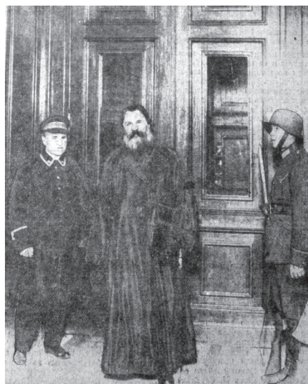
Архиепископ Иоанн на открытии сессии Сейма (1927).