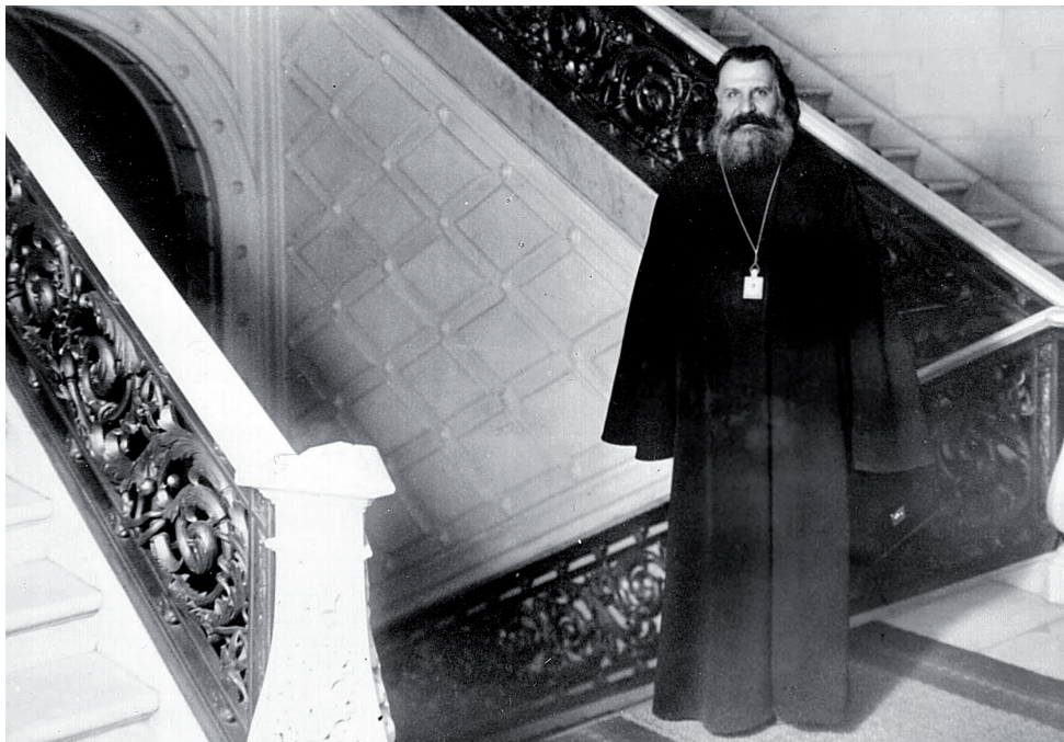
Архиепископ Рижский Иоанн (Поммер) в Сейме.