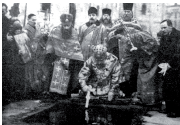
Арх. Иоанн совершает чин водоосвящения на Двине. 1928 год.