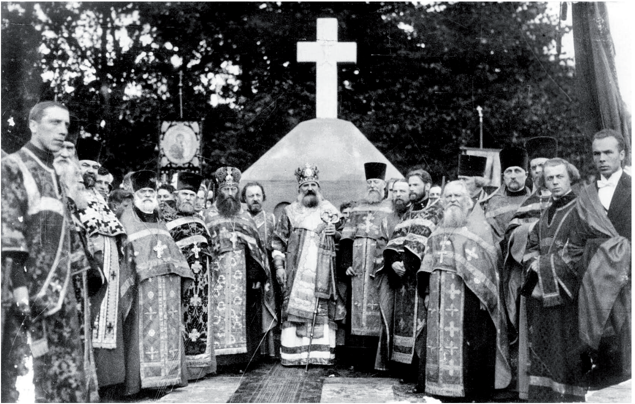
Архиепископ Рижский Иоанн (Поммер) с рижским духовенством после освящения памятника воинам Первой мировой войны.