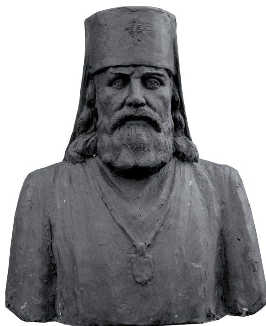
Проект бюста архиепископу Иоанну (Поммеру).