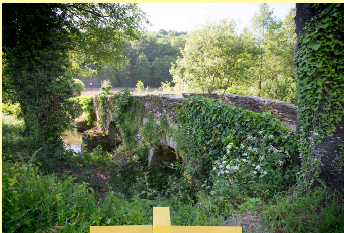
Ponte da Áspera