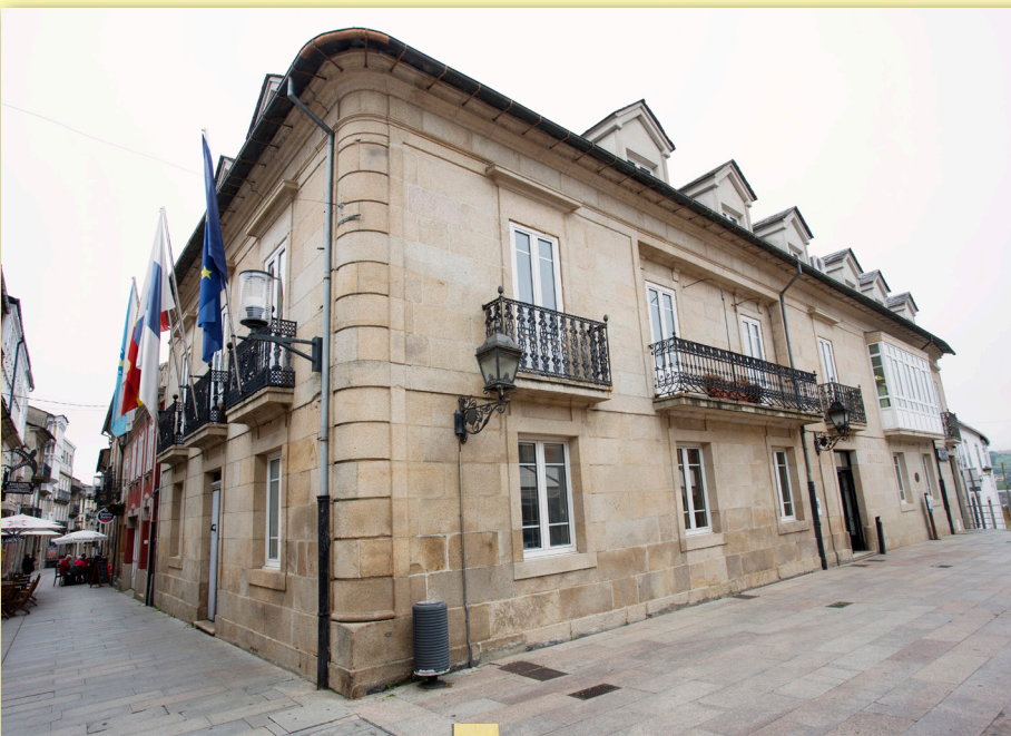
Casa do Concello