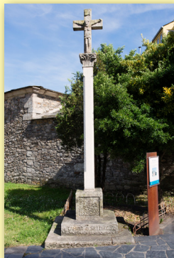
Cruceiro Capela de San Lázaro

Único resto del antiguo hospital de San Lázaro, que estuvo destinado a la atención de leprosos hasta el año 1700. A su lado hay un cruceiro de Manuel Mallo. Es una pequeña capilla con porche ( s. XVIII ), inmediata a la Rúa do Porvir ("Rúa dos Anticuarios"). En esa calle se pueden visitar varias tiendas de anticuarios, con una variada y rica oferta.