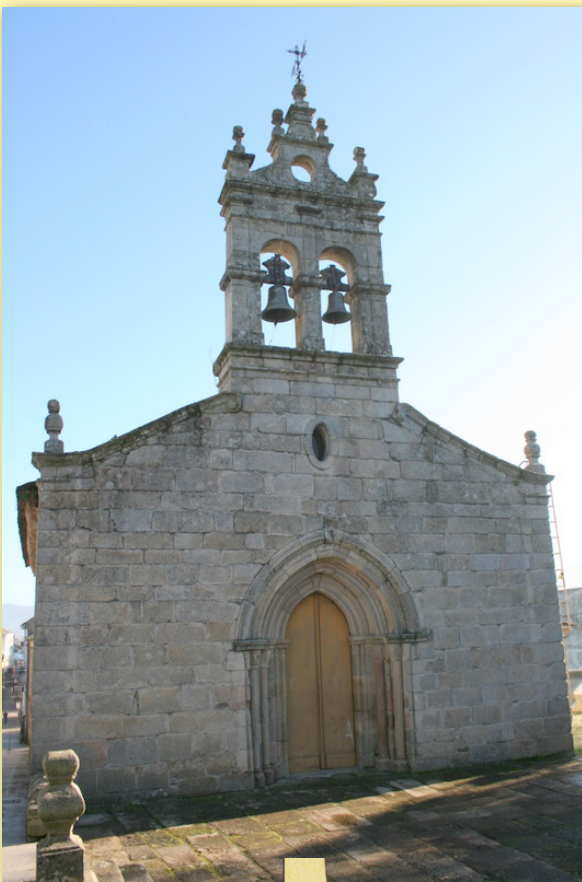
Igrexa de San Salvador