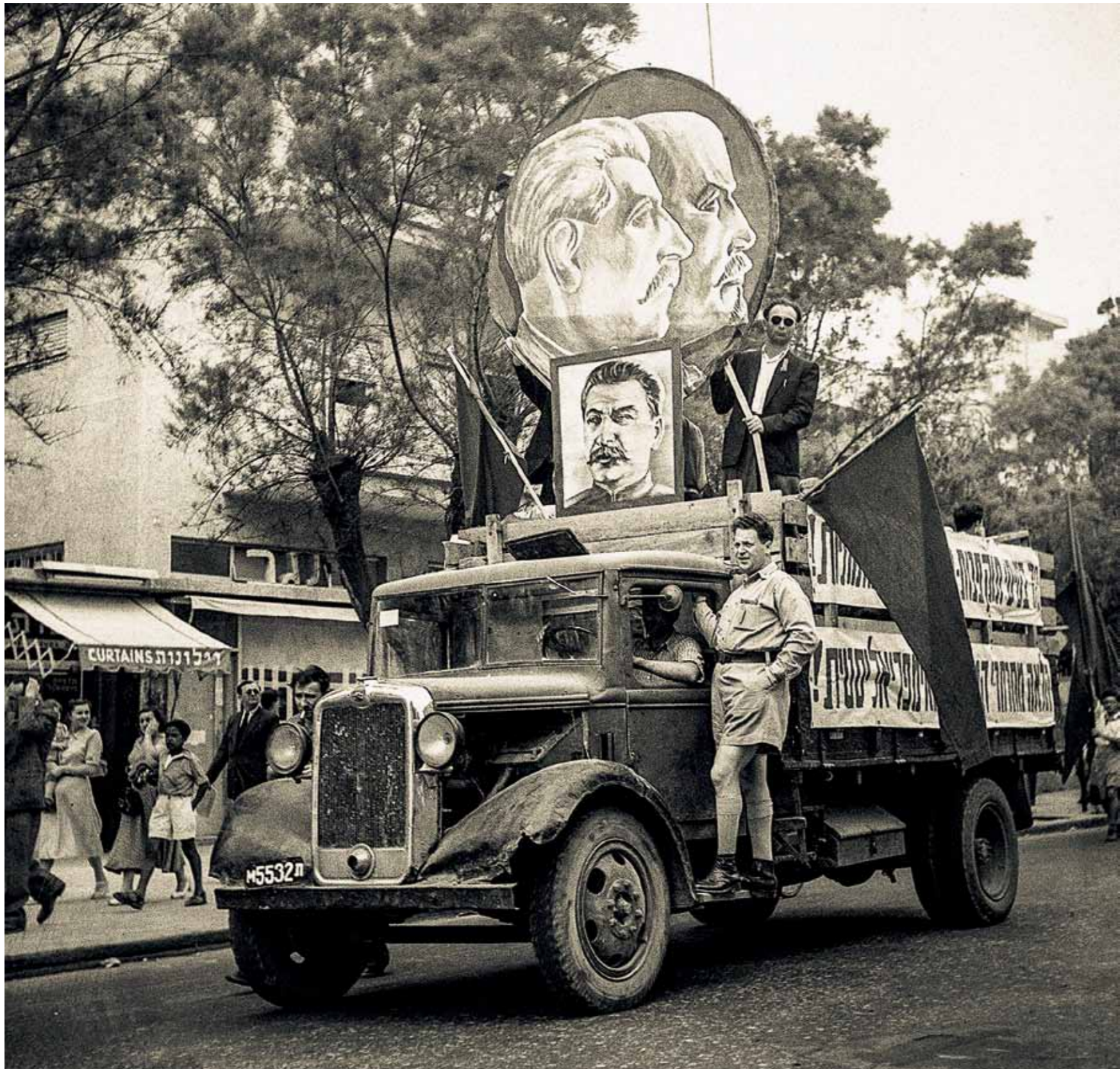
Вплоть до XX съезда израильский Первый визуально не отличался от советского. Те же лозунги, тот же генералиссимус, который глядел на Тель-Авив с мудрым прищуром. В колоннах шли как просоветские члены партии МАПАМ, так и скептически относившиеся к СССР, но при этом пламенно любившие социализм члены правящей партии МАПАЙ. Со временем идеалы пролетарского праздника подзабылись. В 90-е с красными флагами в Израиле маршировали абсолютные фрирки, к ужасу новых граждан, лишь недавно репатриировавшихся из экс-СССР. Сегодня же первомайские демонстрации превращаются в модное для представителей левых движений мероприятие. Всё новое — хорошо забытое старое. Разве что Сталина на транспарантах нет. Пока.

ПО ВОПРОСАМ РЕКЛАМЫ В ЖУРНАЛЕ «МОСКВА-ЕРУШАЛАИМ» ЗВОНИТЕ: +7 (926) 934 89 41