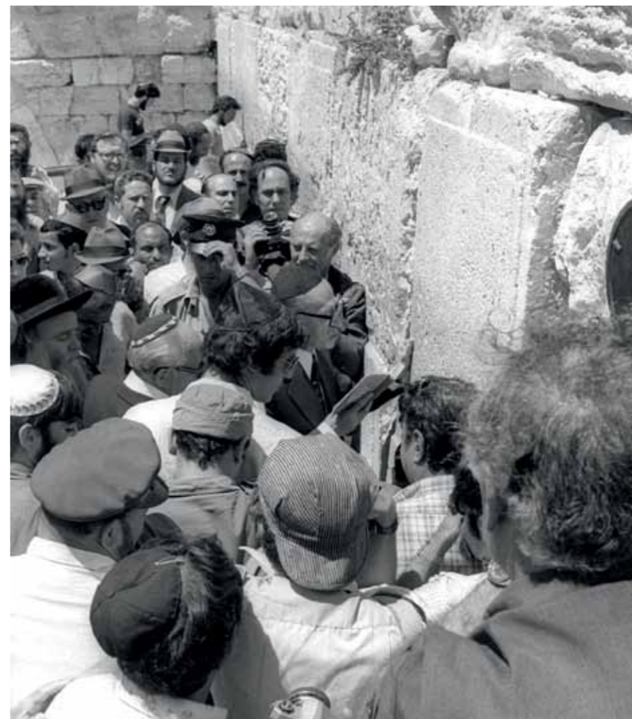
После победы на выборах Менахем Бегин сразу же поехал к Стене Плача, чтобы принести молитву

Спор между Бегин и Бен-Гурион не сводился лишь к перепалкам и взаимным оскорблениями. Это была содержательная дискуссия двух евреев о том, что такое еврейство, каким должно быть еврейское государство и его