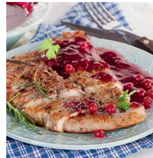
Куриные грудки в средиземноморском соусе