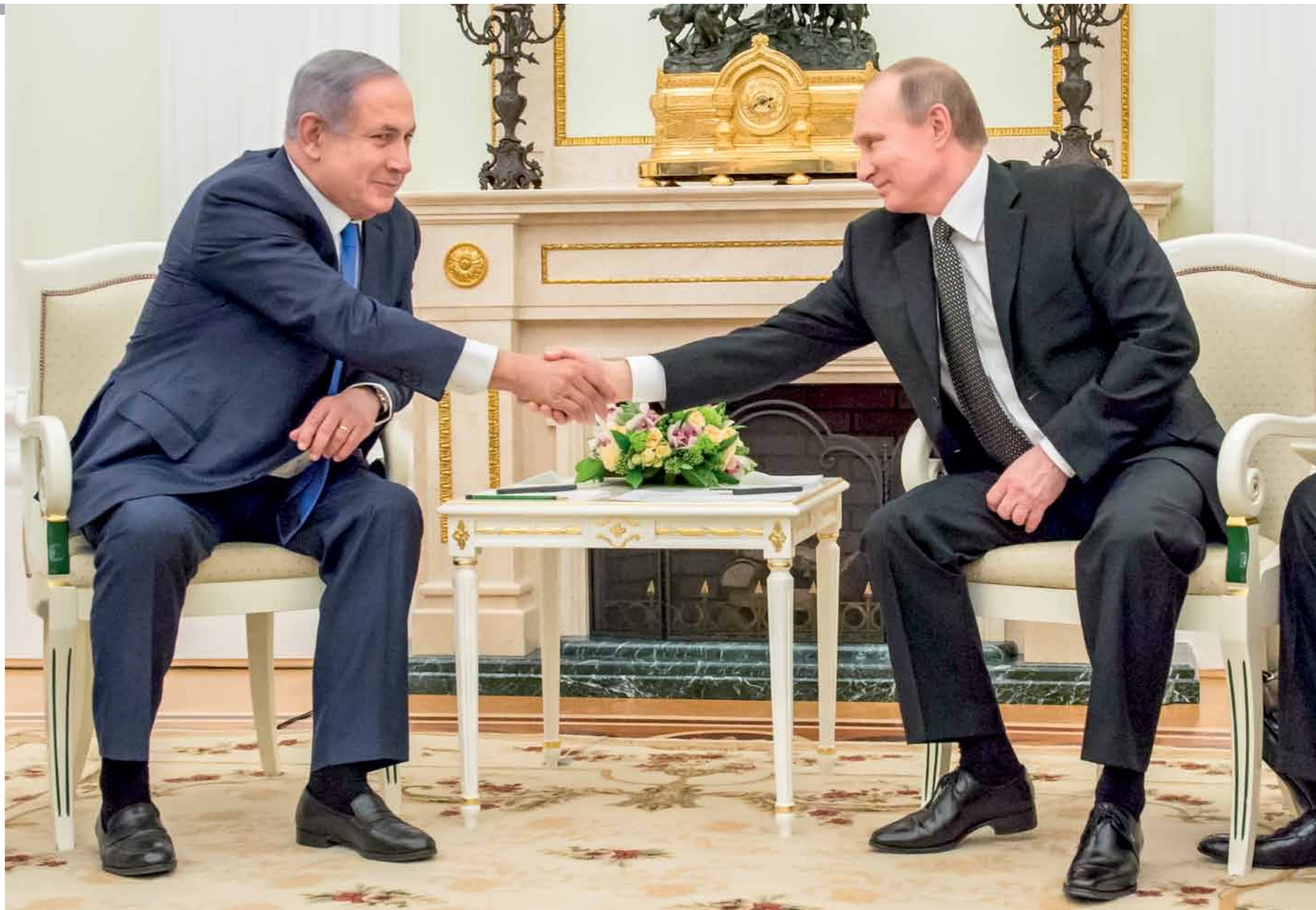
Путин, Нетаньяху, Голаны. Европейская общественность против, российский президент — за?

Визит израильской делегации в Москву показал, что за четверть века после возобновления дипломатических отношений между двумя странами обе стороны поняли: у них есть немало общего. С учетом антиизраильской позиции, которую занимают многие европейские страны, а также самоустранением США от происходящего в ближневосточном регионе, диалог России и Израиля крайне важен и пойдет на пользу всем. ●