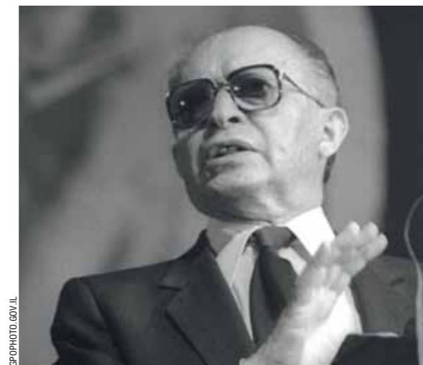
Договор о репарациях Бегин считал предательством

Уйдя в отставку во второй раз, Бен-Гурион был вынужден сдержанно переоценить роль Бегина в истории Израиля. Сподвижни-