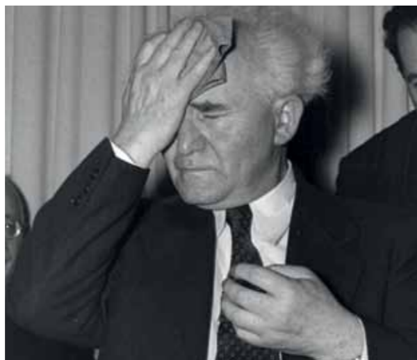
С галахическим определением еврея Бен-Гурион был не согласен

Это противостояние наиболее ярко проявилось в вопросе о репарациях. Репарации — это компенсация за лишения во время холокоста, которые правительство Германии намеревалось выплатить евреям. При этом, по замыслу немцев, коллективным представителем еврейского