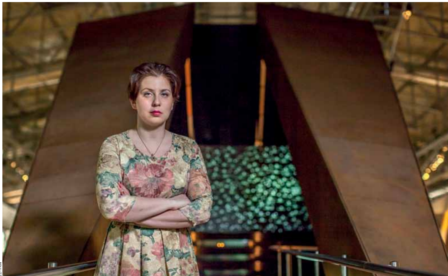
2100 имен за 4 года

— За это время мы собрали порядка 2100 имен; много архивных документов; дополнили данные анкет Яд ва-Шем, которые до нас подавали другие люди. Помогли фонду «Холокост» в издании книги, посвященной фронтовым письмам. Объяснили многим евреям, которые интересуются историей своей семьи, как найти биографические сведения о погибших родственниках. Мы продолжаем набирать волонтеров и людей, которые располагают информацией о жертвах