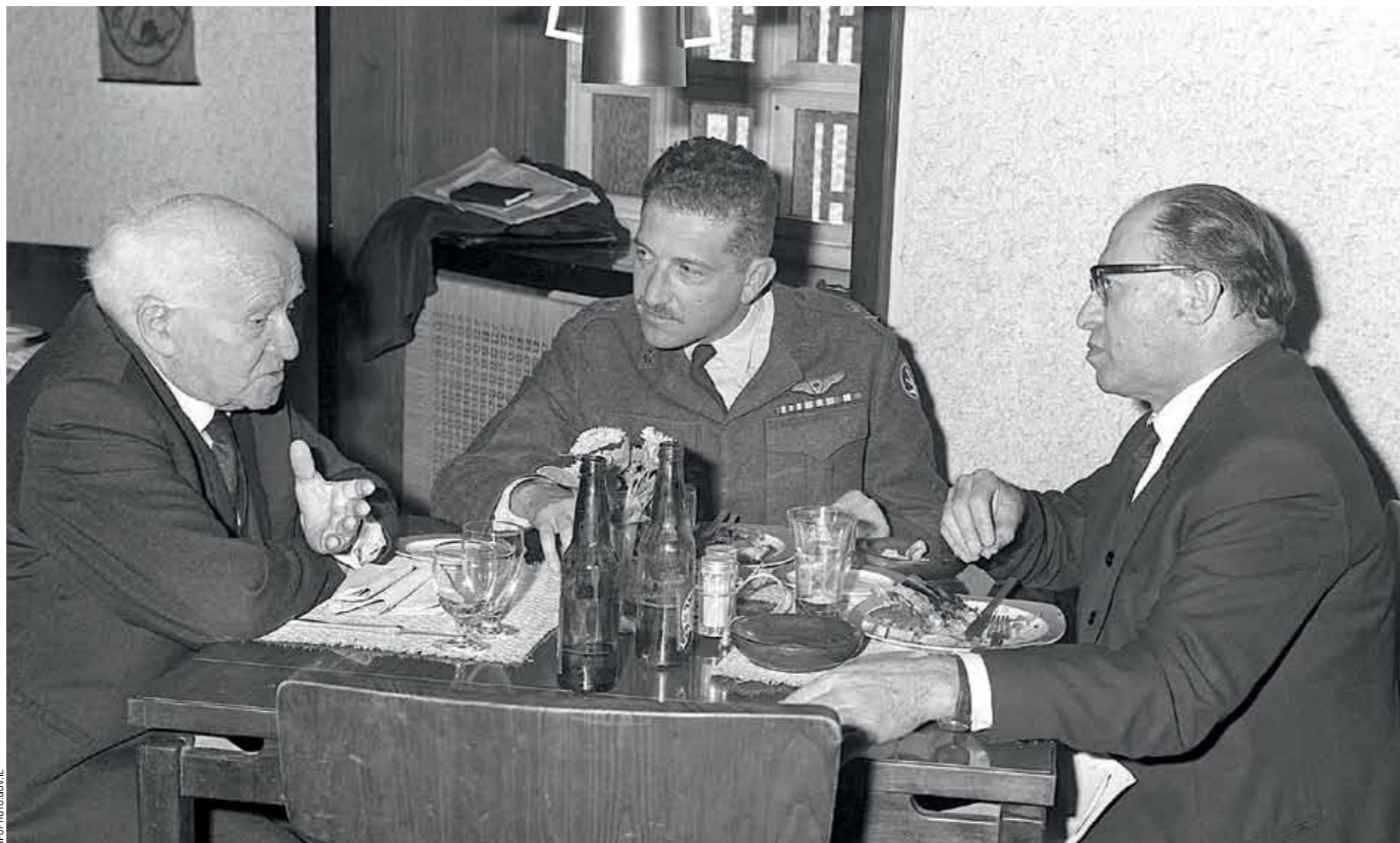
Бен-Гурион, Вейцман и Бегин. Прагматизм против эмоций

В 1953 году Давид Бен-Гурион ушел с поста главы государства и построил дом в кибуце Сде-Бокер. Бен-Гурион вернулся к руководству страной, но остался верен Сде-Бокер и Негеву. Там он закончил свои дни после окончательного ухода из политики. Дом Бен-Гуриона в кибуце Сде-Бокер прост и скромно. Это отражает его мировоззрение — любовь к родине, земле, заселение и расцвет пустыни, физическая работа, скромная жизнь. Сегодня дом Бен-Гуриона используется в качестве туристической достопримечательности. Его посещают учащиеся, молодежь и семьи для получения сионистского образования в духе Давида Бен-Гуриона. Дом сохранился в том виде, в каком он был при жизни четы Бен-Гурионов. Бывший глава правительства поднимался рано утром и работал в загоне для овец. После смерти в возрасте 87 лет, Давид Бен-Гурион был похоронен рядом со своей женой Полей в Негеве, недалеко от Мидрешет Бен-Гурион.