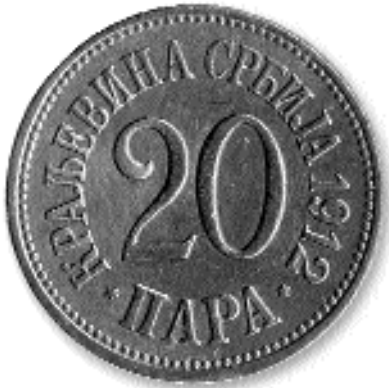
20 ПАРА, никл, 1912. каш. бр. 31

„ДИНАРА” (лево) и „DINARA” (десно). У доњим угловима је државни грб. Испод цртежа, у левом углу, име аутора “М. Сl. Стчић Fec”.