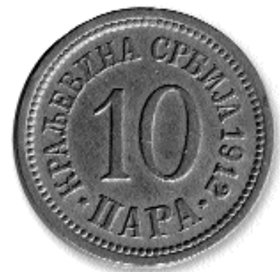
10 ПАРА, никл, 1912. кат. бр. 30