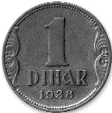
1 ДИНАР, бакар, 1938. каџ. бр. 67

сној руци има срп. Десно и лево од ње - по пет жена жетелица. У позадини - пожњевено поље са сноповима жита и стоговима сена. Лево је уоквирени водотиск са ликом краља Александра I. Текст на наличју исти је као на лицу, само писан латиницом. Ознака номиналне вредности налази се изнад и испод цртежа. Испод цртежа латиницом су писана имена аутора и гравера. У оптицају је од 1. јануара 1937. Повучена је од 1. до 10. јануара 1941. године (Ј. Хаџи-Пешић, 1995, 140).