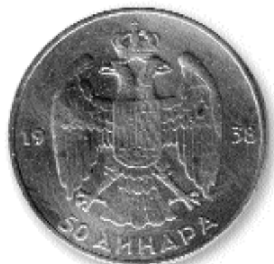
50 ДИНАРА, сребро, 1938. каџ. бр. 71