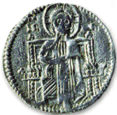
ДИНАР, сребро, Краљ Стефан Урош II Милутин (1282-1321)

10 ДИНАРА, папир, 02.02.1893. каџ. бр. 20