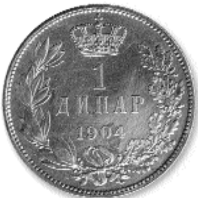
1 ДИНАР, сребро, 1904. каш. бр. 26

осећала се потреба за новим количинама ситног кованог новца. Новац је кован у Паризу 1915. године. Исковано је 7.901.068 комада од 50 пара (2,5 г, 18 мм), 7.529.016 комада од 1 динара (5г, 23 мм) и 2.602.580 комада од 2 динара, (10 г, 27 мм), (И. Вучићевић, С. Новаковић, 1985, 96). По другом извору исковано је 7.000.000 комада од 50 пара, 6.500.000 комада од 1 динара и 2.500.000 комада од 2 динара (Ј. Хаџи-Пешић, 1995, 223). И даље се осећао недостатак ситног новца. Зато је донета одлука о ковању нове серије. Одлучено је да ова емисија сребрника буде иста као и претходна по техничким особинама и изгледу, али да се уклони име гравера. Кованице носе 1915. годину као годину ковања, али ковање је завршено тек 1917. године. Исковано је 1.862.072 комада од 50 пара, 2.312.304 комада од 1 динара и 825.858 од 2 динара.