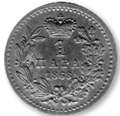
1 ПАРА, бакар, 1868. кай. бр. 1