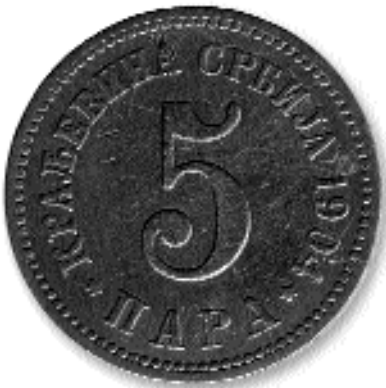
5 ПАРА, бакар, 1904. каш. бр. 24

наслоњена на њега, стоји сељанка, која у левој руци држи струкове кукуруза с родом, а у десној букет цвећа. Десно од штита, виноградар бере грожђе, а у другом плану види се манастир Студеница. Горе, с леве стране, над водотиском, који је овде на левој страни, стоји текст на француском језику: BANQUE NATIONALE DE SERBIE / PRIVILÉGIÉE / DU ROYAUME; изнад представе виноградача такође текст на француском језику: CENT FRANCS / PAYABLES EN ARGENT À PRÉSENTATION.