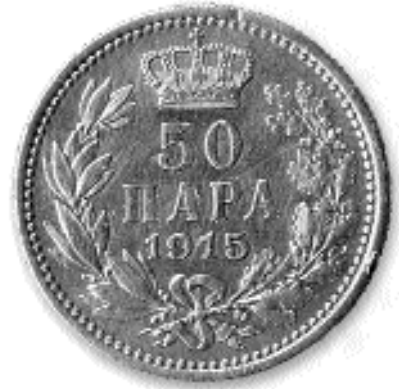
50 ПАРА, сребро, 1915. кат. бр. 35