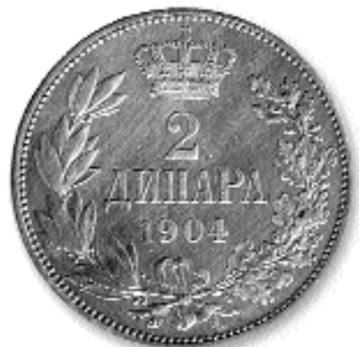
2 ДИНАР, сребро, 1904. кат. бр. 27