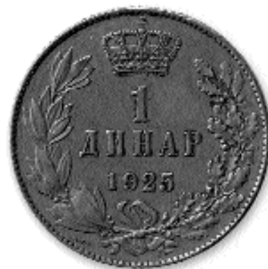
1 ДИНАР, никл и бакар, 1925. кат. бр. 52