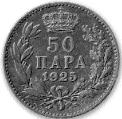
50 ПАРА, никл и бакар, 1925. каш. бр. 51

виси од извора података. Новац је периодично пуштан у оптицај од 5. септембра 1925. Њиме је замењен државни папирни новац од 1, 1/2 и 1/4 динара. Сукцесивно је повучен из оптицаја од 31. јула 1937. до 1940. године (Ј. Хаџи-Пешић, 1995, 96-97).