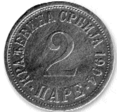
2 ПАРЕ, бакар, 1904. кай. бр. 23