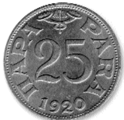
25 ПАРА, никл и бакар, 1920. каџ. бр. 50