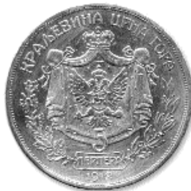
5 ПЕРПЕРА, сребро, 1912. кат. бр. 80