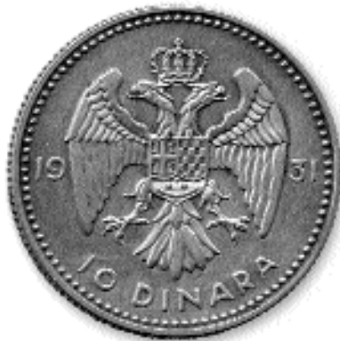
10 ДИНАРА, сребро, 1931. каш. бр. 57

жи срп и сноп жита, а десна мач и штит са државним грбом. У средини је исти текст као на лицу новчанице, исписан латиницом. Испод, у посебном оквиру, налази се текст клаузуле о фалсификату. У доњем углу лево и горњем десно је бројчана вредност новчанице - „1000”. Испод цртежа су имена аутора и гравера. Пуштена је у оптицај 1. јануара 1933, а повучена у периоду од 4. до 11. јуна 1941. године.