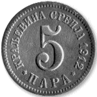
5 ПАРА, никл, 1912. каш. бр. 29