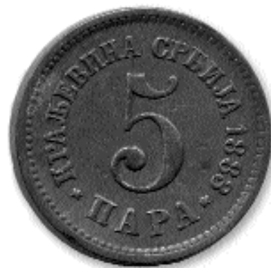
5 ПАРА, никл, 1883. кат. бр. 13