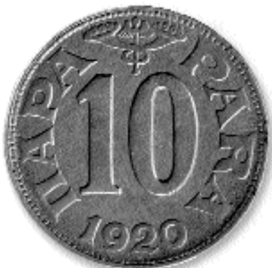
10 ПАРА, цинк, 1920. каш. бр. 49