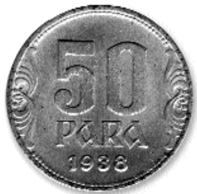
50 ПАРА, бакар, 1938. кат. бр. 66