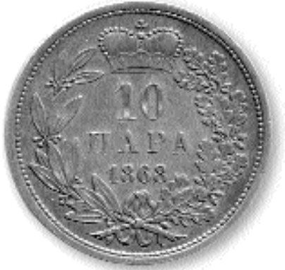
10 ПАРА, бакар, 1868 кат. бр. 3

шка на једној за апоен од 1 пара где уместо слова „Б” стоји слово „Ђ” у речи „СРПСКИ”. Испод лика кнеза Михаила налази се сигнатура гравера, и то: „А.С.”, „А. SCHARF” за апоен од 1 и 10 пара и „LEISSEK” за апоен од 5 пара. Све заједно у „бисерном” кругу.