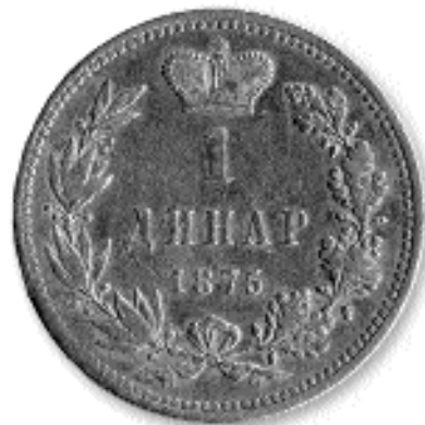
1 ДИНАР, сребро, 1875. кай. бр. 5