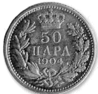
50 ПАРА, сребро, 1904. кат. бр. 25