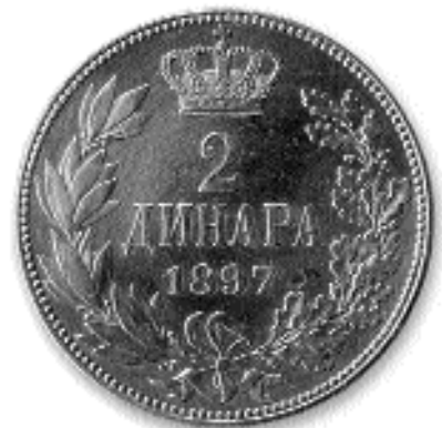
2 ДИНАРА, сребро, 1897. кат. бр. 22