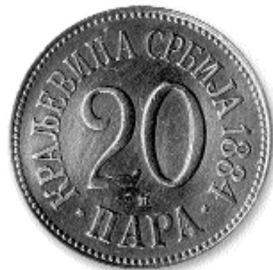
20 ПАРА, никл, 1884. кат. бр. 18