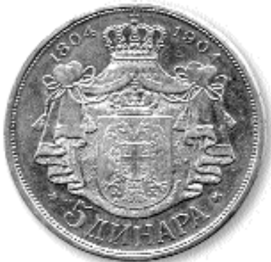
5 ДИНАРА, сребро, 1904. каш. бр. 28

платива у злату штампана је и нумерисана у Француској (Banque de France). Рађена је на основу цртежа нама непознатих српских уметника (Ј. Хаџи-Пешић, 1995, 177-178). Банкнота од 20 динара у злату штампана је на белој хартији, величине 157 x 95 мм. Новчаница поседује водотиск с десне стране при дну, који представља женску главу овенчану лаворовим венцем. Лице новчанице штампано је плавом бојом и загаситоцрвенском бојом. На левој страни, између два архитектонска стуба, стоји женска фигура, персонификација Србије. Фигура је огрнута краљевским плаштом; у десној руци држи штит на коме се види грб Краљевине Србије, а у левој-мач; на глави има лаворов венац. Код ногу јој седи дечак и пише књигу, коју је наслонио на десно колено. На десној страни, између два архитектонска стуба, стоји младић, персонификација генија слободе, који у десној руци држи буктињу, а десну ногу положио је змији на главу. Он се ослања на круг са водотиском, који је заогрнут плаштом, више кога су положени круна и мач.