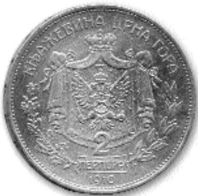
2 ПЕРПЕРА, сребро, 1910. каш. бр. 79

не 743.536 комада - укупно 4.000.536 комада од 1 динара (тежина 5 грама, пречник 23 мм). Затим 1897. године исковано је 500.000 комада и 1898. године 500.000 комада - укупно 1.000.000 комада од 2 динара (10 г, 27 мм); укупне номиналне вредности од 5.000.536 динара. (И. Вучићевић, С. Новаковић, 1985, 95). Новац је пуштен у промет 15.октобра 1897. године (у оптицају до 1931. године).