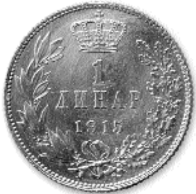
1 ДИНАР, сребро, 1915. каш. бр. 36

РА”, а са десне „РАРА”. Изнад цифре су два укрштена рога изобиља и Меркуров штап, а испод је године ковања „1920”. Све заједно у „бисерном” кругу. Реверс је у односу на аверс постављен под 0°. Обод код комада од 5 и 10 пара је гладак, а код 25 пара нарецкан. Непозната је тачна количина искованог новца. Отковано је 3.825.514 комада од 5 пара (тежина 2,65 гр, пречник 18,8 мм, гама-метал), 58.946.122 комада од 10 пара (тежина 1,15 г; пречник 20,85 мм, гама-метал) и 48.173.138 комада од 25 пара (тежина 5,70 г, пречник 25 мм, легура бакра и никла), (И. Вучићевић, С. Новаковић, 1985, 99). Пуштен је у оптицај постепено 1920. године, а повучен је у периоду од 26.јануара 1932. године до 1940. године.