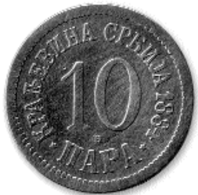
10 ПАРА, никл, 1884. кай. бр. 17