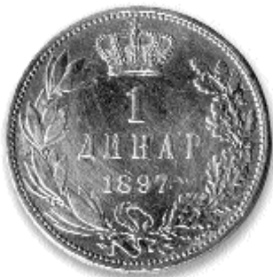
1 ДИНАР, сребро, 1897. кай. бр. 21

прегнирана. Боја цртежа је „берлинско” плава. Цртеж за новчаницу израдио је сликар Ђорђе Крстић (1851-1907). Гравер је био L. Dumont из Париза.