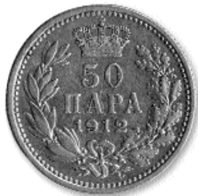
50 ПАРА, никл, 1912. кат. бр. 32