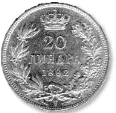
20 ДИНАР, злато, 1882. каш. бр. 12

риличним натписом „МИЛАН М. ОБРЕНОВИЋ IV КЊАЗ СРПСКИ”. Све заједно у „бисерном” кругу.