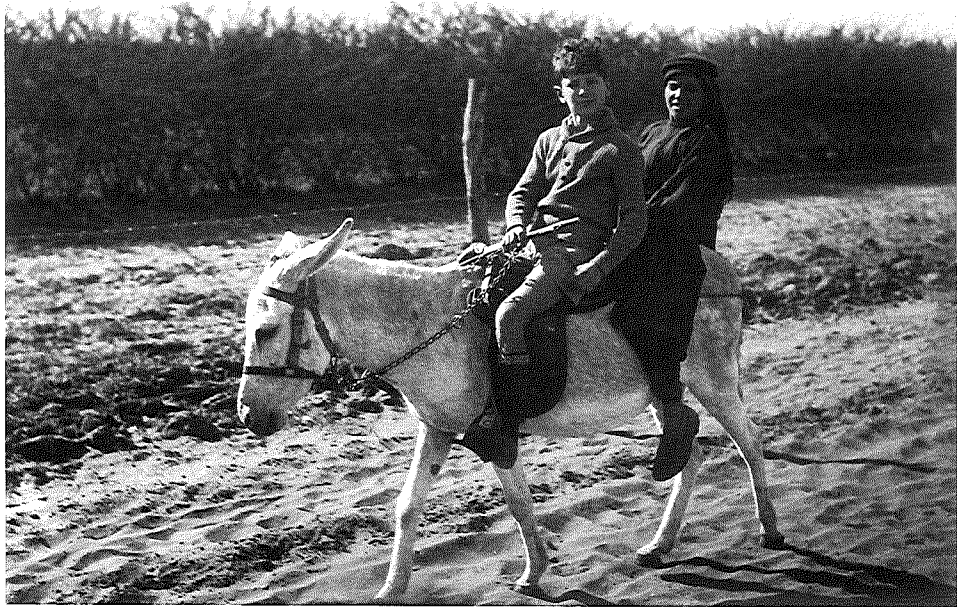
נער ערבי ונער יהודי בשרון, 1934

ייבוש הביצות אפשר החל מאמצע שנות העשרים את הכשרתן של קרקעות נוספות לעיבוד חקלאי וכן את הרחבתן ואת הגידול במספר תושביהן של המושבות חדרה, כרכור, גבעת-עדה, בנימינה ופרדס-חנה, וכך הוחל בפיתוח נרחב של ענף ההדרים באזור זה. פעולות הפיתוח הביאו לאזור הזדמנויות תעסוקה חדשות, ואלה משכו מהגרים ערבים מחוצה לו. בהיעדר פועלים מיומנים בענף הבנייה הועסקו פועלים זרים מהמדינות השכנות בבניית המושבות היהודיות, כמו הפועלים