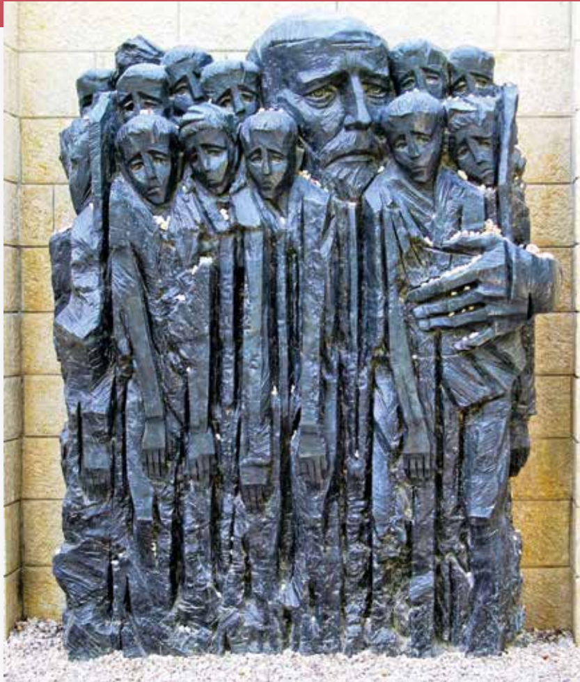
“בלא זעזועים לעשות מה שניתן” – אחרטת יאנוש קורצ'אק ותלמידיו, יד ושם