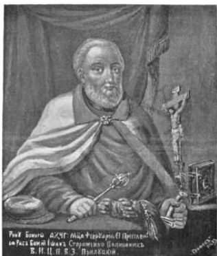
Іван Стороженко, полковник Прилуцький

Оселився Іван Стороженко біля села Іржавець Ічнянської сотні Прилуцького полку, заснувавши там хутір. В 1670 і в 1681-1687 рр. був сотником Ічнянським, а в серпні 1687 р. гетьман Іван Мазепа призначив його полковником Прилуцьким.