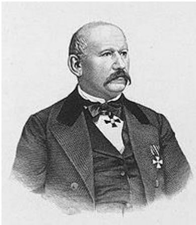
Олекса Петрович Стороженко

Ім'я Олекси Петровича Стороженка з'явилося на українському літературному обрії під час національно-культурного пробудження на початку другої половини XIX століття, коли знову стало відроджуватись громадське і культурне життя українського народу. Наділений багатьма талантами, він був обдарованою творчою особистістю і створив свій