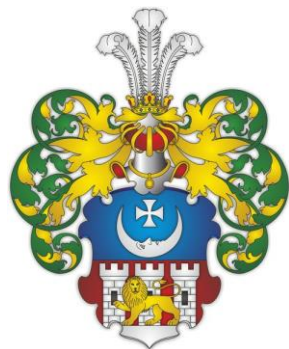
Родовий герб Стороженків

Батько письменника, Петро Данилович Стороженко , народився близько 1765 р. Був записаний у 1779 р. вахмістром у Софійський карабінерний полк. З 14-ти років служив регістратором у штабі графа П.О. Румянцева-Задунайського, в 1785 р. отримав чин поручика. Був у походах 1787 і 1788 р. в Польщу і в Молдавію при взятті Хотина. Служив також у Малоросійському гренадерському полку. В кінці 1796 р. був звільнений від служби в чині поручика через запізнення на чотири місяці в Софійський полк, проживав у Лисогорах.