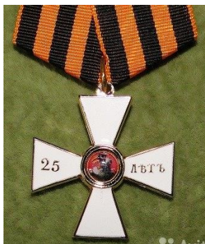
Орден Святого Георгія IV ст.

26 листопада 1855 р. О.Стороженко, вже перебуваючи на цивільній службі, отримав орден Св. Георгія IV ст. за 25 років бездоганної служби. В наказі про нагородження був відображений його подвійний статус – майор (надвірний радник). Цим орденом письменник дуже пишався, він завжди його носив на лацкані сюртука. Був О.Стороженко одним із останніх, хто отримав цей орден за вислугу років, оскільки згідно наказу від 15 травня 1855 р. за 25 років бездоганної служби стали нагороджувати орденом Св. Володимира 4-го ступеня з бантом.