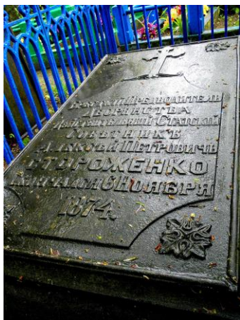
Плита на могилі О.П. Стороженка

Українці Бреста опікувалися й могилою письменника. У 1920-х роках могила просіла, в цегляному склепінні над труною утворився отвір. Стараннями української громади, на заклик інженера Івана Гноєвого, могила була впорядкована, а навколо плити поставили металеву огорожу.