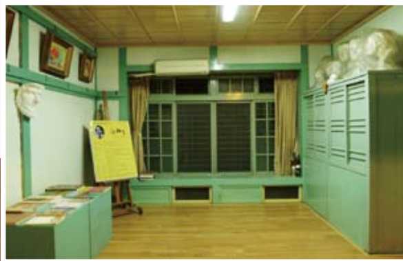
郭柏川故居外觀與內部 ▶

年，軍方房舍遭到拆除（如36號等），僅留下成大宿舍區，及散落在營區附近的少數幾座軍眷住宅。