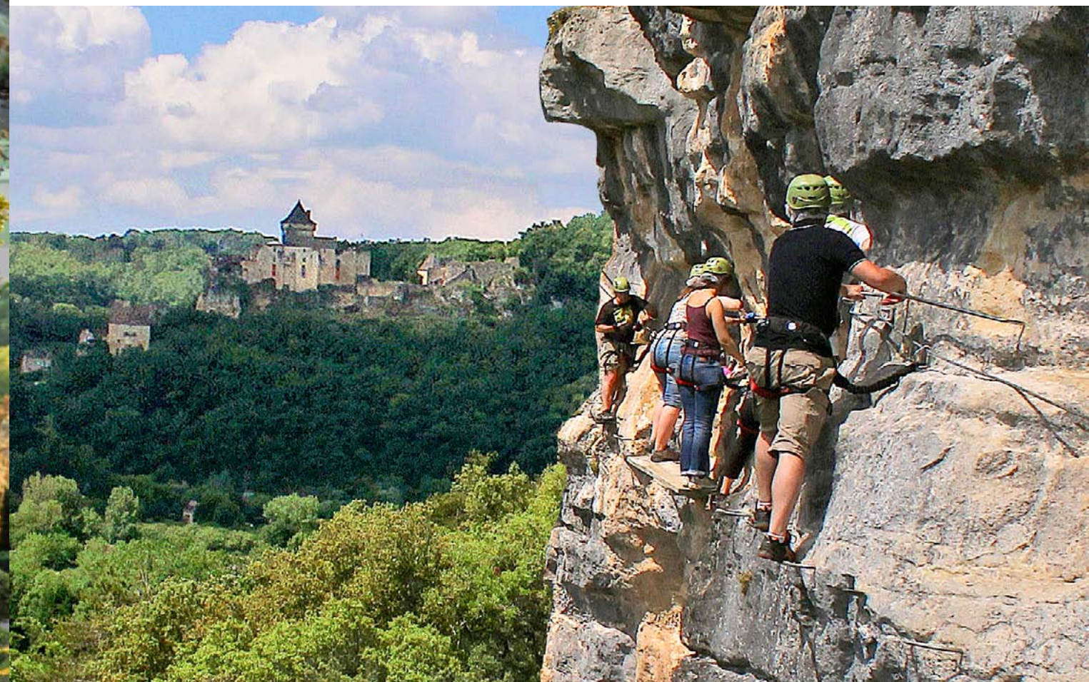
LA VIA FERRATA

Plébiscités par les inconditionnels des promenades calmes et contemplatives, les Jardins de Marqueyssac font aussi l'unanimité chez les inconditionnels de sensations fortes et de visites « à vivre autrement ».