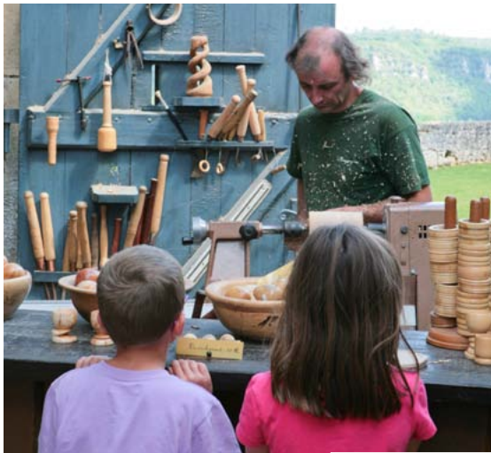
LE TOURNEUR SUR BUIS