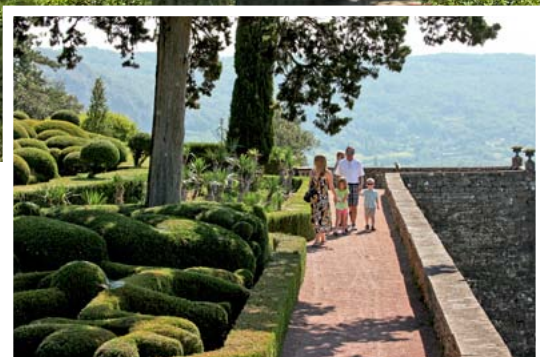
UNE ALLÉE DU BASTION