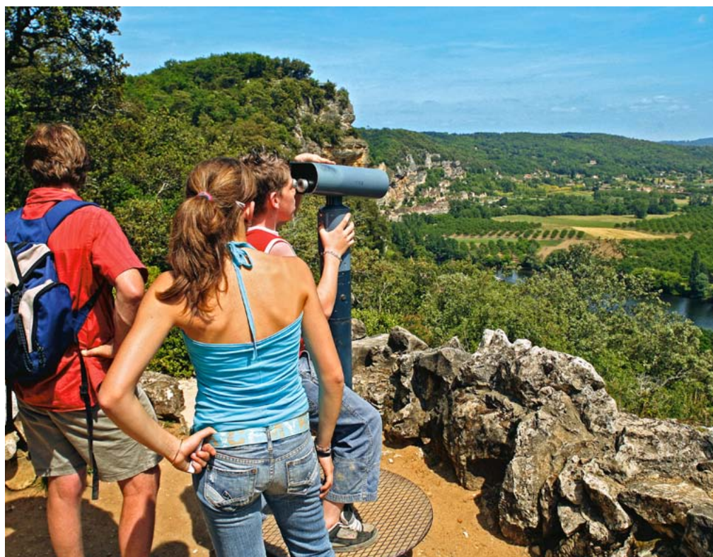
LA VUE PANORAMIQUE SUR VALLÉE DEPUIS LA CABANE EN CLOCHE

dépasser les 10 mètres de haut !), tous défilent les saisons en gardant leur feuillage toute l'année. Dans leur grande majorité, les buis de Marqueyssac ont été plantés durant la seconde moitié du XIX e siècle par Julien de Cerval et sont entièrement taillés à la main deux fois par an. Adaptés au sol de ce promontoire rocheux, les buis de Marqueyssac sont particulièrement mis en valeur sur le Bastion en une multitude de petites collines qui répondent aux reliefs naturels de la vallée, mais aussi au travers du « Chaos », une vision contemporaine et artistiquement déstructurée de l'art topiaire. Les Jardins de Marqueyssac sont d'ailleurs membre de l'European Boxwood and Topiary Society.