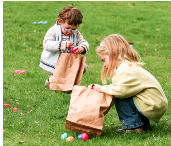
LA CHASSE AUX OEUFS

une seconde vie. Très prisé par les tourneurs comme les sculpteurs et les graveurs qui apprécient sa couleur d'or et son grain si fin qui lui confère un poli très doux, le buis de Marqueyssac se décline sous bien des aspects. Les objets tournés sous les yeux des visiteurs sont présentés et vendus dans la boutique des jardins.