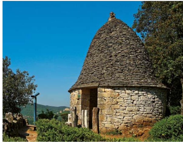
LA CABANE EN CLOCHE