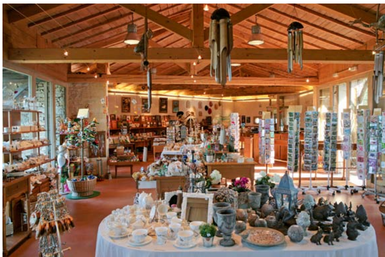
LA LIBRAIRIE BOUTIQUE