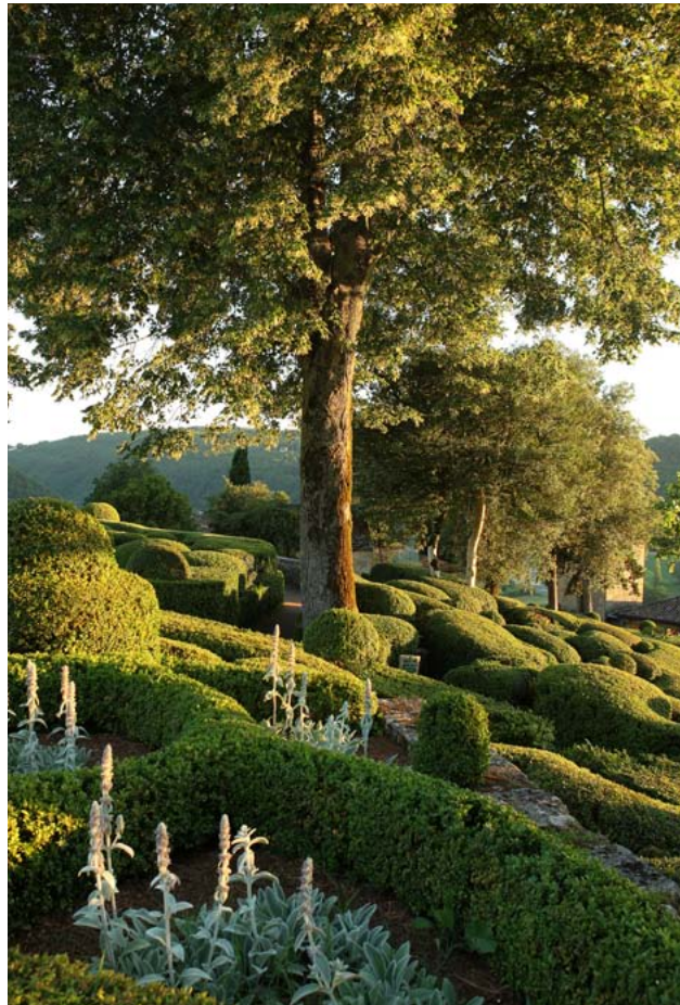
LE BASTION AU COUCHER DU SOLEIL