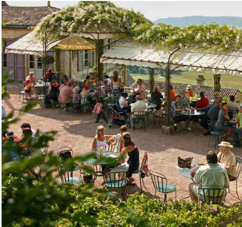
LA TERRASSE PANORAMIQUE DU RESTAURANT

Pour les amateurs d'ouvrages sur les arbres, les plantes, l'art des jardins et la nature - avec des étagères consacrées aux éditions pour les enfants - comme pour ceux qui aiment les livres sur les coutumes, les traditions et l'art de vivre de la région... Mais aussi pour ceux qui recherchent des objets de décoration qui sortent de l'ordinaire, dont une belle collection déco en buis... La boutique-librairie de Marqueyssac est un passage obligé !