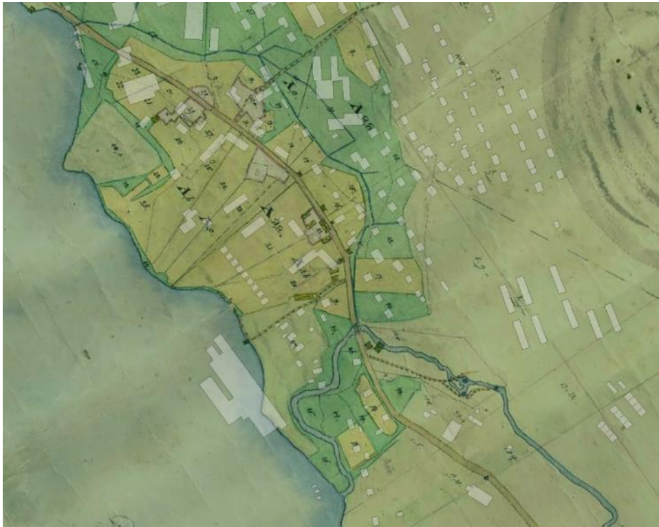
Figur 1 Bräcke by 1833, byn utgjordes då av ett fåtal gårdar efter vägen. Vid en jämförelse mellan bebyggelsen på kartan och dagens bebyggelse, tycks det endast vara södra flygeln vid "Edlings" som ev. finns kvar idag (23-BRJ-34).