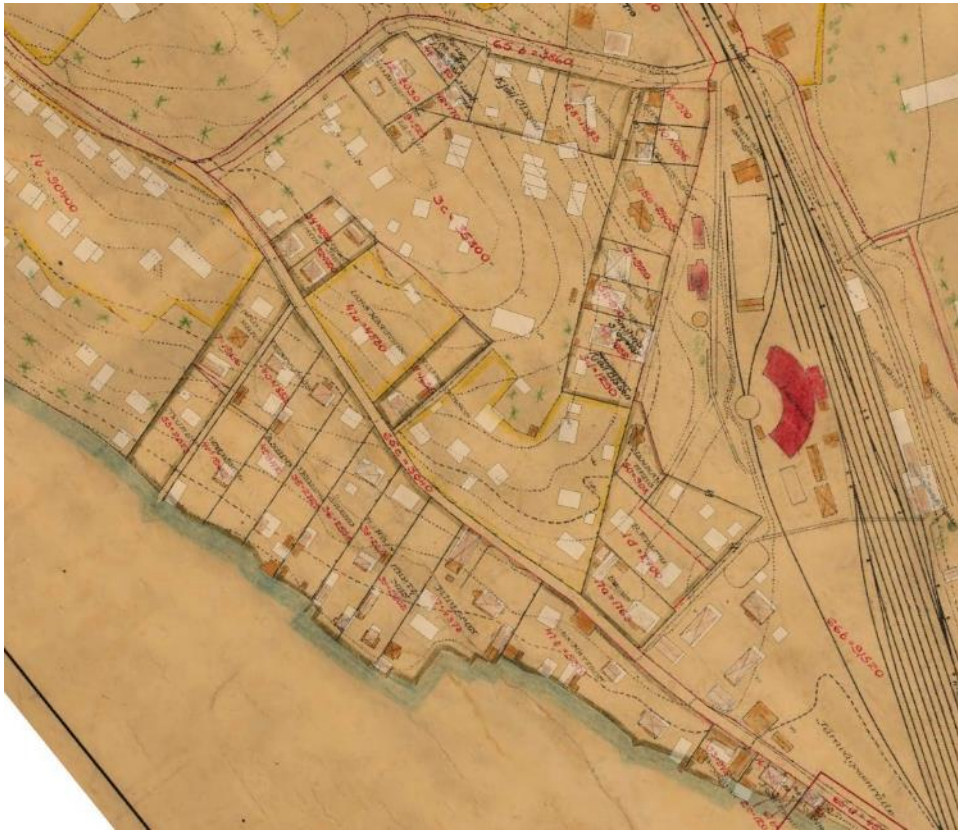
Figur 4 Bebyggelsen efter Västra Kungsvägen 1910 (23-BRB-4).