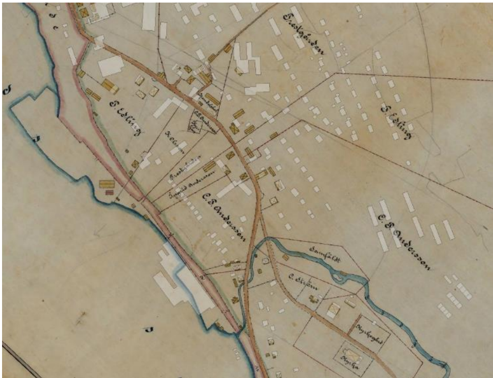
Figur 2 Bräcke by 1904, flera av dagens byggnader känns igen på kartan (23-BRB-1).