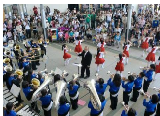
小学校金管バンド