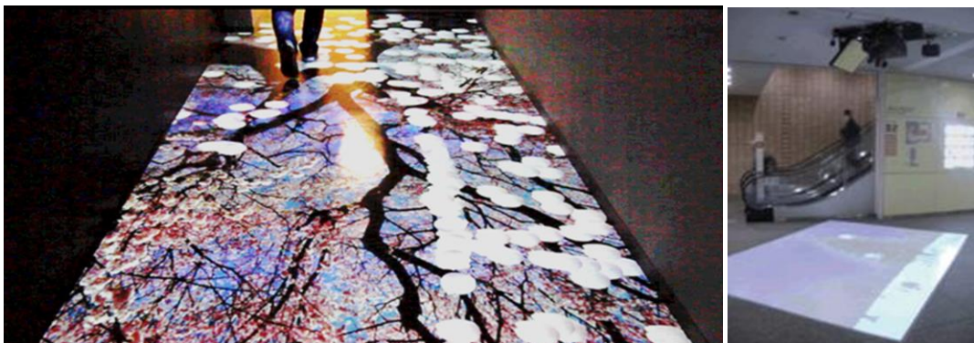
上記イメージ画像：桜が写る水面を歩く

3階東西連絡通路の床面をスクリーンにみたく、足元の動きに合わせて変わる映像をお楽しみいただけるインタラクティブ（対話型）プロジェクションマッピングを設置しました。ご自分の動きと映像、音楽をお楽しみいただける空間の演出で、子どもから大人・シニアまで、歩くことが楽しみになる、何度でも訪れたいくなるような空間演出を行いました。