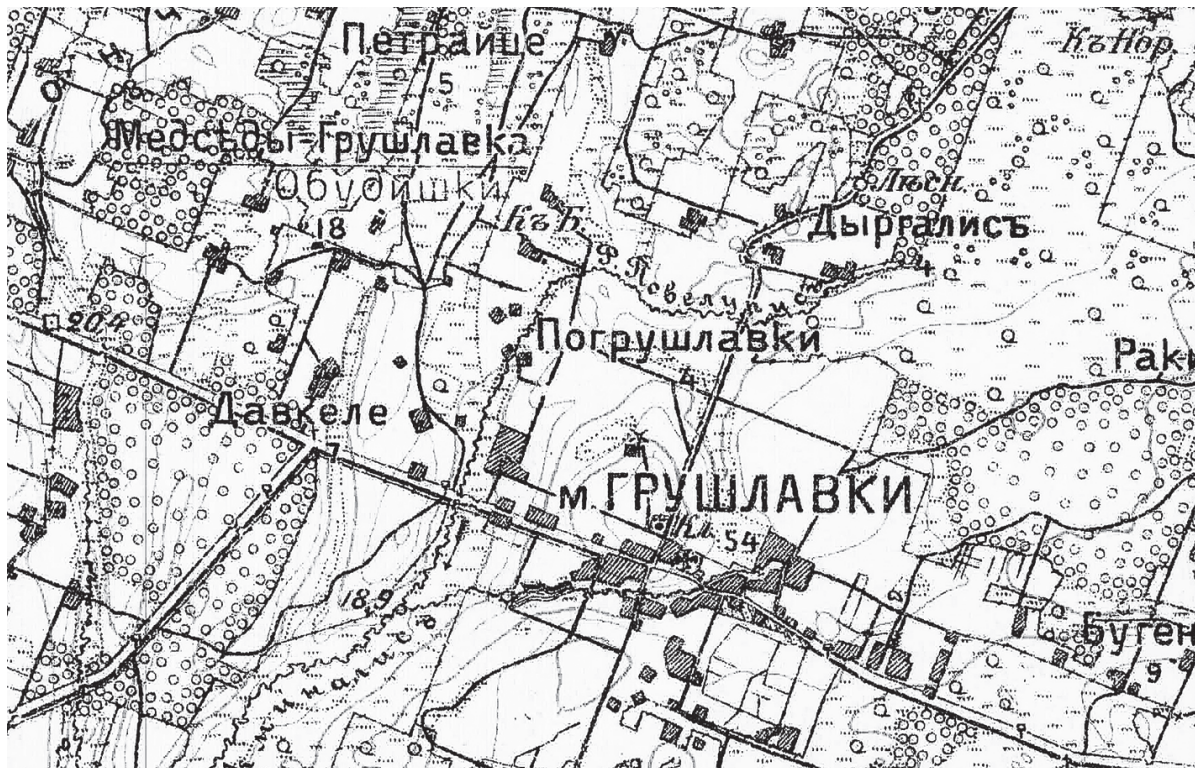
Rusijos imperijos kariuomenės generalinio štabo 1895 m. parengto topografinio žemėlapiio fragmentas su Grūšlaukės apylinkės vietovėmis. Į šiaurės vakarus nuo Grūšlaukės miestelio pažymėtas Grūšlaukės Medsedžių (rus. Медседы-Грушлавка) kaimas ir po jo pavadinimu patikslintas kaimo vardas – Ubagiškiai (užrašytas iškraipytai – Obudiškiai, rus. Обудишкки).