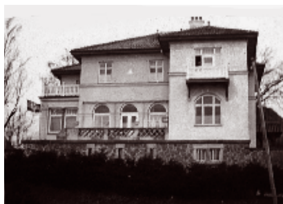
Gestapohovedkvarteret Wisborg med hagekorsflag 1945.