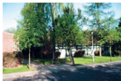
Øjenklinikken i Helsingør

Kroen brændte senere og blev erstattet af 'Kystens Perle', som i 60-