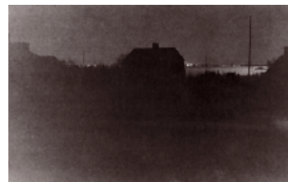
Lysene i det neutrale Sverige kunne ses fra det mørklagte Danmark.