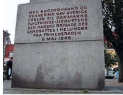
På Sveasøjlen på havnen i Helsingør takkes for den svenske indsats. I Helsingborg findes et tilsvarende monument.