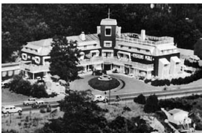
Kystens Perle 1952