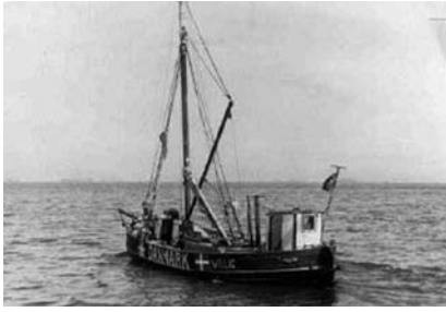
Fiskerbåd med danske kendingsmærker.

varede. Omkring 500 blev taget og deporteret til Theresienstadt, og ikke Auschwitz, som havde betydet den visse død.