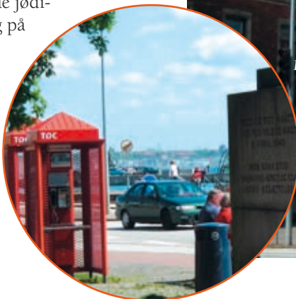
Fra Sveasøjlen (billedhuggeren Mathilius Schack Elo 1947) kan man klart vejr tydeligt se til Helsingborg, 4,5 km væk.

Polisintrendent Göte Friberg havde de danske og svenske administratorers tillid. Han skrev 'Stormcentrum Öresund' om tiden. Såvel Palm som Friberg blev hædret for ikke at holde sig strengt til de svenske regler, specielt før riksdagsbeslutningen 2. oktober 1944 om ikke at sende de danske jøder tilbage.