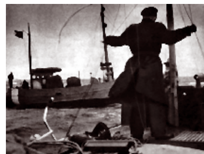
Flygtninge modtages ved territorialgrænsen af den svenske marine.

i spidsen. Først på et sent tidspunkt kom Gestapo-Juhl fra Helsingør. Heldigvis blev de tilfangetagne fiskere fra Snekkersten og Gilleleje overgivet til civilretten, hvor dommer Olrik gav dem en efter forholdene meget mild