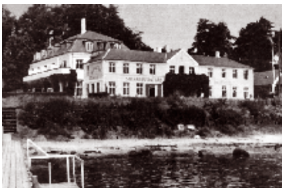
Snekkersten Kro 1943