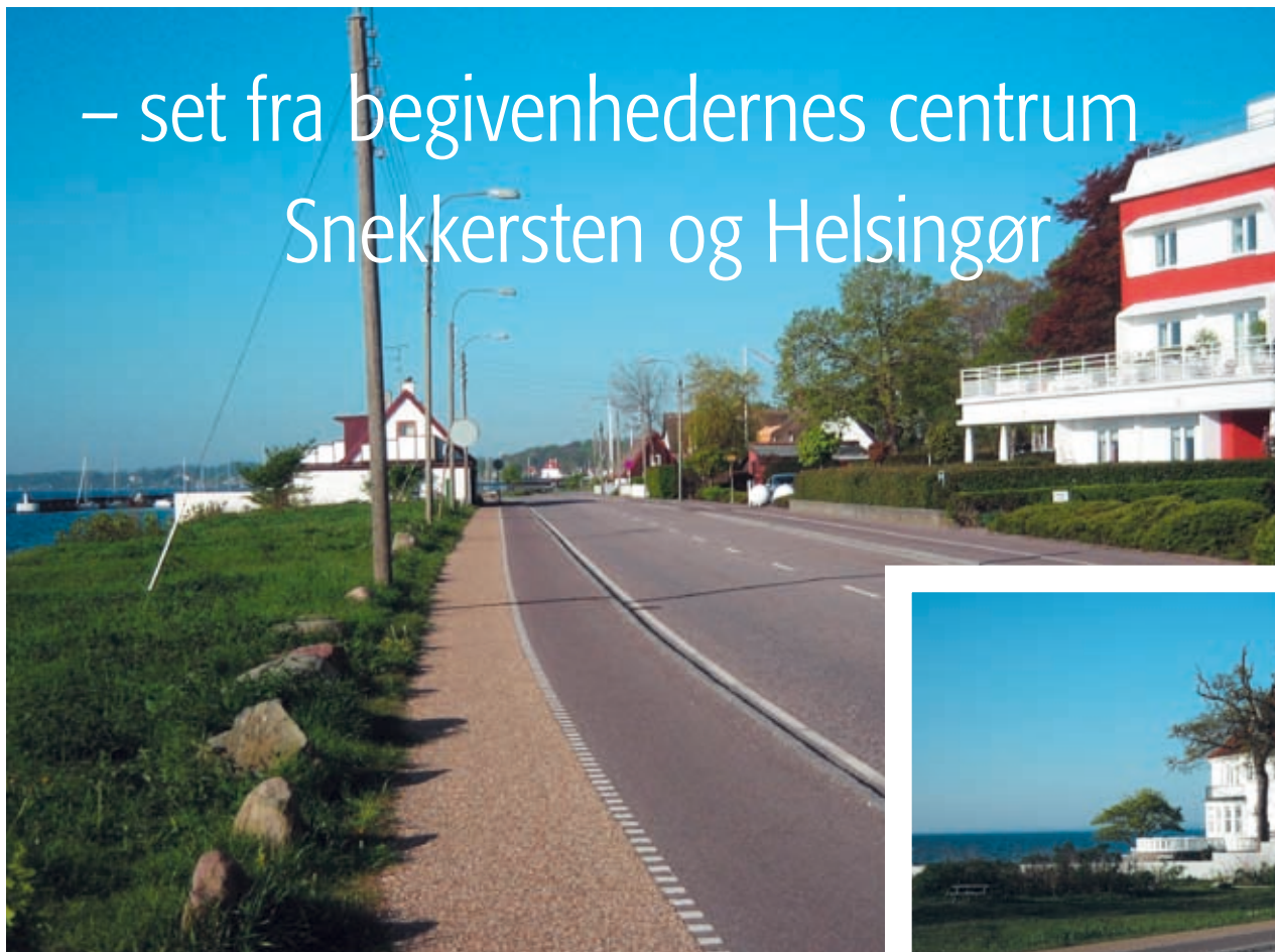
Fra Snekkersten Kro (Kystens Perle) til højre er der udsigt til Snekkersten Havn til venstre og midt for til Stella Maris, hvor kystpolitiet holdt til.

– set fra begivenhedernes centrum Snekkersten og Helsingør