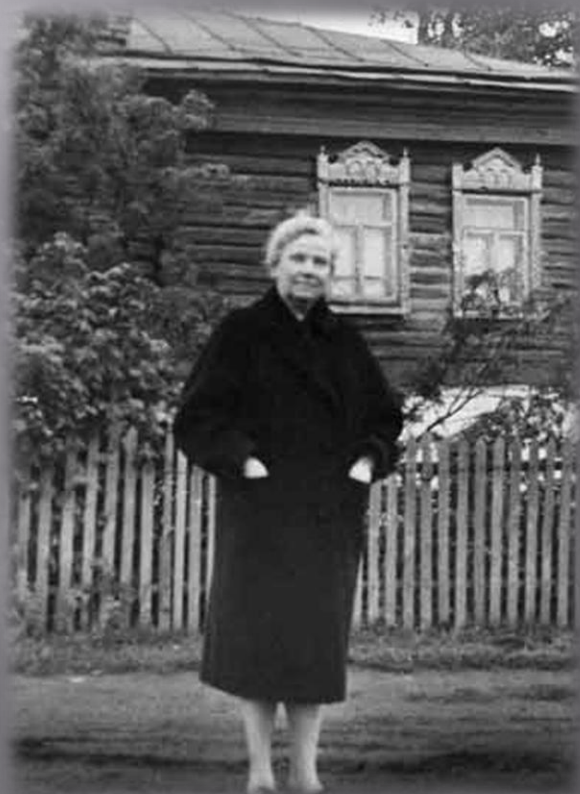
У родного дома 1969 год.