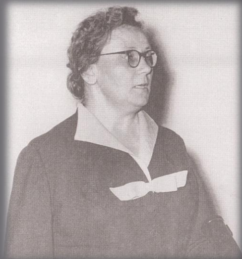
Ковригина Мария Дмитриевна— заместитель наркома здравоохранения СССР. Москва. 1943 год.