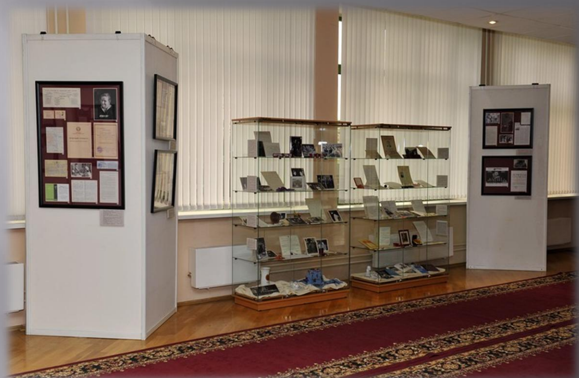
Экспозиция к 100 –летию Ковригиной М.Д. в Москве. Главный архив.