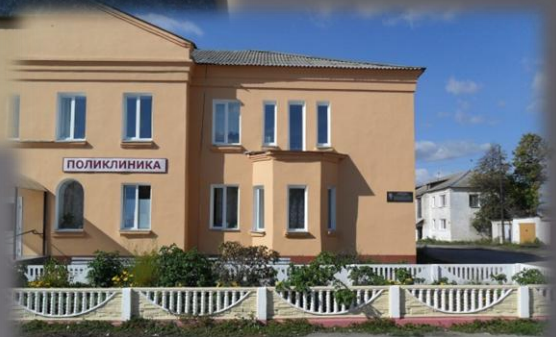
Открытие мемориальной доски на районной поликлинике. г Катайск. 2011 год.