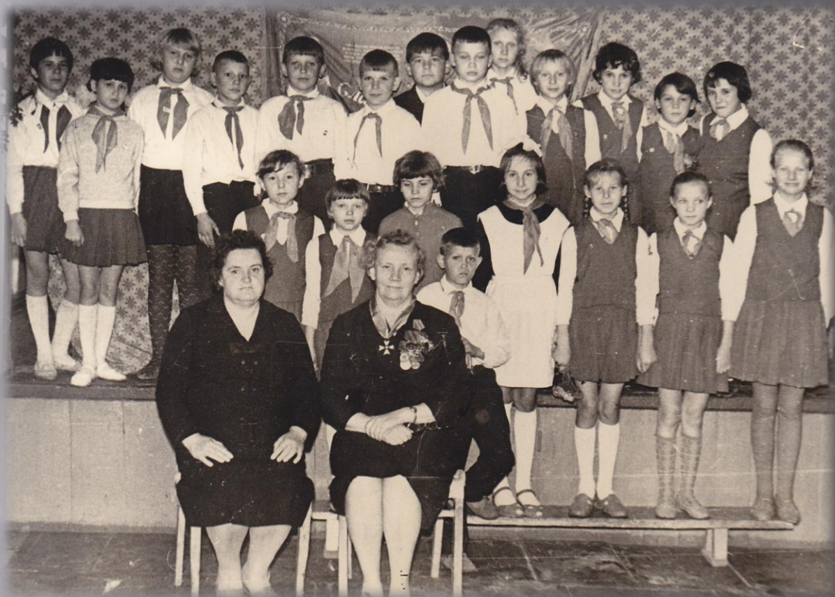
Встреча со школьниками г. Катайск