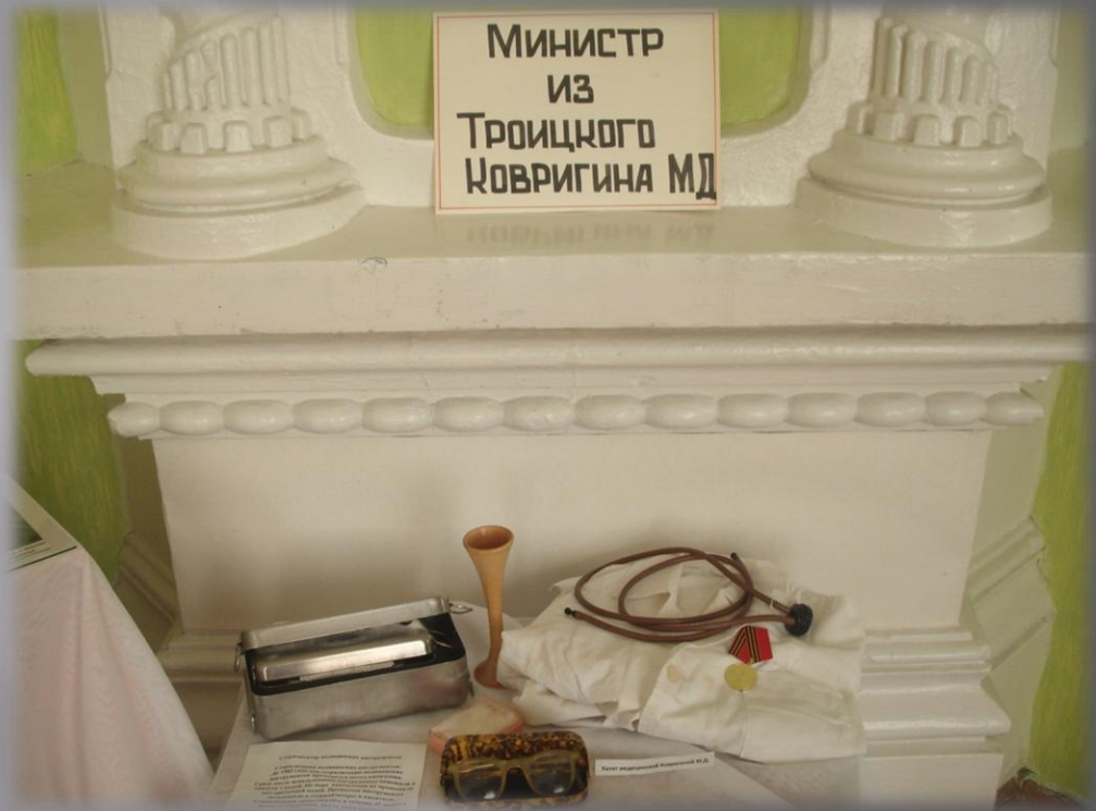
Выставка к 100 - летию Ковригиной М.Д. В Китайском районном краеведческом музее . 2010 год.