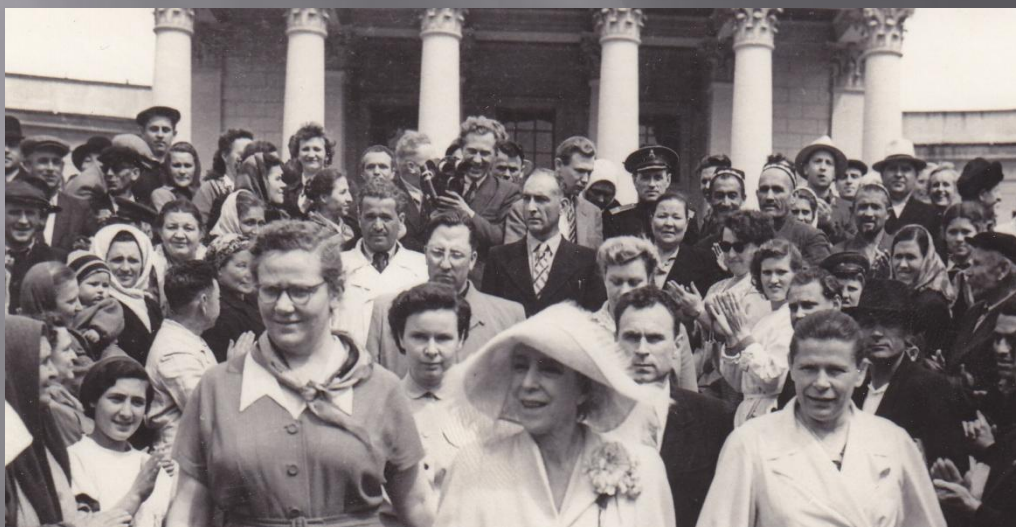
С королевой Бельгии Елизаветой «Красной королевой» г. Сочи. 1958 год.