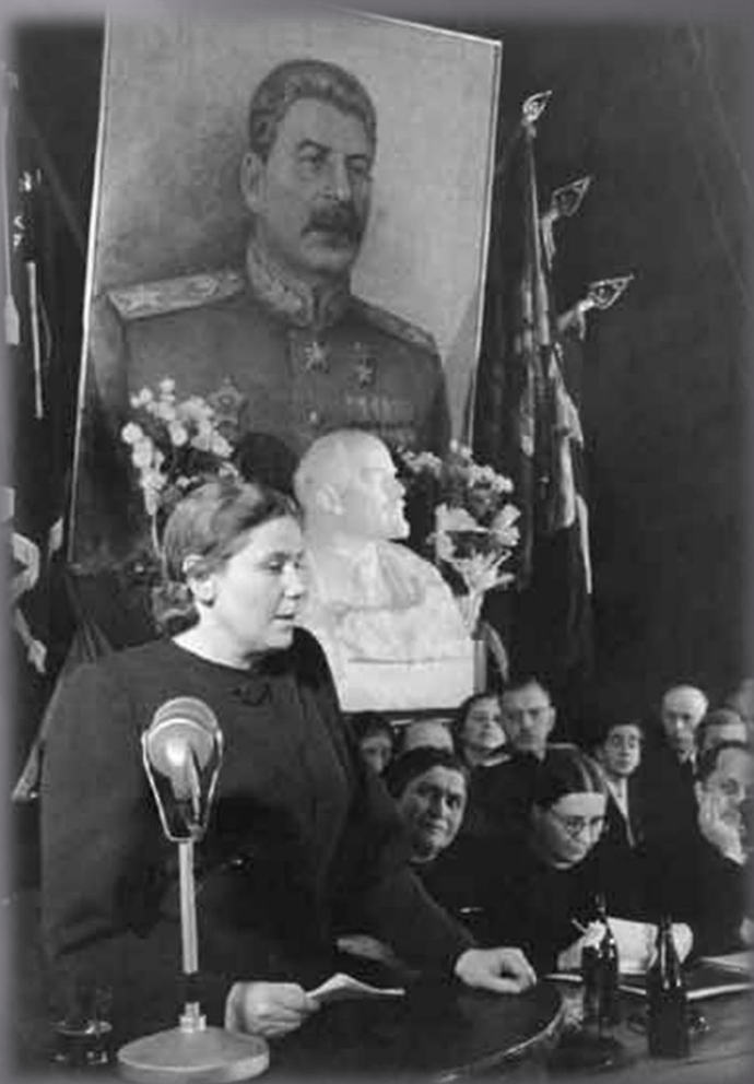
Министр здравоохранения СССР Ковригина М.Д. На XX съезде КПСС. Москва. Кремль 1956 год.