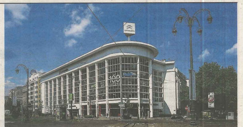
In de Citroëngarage komt een nieuw museum.

Intussen klonk wel al forse kritiek dat Kanal zijn expertise buitenshuis houdt. Op een eigen artistiek directeur is er nog geen