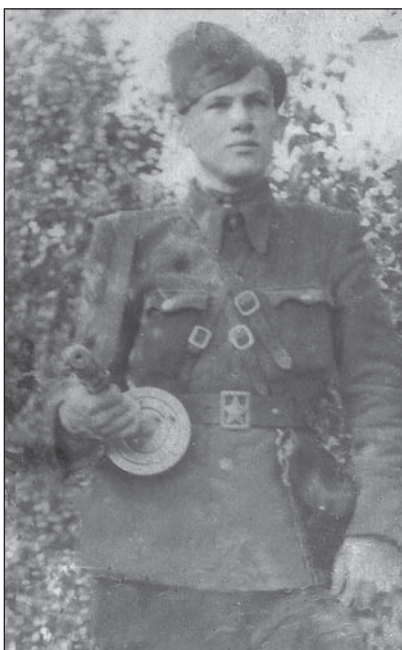
Киселик ("Сокіл") – провідник одного з підрайонів Вербського району ОУН. Рівненська область. 1951 р.