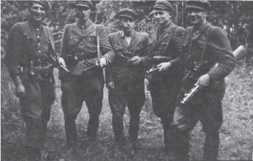
УПА на Волині. Невідомі повстанці. Кін. 1940-х – поч. 1950-х рр. (УСБУ Волинської обл., фонд кримінальних справ на осіб, які перебувають на оперативному обліку, спр. 17863)