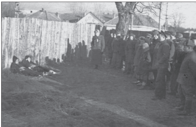
Убиті повстанці. Волинська область. 1940-і рр.