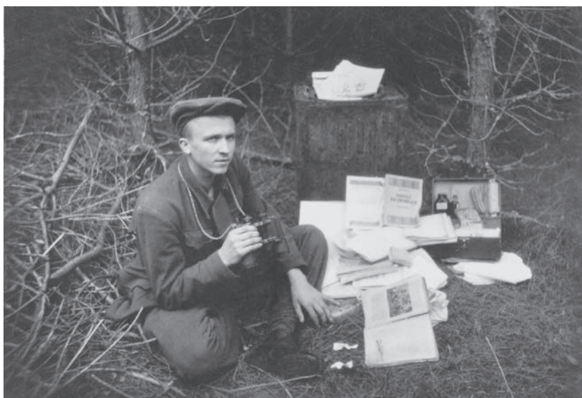
Невідомий пропагандист чи працівник технічної ланки. Волинська область. 1940-і рр.