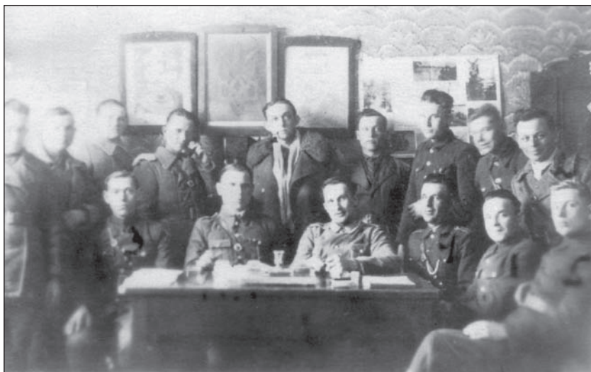
Група українських повстанців. Можливо – штаб якогось куреня УПА. Волинська область. 1940-і рр.