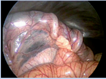
Figura 2. Primera porción de duodeno descendente con páncreas (modelo animal porcino). Se objetiva la tracción del mesoduodeno y el páncreas del SE en su avance y también las zonas de isquemia que causan sus anillos, de gran grosor.

se vean más favorecidas por la insuflación con CO 2 , ya que la forma de avanzar de estas depende más del aire intraluminal que en la SE.