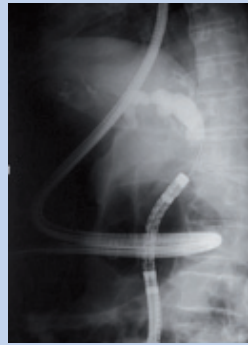
Figura 3. ERCP con endoscopio de doble balón en intestino delgado operado (montaje Y de Roux).

Es similar y aceptable para las tres técnicas 8,13,25 , pero específica de cada una (EDB y SBE por un lado y SE por otro). En cuanto a la facilidad de uso, la diferencia radica en el manejo del sistema de manometría para control de presiones de balones y las maniobras de introducción y retirada para EDB y SBE por un lado, y la maniobrabilidad instrumental más difícil para SE en la introducción VO y paso por duodeno, por otro. Determinadas situaciones pueden requerir específicamente EDB, como la desinvaginación de pólipos de ID en síndrome