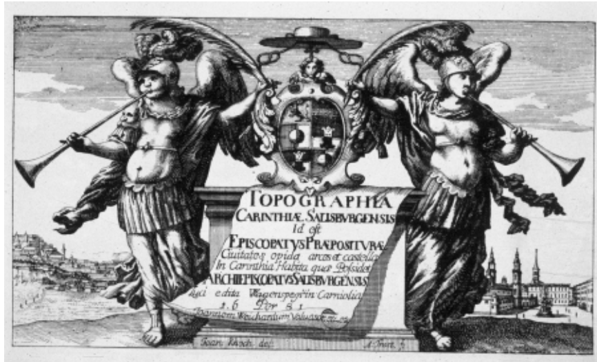
Slika 3: Topografia archiducatus Carinthiae modernae, 1681.