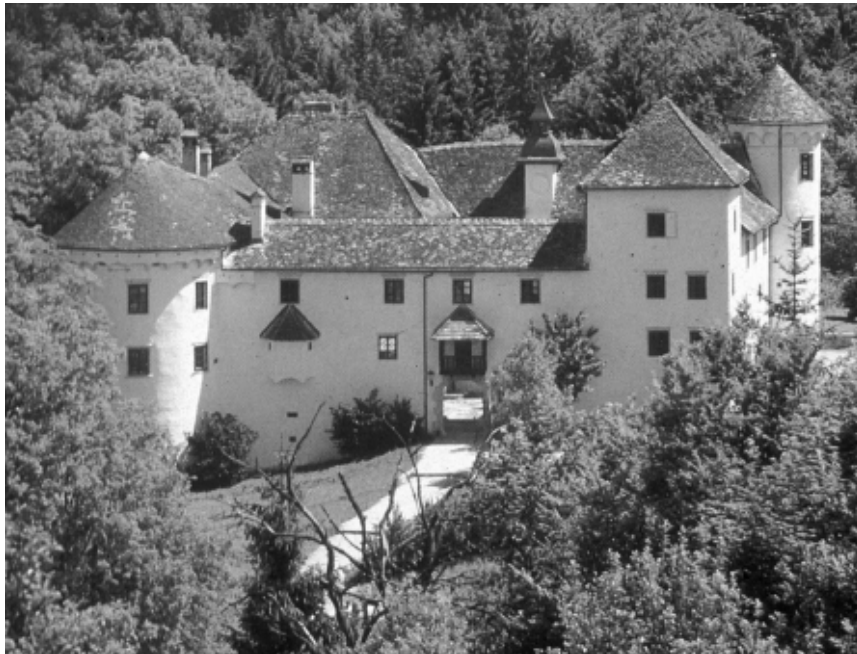
Slika 1: Valvasorov dvorac Bogenšperk

Valvasorova knjižnica prvobitno je bila smještena u slovenskom dvorcu Bogenšperk pri Litiji (slika 1). Kada se Valvasor pripremao za izdanje "Slave vojvodine Kranjske" upao je u velike materijalne poteškoće i bio prisiljen prodati svoje knjižno blago, grafike, dvorac, posjede i kuću u Ljubljani. Cijelu knjižnicu i grafičke listove otkupio je (1690.) zagrebački biskup Aleksandar Ignacije Mikulić (1650.-1694.) i prenio u Hrvatsku.