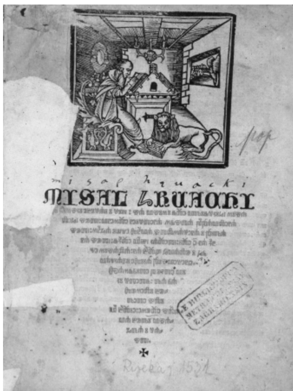
Slika 2: Misal hrvacki ..., V Rici, (1531.)

Prilikom revizije izdvojili smo sve Valvasorove knjige iz cjelokupnog fonda Metropolitane i pospremili ih u vrlo lijepe vitrine na posebno mjesto. Lako je bilo po uvezu prepoznati na policama Valvasorove knjige. Pretpostavljamo da ih je sam Valvasor dao uvezati, jer 80 % knjiga ima isti uvez: kartonske korice presvučene smeđom kožom, a 20 % knjiga uvezano je u čistu bijelu pergamentu ili list kodeksa. Do danas su uvezi u cjelini vrlo dobro ušćuvani. Hrbat je rebrima podijeljen u 3, 4, ili 5 dijelova. Na hrptu svake knjige bijelom bojom ispisano je veliko slovo i brojka pa nam je i taj detalj pomogao pri lakšem identificiranju knjiga koje potječu iz ove knjižnice.