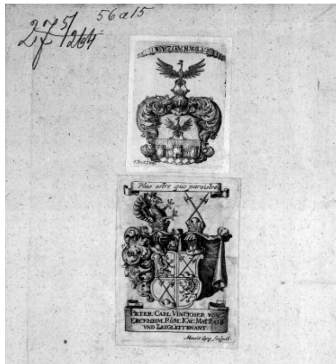
Slika 4: Ex libris: J. V. Valvasor i P. C. Vinckher