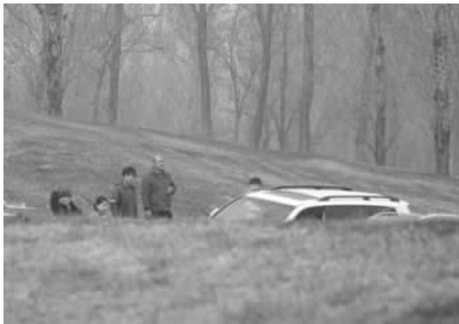
图为爆料者拍摄的游客下车现场