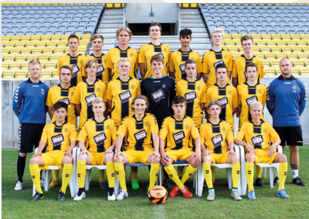
AC Horsens U17.