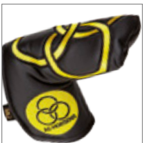
Cover, putter 200,-