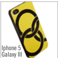
Iphone 5 Galaxy III