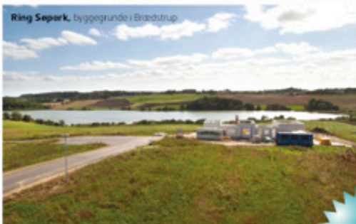
Ring Søpark, byggegrunde i Brædstrup