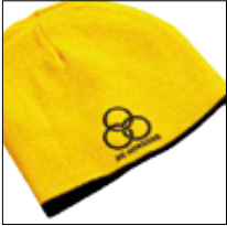
Vendbar hue 100,-