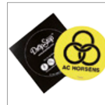
Dropstop til flasker 10,-