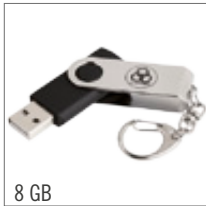
8 GB USB 90,-