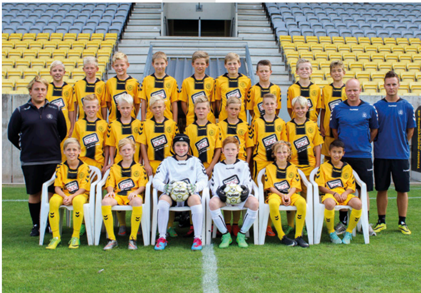
AC Horsens U13.

” Mine favoritklubber er Liverpool og Barcelona, og det er da en stor drøm, hvis man kunne blive professionel fodboldspiller og leve af det.