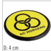
D: 4 cm Magnet 10,-