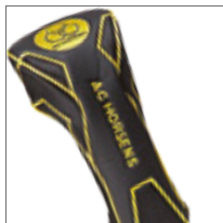
Cover, driver 200,-