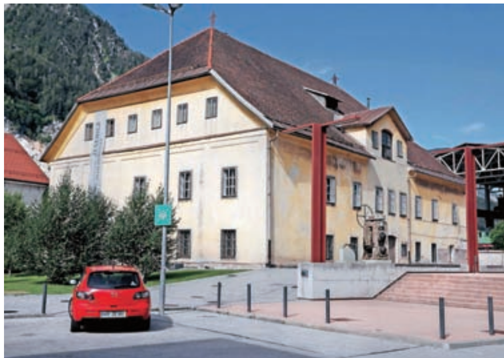
Ruardova graščina na Stari Savi: postavila jo je družina Bucelleni leta 1538 in je ena najstarejših stavb na Jesenicah.

V graščini ima prostore uprava Gornjesavskega muzeja Jesenice, urejen pa je tudi železarski muzej. S selitvijo so začeli že decembra lani, v zadnjih tednih pa so jo pospešili. Kot je povedal