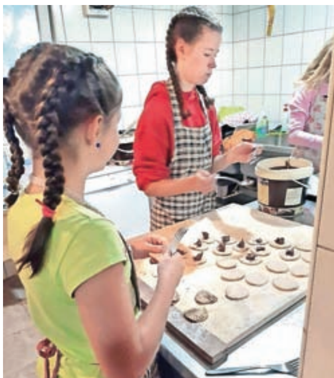
... ter peči kruh in piškote.