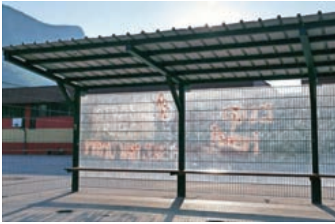
Vandalizem na avtobusni postaji pri OŠ Toneta Čufarja

skupina starejše mladine, ki igrišča izrablja za svoj družabni prostor – s čimer ni nič narobe, dokler ne povzročajo škode. Pogosto tako prihaja do motenja javnega reda in miru s povzročanjem nepotrebne hrupa na igrišču v poznih urah, po igrišču se vozijo z mopedi, puščajo smeti na njem in v okolici, nekateri otroško igrišče uporabljajo za sprejehode s psi in za njimi ne pospravljajo iztrebkov in podobno. Povzročena je bila tudi materialna škoda, in sicer so uničili klopce z žičnatim ogrodjem, iz katerega so pobirali kamne in jih metali v različne predmete z namenom povzročanja škode, po