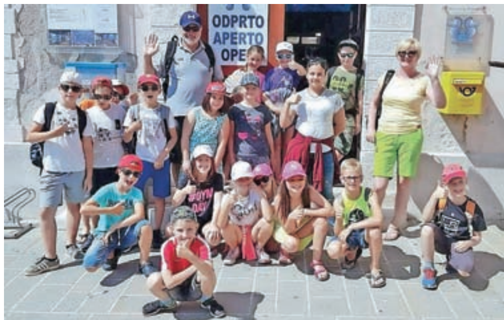
Učenci na nagradnem izletu v Piranu

Reciklirano olje je mogoče predelati v bio dizel, torej ekološko gorivo, ki ne onesnažuje okolja. Glicerin, ostanek pri predelavi, pa se uporablja v farmacevtski industriji.