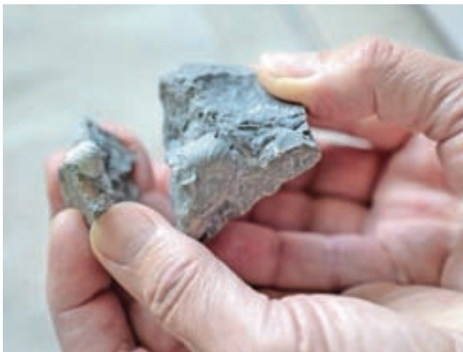
Fosili so okameneli ostanki preteklosti.

Gori. Ob štiridesetletnici tržiškega Društva prijateljev mineralov in fosilov je imel v Atriju v Trziču razstavo ramenonožcev iz rodu Karavankina s 27 točk v Karavankah iz obdobja od spodnjega karbona do srednjega perma. Jeseni na Bledu pripravlja razstavo fosilov, najdenih v bližnji in daljni okolici Bleda. Občasno sodeluje s Prirodoslovnim muzejem Slovenije, nekaj fosilov je podaril tudi Gornjesavskemu muzeju, daroval jih je šolam za potrebe učnih vsebin, nekaj jih je na ogled v informacijskih točkah Triglavskega narodnega parka.