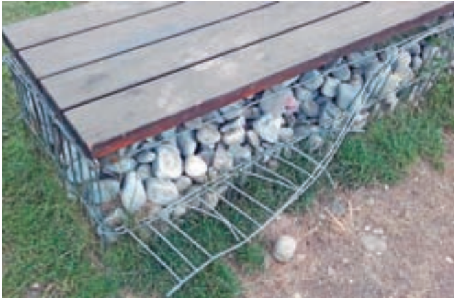
Uničena klop na otroškem igrišču na Slovenskem Javorniku

V zadnjem času na Jesenicah opažajo porast vandalizma, predvsem na območju otroških igrišč.