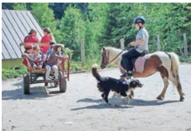
... jahati in voziti s kočijo ...