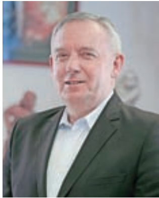
Tomaž Tom Mencinger

Župan Tomaž Tom Mencinger je povedal, da Občina Jesenice nadaljuje nekatere spremembe prometne ureditve, ki bodo pripomogle k večji prometni varnosti in prijaznejši prometni ureditvi, ki sledi načelom trajnostne mobilnosti in sprejeti celostni prometni strategiji Občine Jesenice. Ena od teh sprememb je bila že uvedba modre cone na parkirišču ob Gimnazije Jesenice, ki velja od prejšnjega meseca naprej. Parkiranje je omejeno na dve uri, in sicer od ponedeljka do petka od 7. do 13. ure. "S tem smo zagotovili večjo 'pretočnost' parkiranja in s tem dodatna parkirišča za uporabnike storitev na Trgu Toneta Čufarja, vključno s knjižnico in gledališčem. Pred kratkim pa smo izdali tudi odločbo za vzpostavitev cone z omejitvijo trideset kilometrov na uro na Cesti Toneta Tomšiča, in sicer takoj za križiščem z regionalno cesto pri gimnaziji, ki se konča pri stavbi Cesta Toneta Tomšiča 11. Na tem območju so bile namreč izvedene meritve hitrosti, ki so pokazale na izredno veliko število visokih prekoračitev hitrosti, kar je še posebej alarmantno zato, ker je na tem delu Osnovna šola Prežihovega Voranca. Hitrost je bila sicer že prej z znakom omejena na trideset kilometrov na uro, a tega znaka večina voznikov ni upoštevala. Ker cona 30 predvideva tudi strožje kazni, tudi zavoljo otrok, ki vsakodnevno pešajo čez to območje v šolo in iz nje, upamo, da bodo vozniki omejitve hitrosti upoštevali bolj kot do sedaj," je povedal župan. Kot je dodal, so na območju Ceste Toneta Tomšiča začeli