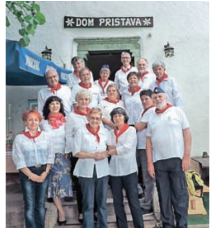
Udeleženci srečanja v pionirskih rutkah in kapah

Srečala se je generacija nekdanjih učencev Osnovne šole Toneta Čufarja, ki je šola zapustila pred natanko pol stoletja.