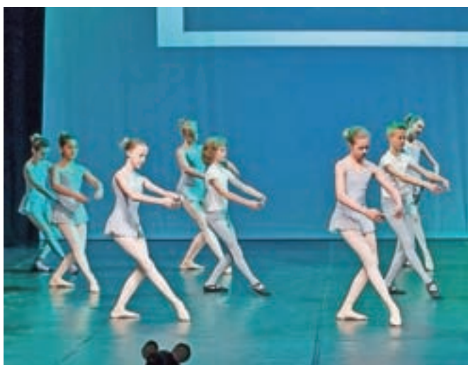
Baletna skupina tretjega razreda