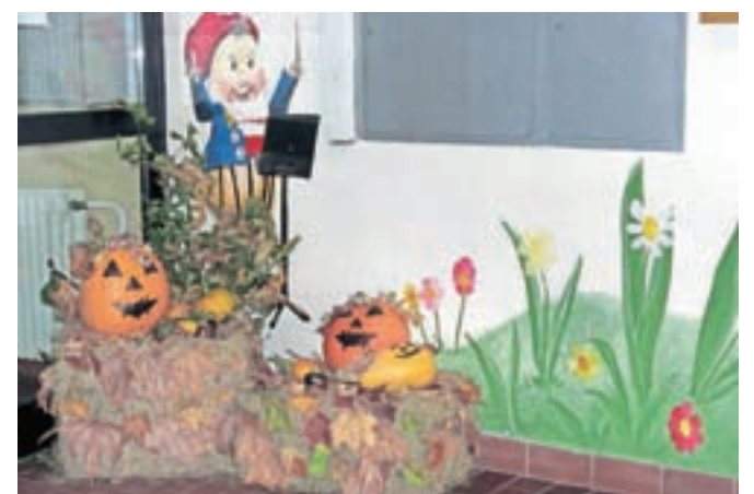
Vhod v stolpnico je polepšal aranžma na temo noči čarovnic.

Včasih tudi drobne pozornosti prispevajo k prijetnejšemu bivanju ljudi, to zlasti velja v večstanovanjskih objektih. V stolpnici na Titovi 41 na Jesenicah, ki je vas v malem, že več kot desetletje skupinica dobrovoljnih skrbi, da vsakdanji utrip ni čisto običajen. Ob različnih praznikih, na primer ob božiču, novem letu ..., in ob drugih priložnostih poskrbi za različne aranžmaje v notranjih prostorih. Prizadevajo si, da je sobivanje vseh prijetnejše na kakšnem skupnem družabnem dogodku. Sedaj jeseni spet zaslužijo pohvalo za lepo urejen vhod v stolpnico, in sicer ga tokrat krasi aranžma buč, ki sodi k noči čarovnic. Vse z namenom, da se nekaj dogaja, da v stolpnici ni preveč monotono.