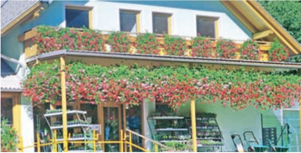
V ponos Jesenicam so med drugim Trgovina Štof ...

V letošnjih poletnih mesecih je potekala šestnajsta akcija z naslovom Najlepša cvetlična zasaditev.