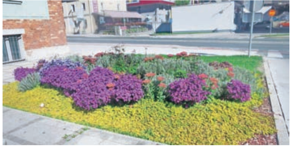
in številne lepo urejene zelenice v mestu.

Zaključna prireditev s kulturnim programom je bila 9. oktobra v dvorani Kolpern na Stari Savi. Marljivi posamezniki, ki jim vreme večkrat zaradi visokih temperatur in suše ni bilo najbolj naklonjeno, so priznanja prejeli za najlepše balkone v stanovanjskih hišah, v večstanovanjskih hišah, za najlepši cvetlični vrt, najlep-