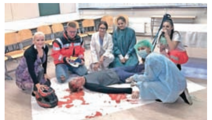
Dijaki Srednje šole Jesenice so pripravili sedem zanimivih delavnic, veliko zanimanja je vzbudila tudi delavnica zdravstvene usmeritve.

dnja šola Jesenice. Predstavila se je s strojno, zdravstveno in predšolsko usmeritvijo, dijaki ob pomoči profesorjev pa so pripravili sedem zanimivih delavnic, s katerimi so devetošolce skušali navdušiti za šolanje za poklice v strojništvu, zdravstveni negi in predšolski vzgoji.