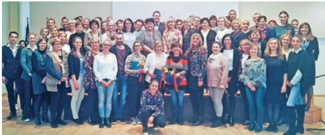
Udeleženci Šole za klinične mentorje

za mentorje," je povedala v. d. dekanje Fakultete za zdravstvo Angele Boškin Sanela Pivač. Kot je napovedala, pa na fakulteti razvijajo tudi program za izpopolnjevanje Mentorstvo v kliničnem okolju, ki bo novost na področju ponudbe študijskih programov.