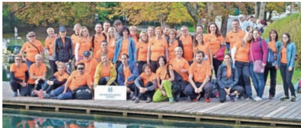
Ekipa Splošne bolnišnice Jesenice je zasedla odlično drugo mesto.

nice pa je zasedla drugo mesto. Dan je bil namenjen druženju, je pa ekipa jeseniške bolnišnice pokazala, da je pripravljena na vse, saj je pomagala tudi poškodovancu na igrišču.