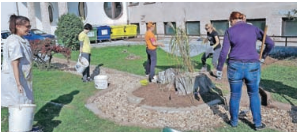
... ter zasadili okrasno cvetje in grmičevje.