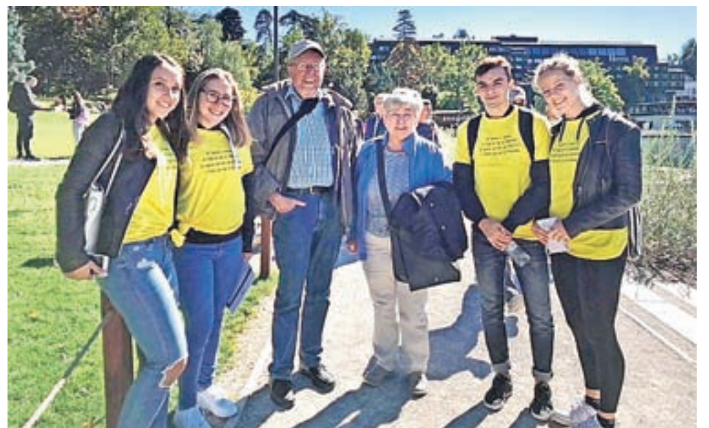
Tuji turisti so z veseljem poklepetali z mladimi.