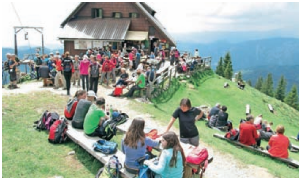
Letošnja poletna sezona je bila v Koči na Golici zelo uspešna.

Maja so v okviru mednarodnega projekta Alpe Adria Karavanke odprli Info točko, ki je prva v Karavankah. Planincem so na voljo vodniki, zemljevidi, karte in drugo gradivo z opisom poti, nekaj je tudi planinske