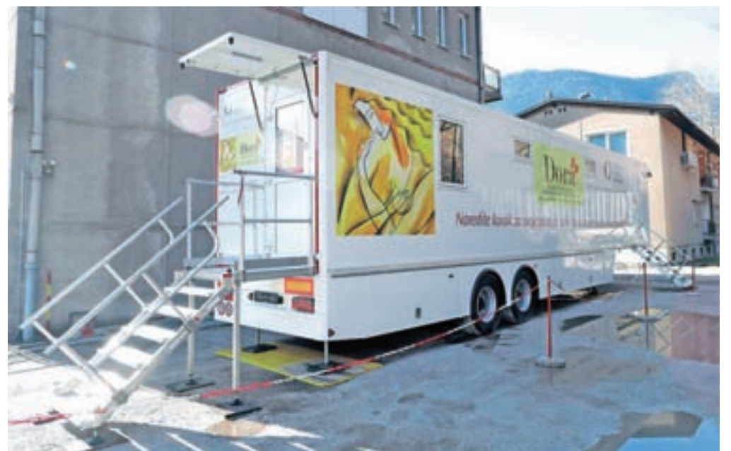
Mobilna enota z najsodobnejšim mamografom je postavljena ob upravni stavbi Splošne bolnišnice Jesenice.

Za presejalno mamografijo v programu Dora ženske ne potrebujejo napotnic, pregled je brezplačen. Na vrsti so ob naročeni uri, brez čakanja, rezultati so hitri. Kadar radiologi pri odčitavanju mamografskih slik vidijo spremembe na dojki, žensko na dodatne preiskave povabijo na Onkološki inštitut v Ljubljano, kjer poteka tudi zdravljenje morebitnega raka dojk.