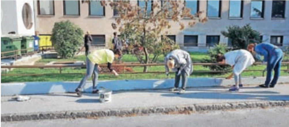
Zaposleni so med drugim prebarvali ograje ...

"Odločili smo se, da uredimo okolico šole, ki je klicala po večjem posegu. Uredili smo športno igrišče, atrij in vrt pred šolo: prepleskali smo oporne zidove, obnovili tekaško stezo, prebarvali otroška igrala, odstranili grmičevje in plevel, pregrabili zelenice, nasadili okrasno cvetje in grmičevje ter uredili okrasno potko na vrtu. Poleg tega smo prebarvali tudi ograje," je povedal Pekolj, ki je pred časom vodil tudi prostovoljno akcijo urejanja otroškega igrišča pri TVD Partizan na Koroški Beli.