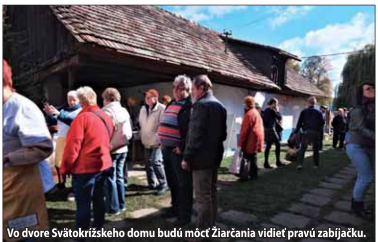
Vo dvore Svätokrížskeho domu budú môcť Žiarčania vidieť pravú zabíjačku.