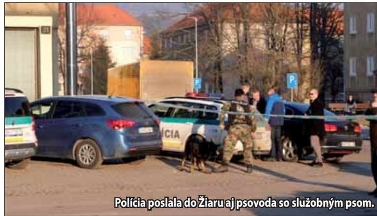
Polícia poslala do Žiaru aj psovoda so služobným psom.

Vyšetrovatel v Žiari nad Hronom začal trestné stíhanie vo veci prečinu šírenia poplašnej správy voči nezistenému páchatelovi. „Doposiaľ nezistený páchatel v stredu 15. februára v popoludňajších hodinách na Jiráskovej ulici oznámil náhodne okoloidúcej žene zo Žiaru nad Hronom, že v pobočke VÚB banky v Žiari nad Hronom je bomba,“ informovala krajská policajná hovorkyňa Mária Faltániová a ako podotkla, páchatel vedel, že táto správa nie je pravdivá a môže vyvolať opatrenia vedúce k nebezpečenstvu vážneho znepokojenia zamestnancov a zákazníkov pobočky banky. „Oslovená osoba následne túto informáciu oznámila na tiesňovú linku 112, v dôsledku ktorej bolo evakuovaných 13 osôb, ktoré sa nachádzali v tom čase