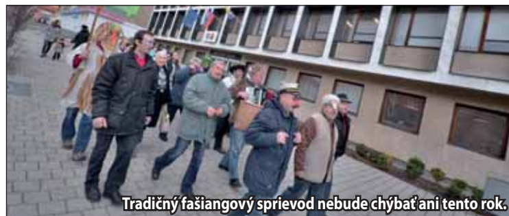
Tradičný fašiangový sprievod nebude chýbať ani tento rok.