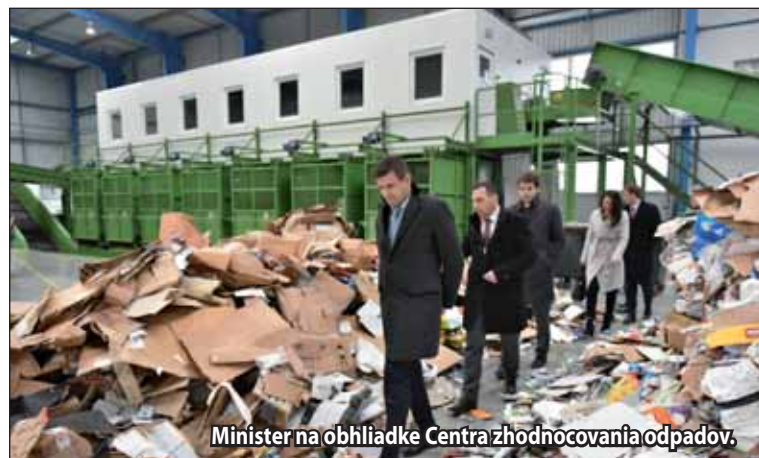
Minister na obhliadke Centra zhodnocovania odpadov.