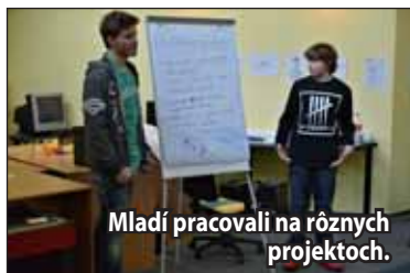
Mladí pracovali na rôznych projektoch.