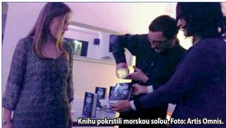
Knihu pokrstili morskou soľou!

Rovnako ako predchádzajúci román Večnosť omylov, aj Úvod do teórie chaosu vyšiel v žilinskom vydavateľstve Artis Omnīs. Za zmienku určite stojí fakt, že autorka na svojom treťom románe pracovala niekoľko rokov. „Kedže do