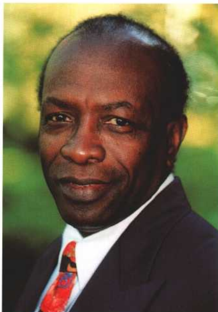
Jack A. Warner, Chairman of the Committee for FIFA Youth Competitions

For while they may be called, with justification, world championships, these teenage gatherings still have an immense educational value for players and spectators alike, bringing together different ethnic groups and cultures in the context