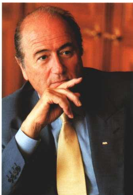
Joseph S. Blatter, FIFA President

Neither should we fail to mention another name in connection with this memorable project. As a member of the FIFA Executive Committee and President of