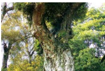
市樹「櫛」 (2009年4月4日公告)

山毛櫛科常綠喬木，市內的櫛樹大部分是自生。從古至今因作為樹籬及農具、建築材料而與生活密不可分，市民對其深感熟悉、親近。