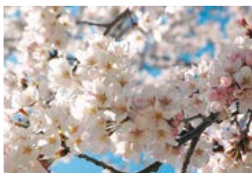
市花「櫻花」 (2009年4月4日公告)

山毛櫛科常綠喬木，市內的櫛樹大部分是自生。從古至今因作為樹籬及農具、建築材料而與生活密不可分，市民對其深感熟悉、親近。