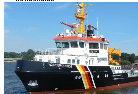
Ab jetzt im Einsatz: Der neue Tonnenleger NORDERGRÜNDE