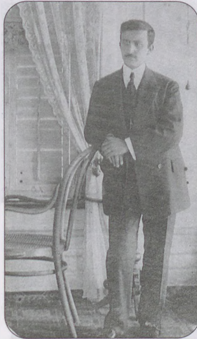
Sermet Muhtar Askeri Müze'de göreve başladığı yıllarda

sinde, eski İstanbul bütün ihtişamı ile güzelliği ve geleneğiyle yaşamaktaydı.