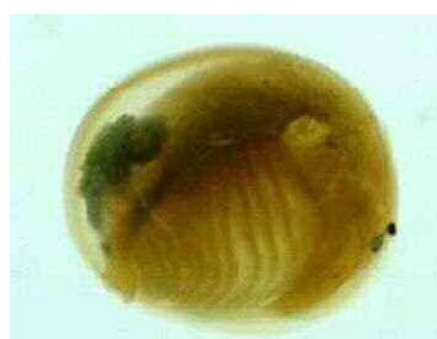
タマカイエビ（タマカイエビ科）