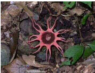
アカイカタケ（アカカゴタケ科）