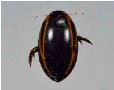
スジゲンゴロウ（ゲンゴロウ科）