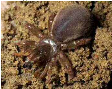
ワスレナグモ（ジグモ科）