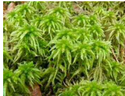
オオミズゴケ（ミズゴケ科：蘚植物門）

植物体は淡緑色で、基物上を匍う。茎は長さ1cm以内。かつては西南日本の暖地の溪流沿いの湿度の高い林の常緑樹やシダの生葉上に着生し比較的普通に見られたが、近年その生育地が減少傾向にある。