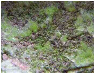
カビゴケ（クサリゴケ科：苔植物門）