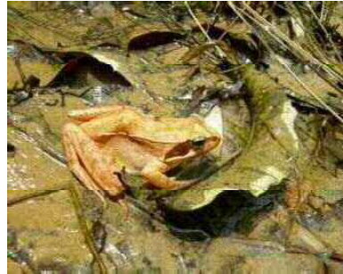
ニホンアカガエル (アカガエル科)

金剛・和泉の山地に生息し、河川上流部のわずかな流れに産卵し、幼生は流水の中で成長する。産卵期以外は水から離れて暮らし、林床などで見つけるのは難しい。