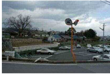
有馬一高槻断層帯による断層変位地形

マイロナイトとは岩石が固体の状態で塑性的に変形し形成される岩石。河合・神於山マイロナイトは、岸和田市の白亜紀領家花崗岩類に東西走向で発達する、幅約500mの延性剪断帯である。このような延性剪断帯は、内陸地震の発生と密接に関係していると考えられている。