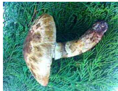
マツタケ（キシメジ科）

腐食の貯まる雑木林に発生する腐生菌類。イソギンチャクのような奇抜な形態である。独特の臭気を放ち、胞子はハエなどの昆虫が運ぶ。近畿では発生地でも見られる年は限られており、稀産種である。多様な菌類がさまざまな条件下でさまざまな有機物を分解し、分解系を構成している。