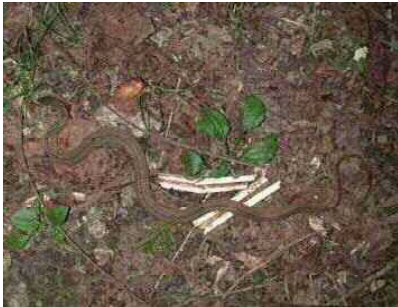
タカチホヘビ (ナミヘビ科)