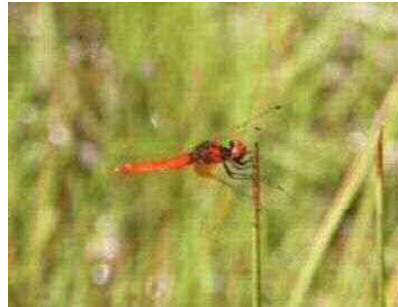
ハッチョウトンボ（トンボ科）

水田地帯に生息していたと考えられるが、近年全国的に記録がなく、環境省 2012 年版レッドリストでも絶滅種となった。大阪府では生息が知られていなかったが、今回の標本調査により、1950 年代に現在の堺市美原区に生息していたことが明らかになった。