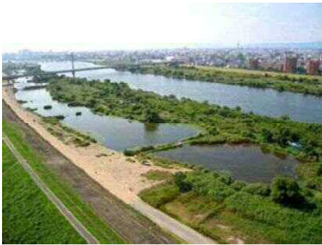
淀川ワンド群（城北・庭窪・楠葉など）