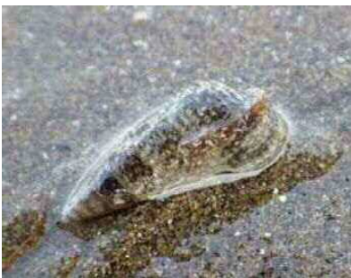
ホソウミナナ（ウミナナ科）