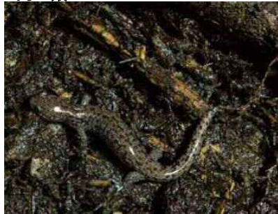
コガタブチサンショウウオ (サンショウウオ科)