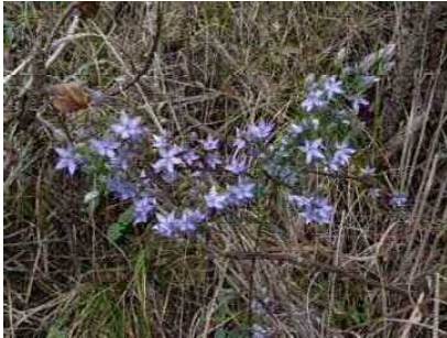
ムラサキセンブリ（リンドウ科）