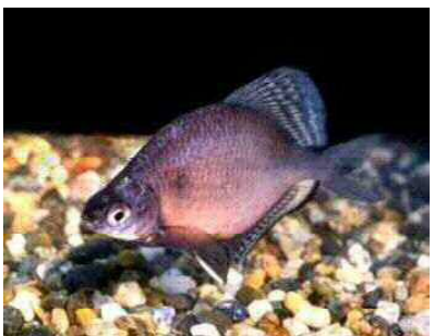
イタセンバラ (コイ科)