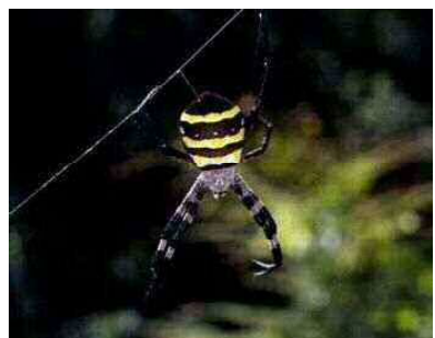
コガネグモ（コガネグモ科）

フタのない縦穴に放射状の糸を引いてその中で待ち伏せ、昆虫などを捕獲する。平地の草地や畑、公園などに生息するが、府内での生息地は限られる。