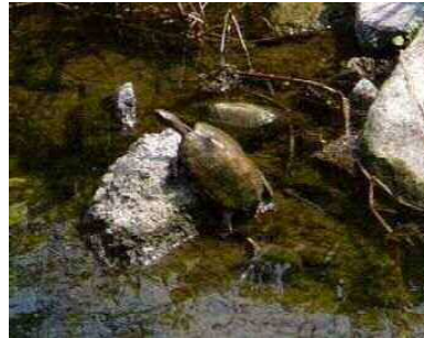
ニホンイシガメ (イシガメ科)

北摂や金剛・和泉の山地に生息するが、個体数は少ない。ミミズを主食とし、落葉樹の落ち葉がよく堆積した谷筋などで見つかることが多いが、タカチホヘビの生息に適した場所は限られる。