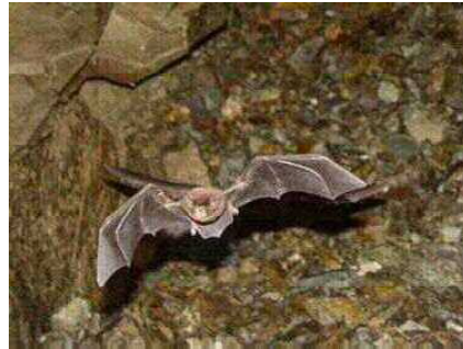
ユビナゴコウモリ (ヒナコウモリ科)