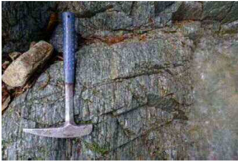
河合・神於山マイロナイト