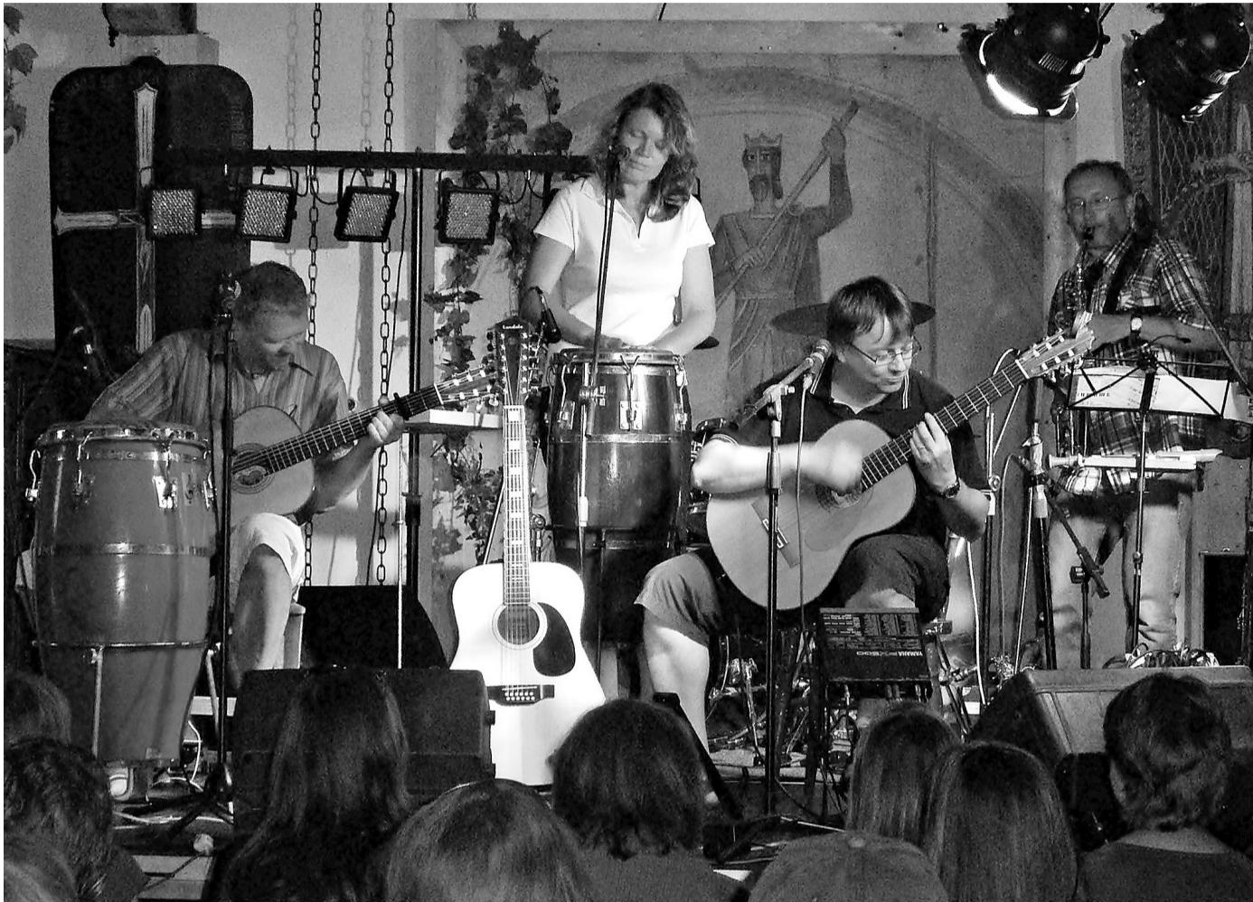
NÁVRAT. Jedním z prvních festivalů, kde se obnovená skupina Spolektiv představila, byl koncem června Letní Slunowrat v Táboře. Letošním vrcholem bude pro kapelu 22. listopadu koncert na Malé scéně Metropolu, kde zahraje ve stejném složení jako kdysi.

Během pauzy se jako kamarádi scházeli, pořádali kapelní i rodinné srazy. Mají se rádi. „Nikdy jsme si nic špatného neudělali, žádné hádky, nevrážíme, křeč,“ vysvětluje kapelník.