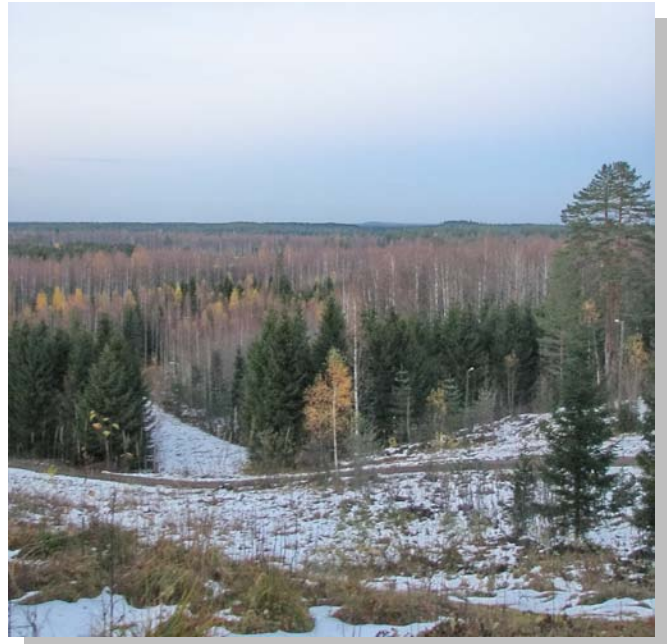
Kuva: Pia Mylly

Rasivaaran alueelle on tehty maankäyttösuunnitelma 15-20 vuotta sitten. Kylän alueella on tälläkin hetkellä myytäviä tontteja; kylällä vapaata rakennusmaata n.1 ha, rannempuna paljon sopivia alueita (esim. Piimälahti ja harjualuetta, etäisyys tonteilla n. 200 m rannasta).