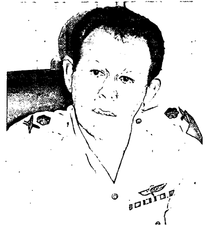
הנספח הצבאי, האלוף מרדכי (מוטה) גור

לסיום הקרבות, וכי ואשינגטון מקווה לקבל הבהרות על עמדתה של קהיר. הדבר "היה לתועלת רבה", ויתרום לגיי צוב עמדתה בדיון הנוכחי במועב"ט. 30 אשר לסובייטים, דומה כי על יסוד המג-עים שקיים עם השגריר דוברינין הניח קיסינג'ר, כי הללו מכירים בצורך שבה פסקת אש "במקום" במועד מוקדם, וכי תשובתם החיובית תגיע בהקדם. 31 ואולם תקוותיו של הממשל להפסקת אש מהירה עתידות היו להתברר במהרה; ישראל סרבה, ממצרים עדיין לא התקבלה תשובה ואילו הסובייטים בניגוד למצרים, תמכו אמנם בניסיון להפסקת אש "במקום", אולם ברור היה, כי ככל שהכוחות הסוריים הולכים ונדחקים מרמת הגולן, הופך עניינה של בריה"מ למנוע את התמוטטותם לשיקול מכריע במהלכה; ואכן בעשרה באוקטובר החלה רכבת אוויר סובייטית לספק סיוע צבאי מקיף לסוריה ולמצרים. 32