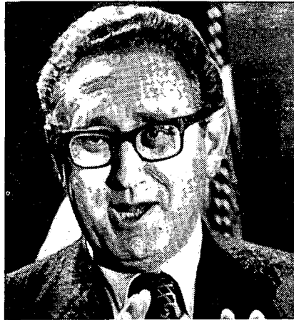
מזכיר המדינה, ד"ר הנרי קסיניגר