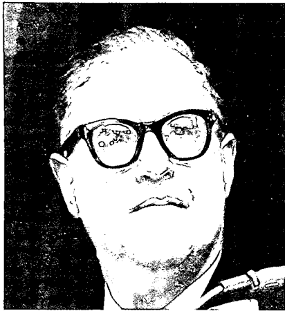
שר החוץ, אבא אבן