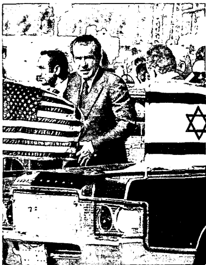
הנשיא ניקסון בלוד

שכן "אחרי ה־13 באוקטובר יכולנו להצביע על תספוקה המאסיבית של ישראל כתגובה לרכבת האוויר הסובייטית, כמו גם לכשלונה העצמי של בריה"מ בקידום היוזמה להפסקת האש" 82 , והדברים מדברים עבור עצמם.