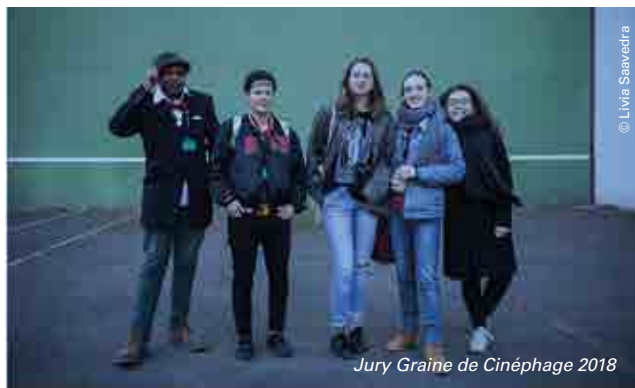
Jury Graine de Cinéphage 2018

Cette section est centrée sur l'âge de la préadolescence où la quête de l'autonomie et l'expérience des limites peuvent faire basculer dans la rudesse cruelle de la vie adulte.