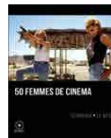
Marest Editeur, 2018 160 pages illustrées/quadri prix TTC 19 €