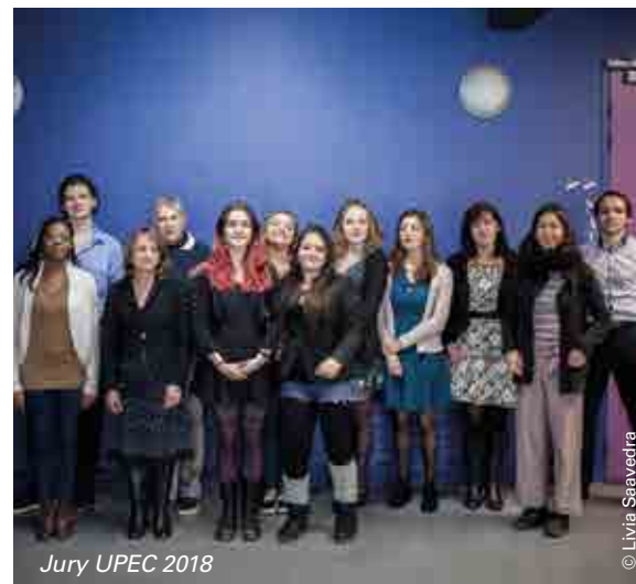
Jury UPEC 2018