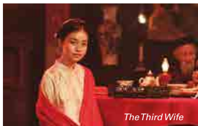
The Third Wife