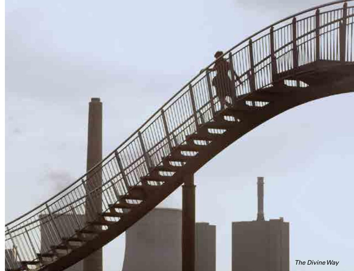
The Divine Way

et les meilleures vidéos avec @Inafr_officiel