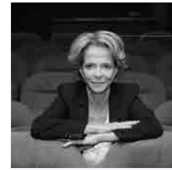
Frédérique BREDIN Présidente du CNC

Ouvrons avec confiance et vigilance, ce 41 e Festival International de Films de Femmes.