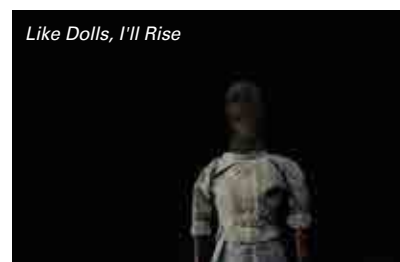
Like Dolls, I'll Rise