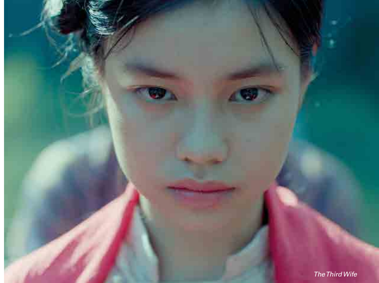
The Third Wife

Le scénario lauréat sera lu lors de cette nouvelle édition et bénéficiera, si les fonds sont réunis comme les années précédentes, d'une aide à la production pour en permettre la réalisation.