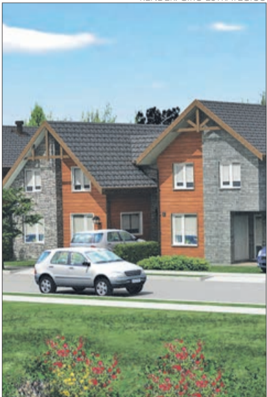
RENDER: GIRO ESTRATÉGICO

que la zona penceopolitana cuente con un tren subterráneo, reiteró que este proyecto debiera ir hermanado al soterramiento de la línea férrea. CIUDAD PÁG. 8