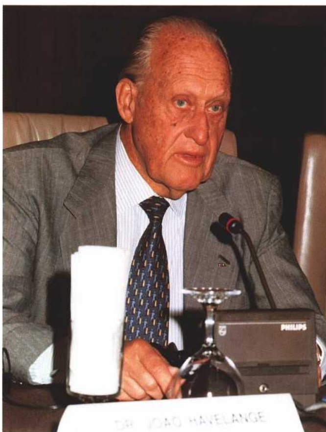
Dr João Havelange, President of FIFA

I had wanted to create the World Youth Championship in order to give the stage to the youth of the world. And the young footballers of dozens of different countries have responded to that invi-