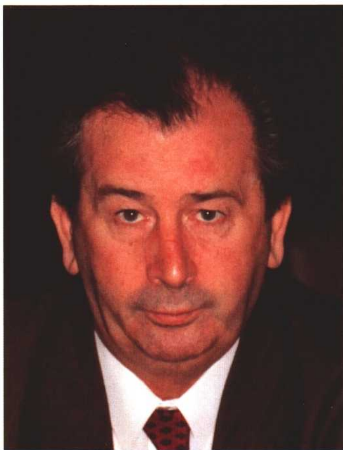
Julio H. Grondona, Chairman of the Committee for FIFA Youth Competitions

There had been voices which had wondered whether the bold decision to augment the number of finalist teams from 16 to 24 was a wise one. That fear was very quickly laid to rest as the young players in Malaysia responded to the challenge with a consistently high standard of play and good sportsmanship which very quickly characterised this as one of the most outstanding Championships to date.