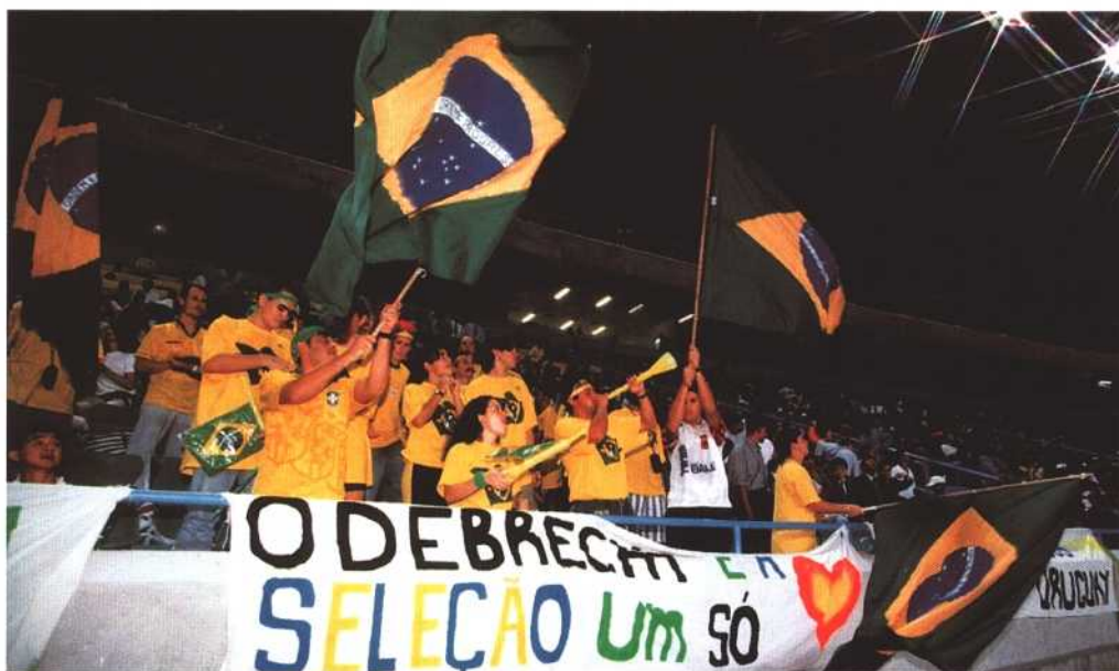
Enthusiastic spectators cheer the outstanding play of the Brazilian team, which broke all records in the group matches and in the last-sixteen stage (1/8 finals).

Les spectateurs enthousiastes saluent le performances exceptionnelles de l'équipe brésilienne, qui battit tous les records lors des matchs de groupe et des huitièmes de finale.