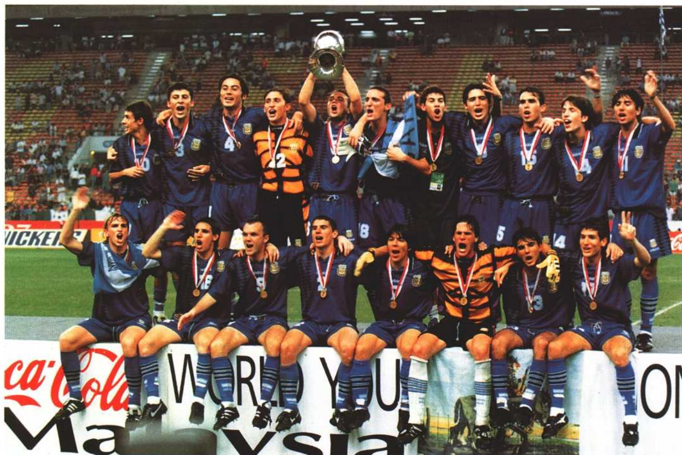
Jubilant Winners: Argentina win the FIFA/Coca-Cola Cup for the third time after 1979 and 1995.

Heureux vainqueur: l'Argentine a remporté la Coupe FIFA/Coca-Cola pour la troisième fois, après 1979 et 1995.