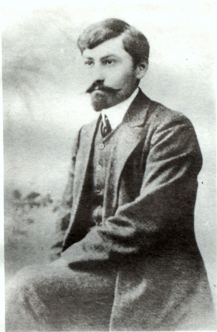
Դրօյի հայացքը... մշտապէս Արարատին սենոված...