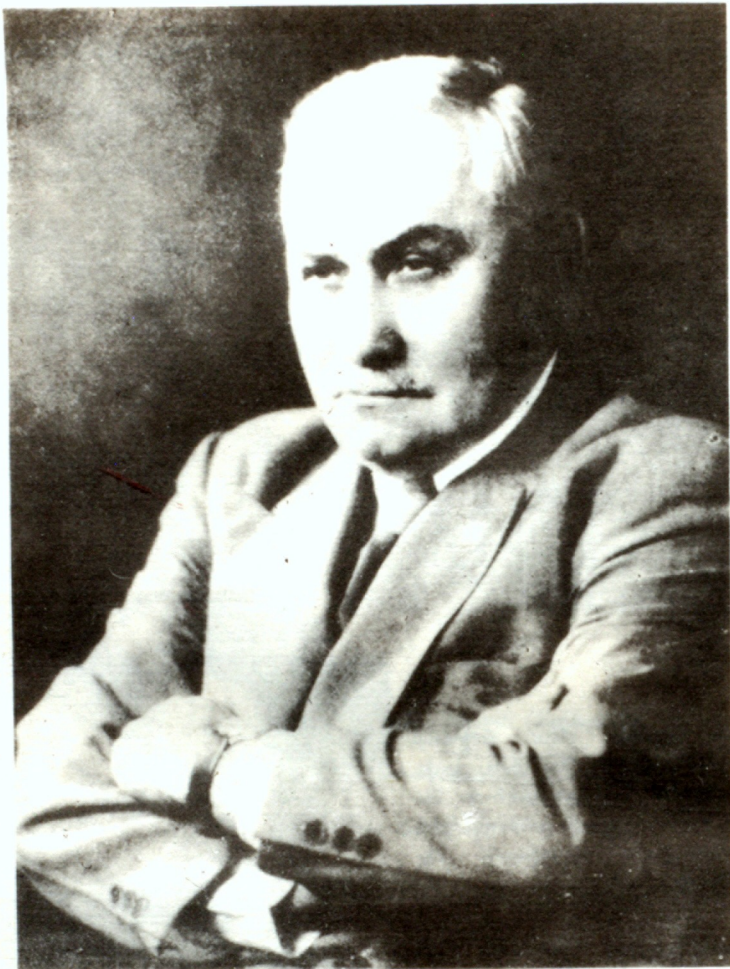
«... Այն, մեկ էլ Երկիրը տեսնեի...» (1956) Գրոյի վերջին խոսքերից

Ահաբեկիչը, ՄեՐ ԱՆՆՄԱՆ ԳՐՕՆ, վայրկենաբար անհետացաւ, եւ ոստիկանութեան բոլոր ճիգերը՝ գտնելու թանկագին որսը՝ ապարդիւն անցան: