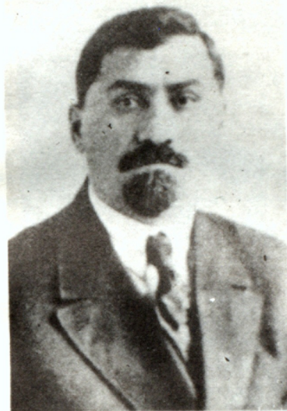
«... Դրօյի մեծագոյն ծառայութիւնը Հայաստանին ու հայ ժողովրդին եղաւ հէնց թ պատերազմի ընթաց- քին, երբ նա երեսօրապէս գոր- ծակցում էր գերմանացոց հետ...» (1943)