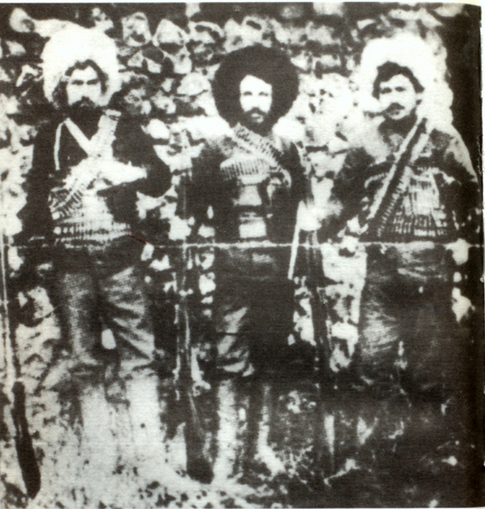
Դրօ, Մասրէս, Քիրս Խեչօ, (1905)