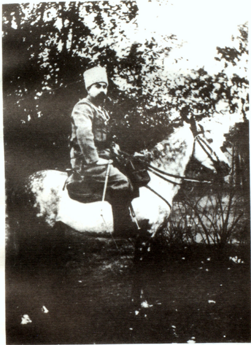
«... Բաշեան մէջ շեկօրէն Բաշը և Ներսէսեան մէջ կախարհօրէն Ներսէս Դրօն»