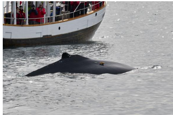
En av knölvalarna var märkt, några forskare dök upp under tiden vi var där, de hade pejlade in valen.