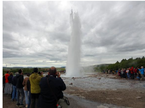
Geysir Strokkur.