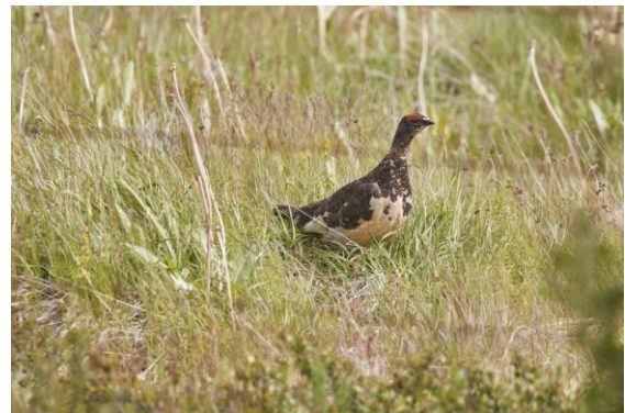
Vi har haft tur o sett många fjällripor, denna var extra snäll att fota i vägkanten!

Denna natt bodde vi intill glaciären Vatnkullör som ses från vårt boende, häftig utsikt från rummen! Det är världens största om man räknar bort Arktisk och Antarktisk. Efter en god middag fick vi hemmagjord glass, mums! Vår chaufför Þorgeir fick slita idag, vinden slet o drog i bussen hela tiden.