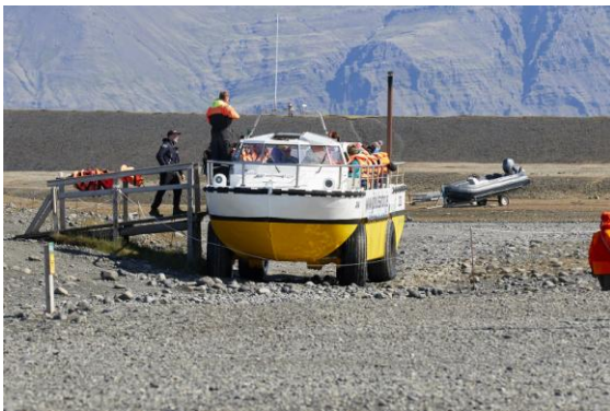
Man kliver bekvämt på denna bil/båt som kör ned till glaciären och "omvandlas" där till en båt. Med denna åker man omkring i islagunen Jökulsárlón som fylls från Vatnajökull