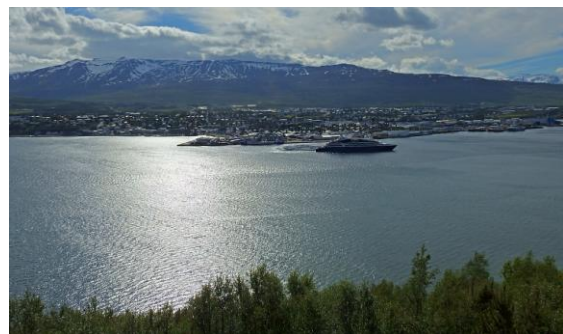
När vi stod och beundrade den vackra vyn över Akureyi och dess vik så såg vi plötsligt flera ryggenor trots en stor kryssningsbåt var på utgång. Grindval och knölval!