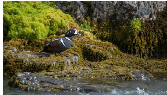
Det märks att strömänderna vid Blöndus är vana med fotografer. De poserar oskyggt!

Midsommardagen, som inte firas på Island, blev en fin dag! Det var en mycket vacker vägsträcka vi färdades fram på och strålande sol, dock lite blåsig men ganska varma vindar.