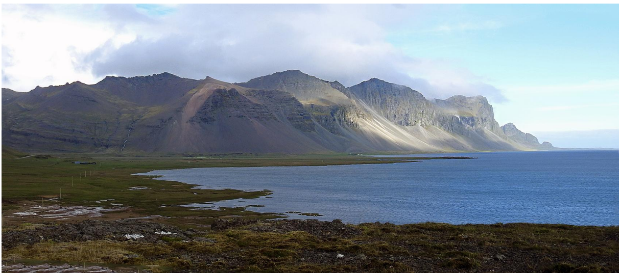
Islands ostkust.