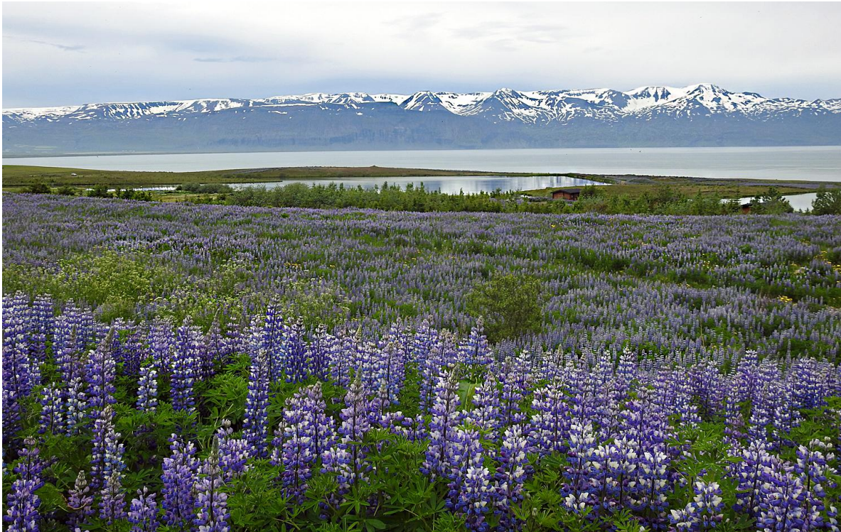
Svårt att inte låta bli att tycka det är vackert med den invasiva lupinen, här vid Kaldbakstjanir strax utanför Husavík. Gigi Sahlstrand