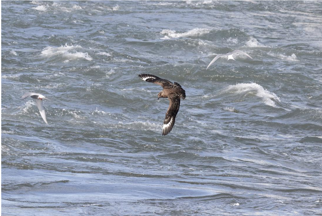
Storlabbb i aktion i Skjalfandiviken.

3 Skjalfandi 23.6, 2 Jökulsárlón, 2 Fjallsárlón, 1 Dyrhólaey og 4 löngs vögen 26.6, 35 löngs vögen og 10 seljalandsfoss 27.6, 6 under dagen 28.6.