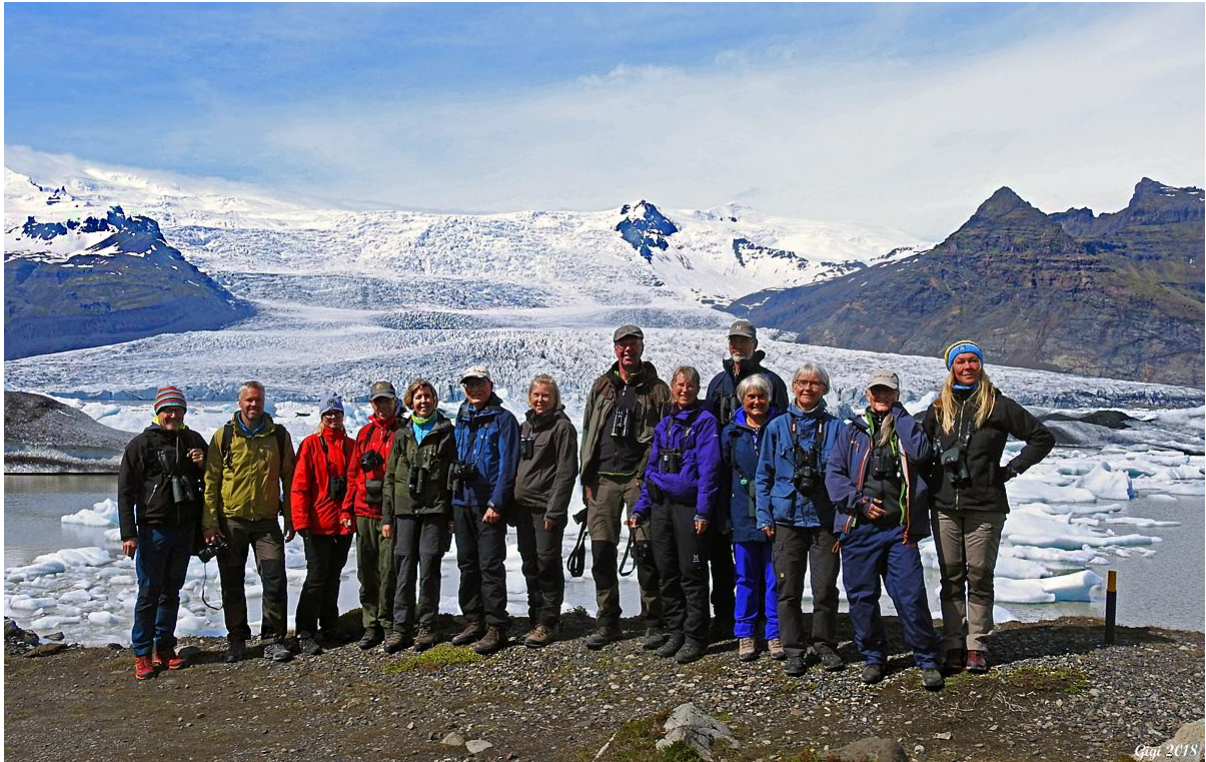
Gänget som åkte till Island. Här vid Fjallsarlón, en del av glaciären Vatnakullör.