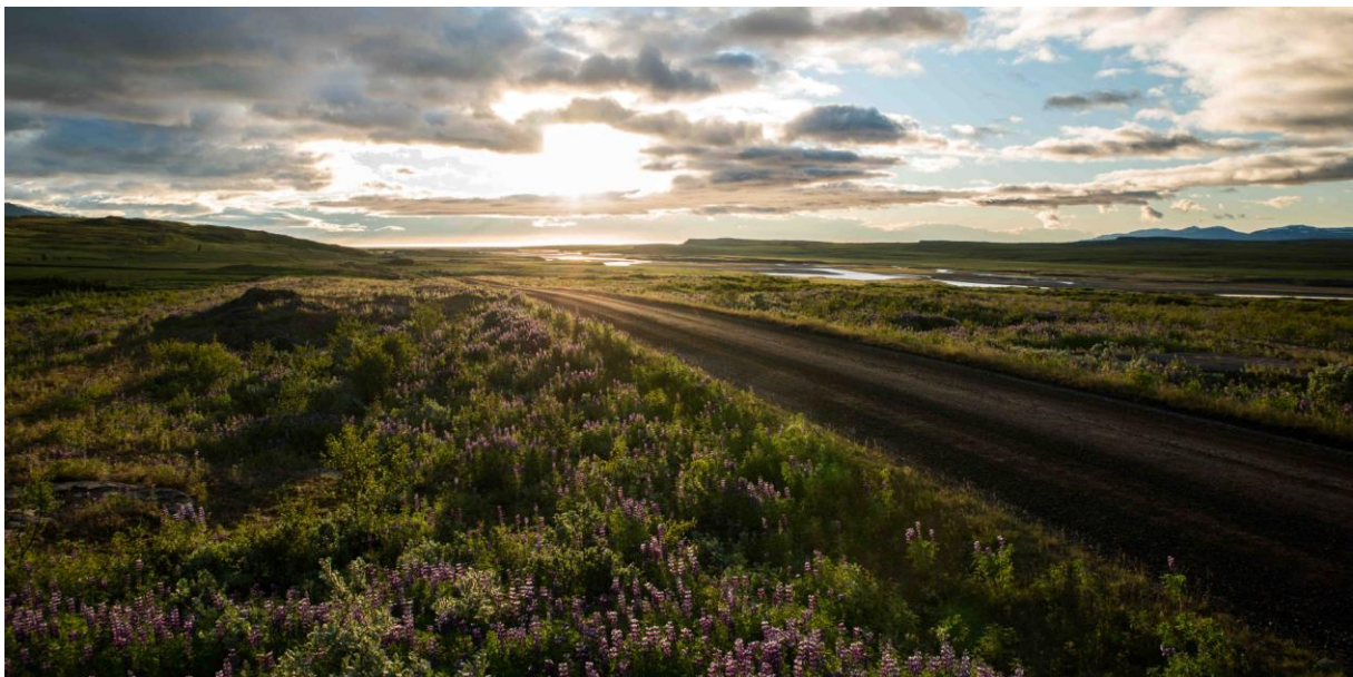
Många kvällar är vackra på Island. Här är från vårt boende Svartiskogur på ostkusten.