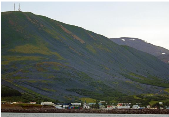
Alskalapinen är en invasiv art men även att man vet att denna blomma skapar problem för den inhemska floran kan man inte slås av de vackra "blå haven" på bergen. Husavik

Tyvärr en grå dag med lätt regn då o då. Men alla islommar och strömänder värmd oss!