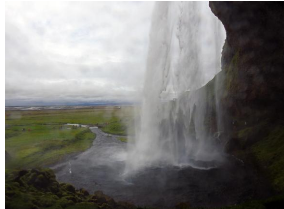
Bakom fallet Seljalandsfoss får du önska dig 3 saker 😊.