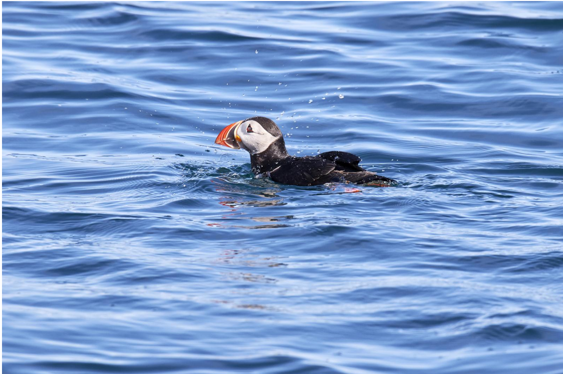
På Island finns ca 2–3 miljoner par lunnefåglar!