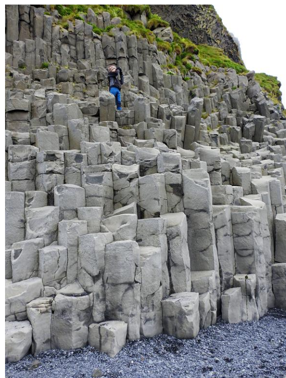
Går hitta fina fågeltorn i de märkliga klipporna i Reynisdranger – Halsanefshellir 😊

Efter att ha fikat åkte vi till orten Vik, här gavs det tid för shopping av isländska kläder. Vi passade på att även äta lunch där. Sen styrde vi kosan till nästa imponerande vattenfall, Seljalandsfoss. Där kan man gå bakom fallet och önska sig 3 saker :-). Fast precis innan vi skulle gå föll en önskan in direkt, Sverige vann sin match i VM och blev etta i sin grupp 🏆. Det firade vi med "after birding" på verandan till vårt boende i skön sol! Vi bor en natt till i Skogafoss. Vi förundras fortfarande av all vacker och omväxlande natur på Island! Dessutom såg vi en ovanlig art på Island, en ringduva!