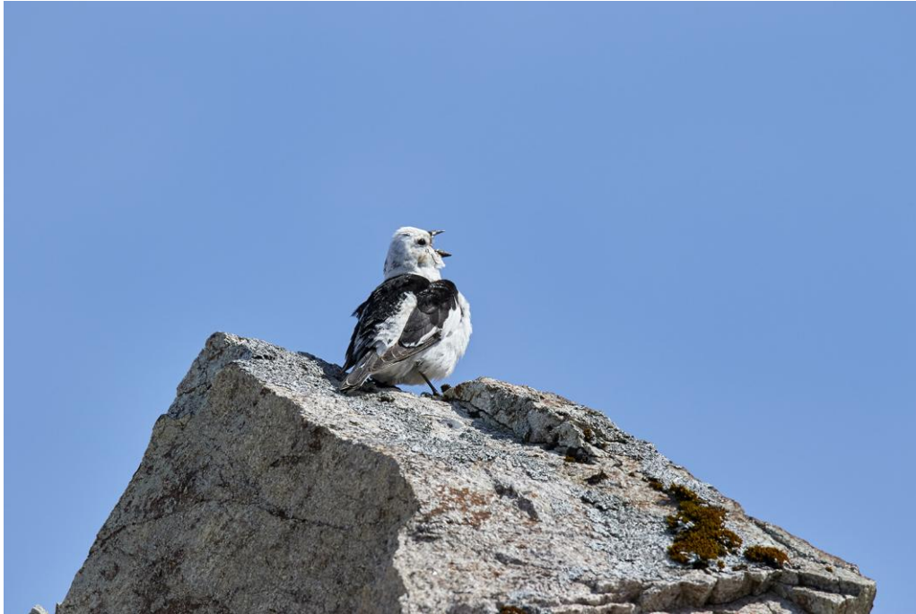
Snösparven har en fin sång, vi fick lyckan att höra den flera gånger.