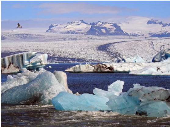
Islagunen Jökulsárlón med glaciären Vatnajökull i bakgrunden.