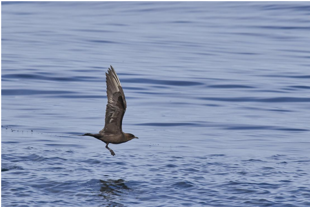
Kustlabbb ses både över havet og över land.

1 Keflavík 19.6, 2 Gauksmyri 21.6, 2 Medelfellsvatn 21.6, 3 löngs vögen 21.6 og 80 löngs vögen 26.6. Ganska vanlig, oftast runt 3–12 ex varje dag. Observerad 10 dagar totalt.