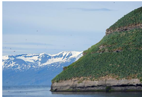
Båtturen började med Puffin Island. Oj oj så många lunnefåglar i o över vattnet samt på land vid deras bohålor.