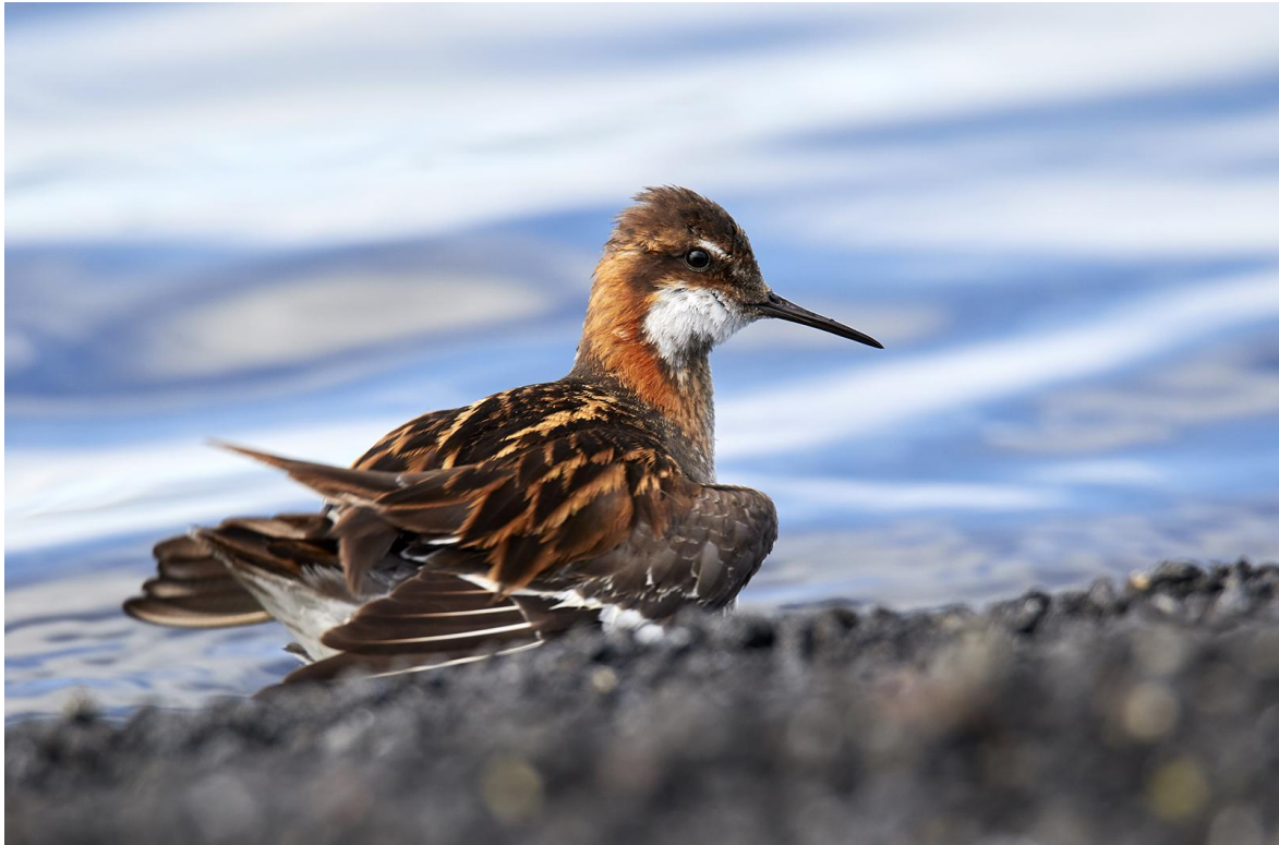
Smalnébbade simsnäppor är underbara! På Island får du se många, häckar ca 50 000 par!