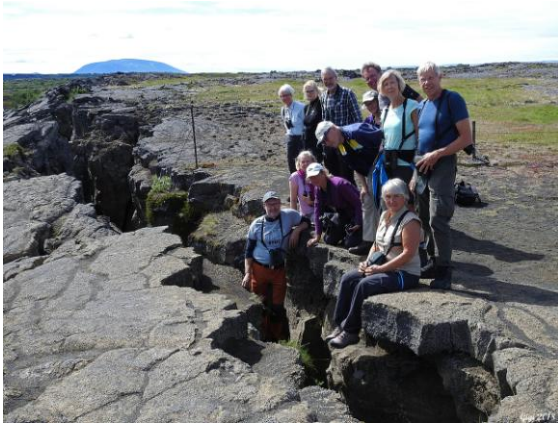
Här sitter gänget i kontinentalsprickan vid Grjotagja.

Under vår 15 mil långa färd över fjället till vårt boende såg vi minst 80 par spetsbergsgäss, alla med ungar, skoj. En ny händelserik dag till ända, en fantastisk varm dag, t o m kunnat gå i linne!! Efter artgenomgången tog flera en promenad i omgivningarna runt vårt boende i Skogafoss. En gärdsmys höga stämman gjorde allt för att hålla oss vakna men Zzzzzzz 😊.