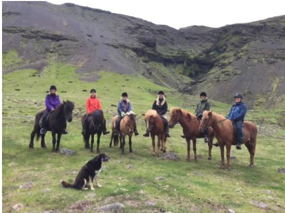
Gänget som red Islandshästar.

och när väl kaskaden med vatten kommer går det ett härligt sus genom alla och ett glatt snatter hörs på mängder av olika språk! Vid sista anhalten Tingvalla, så landade 2 smålommar dryga 10 meter ifrån oss och började oberört putsa sig, coolt! Sen hann vi bara gå en bit för att upptäcka flertal strömänder, det blev 14 hanar och 2 honor till slut, fanns säkert fler, WOW!! Tingvalla har en spännande historia. Det var här år 930 man hade det första demokratiska mötet. Kändes fint att avsluta resan runt Island på Tingvalla med strömänder!! Därefter var det färd mot Reykjavik för att tillbringa vår sista natt där.