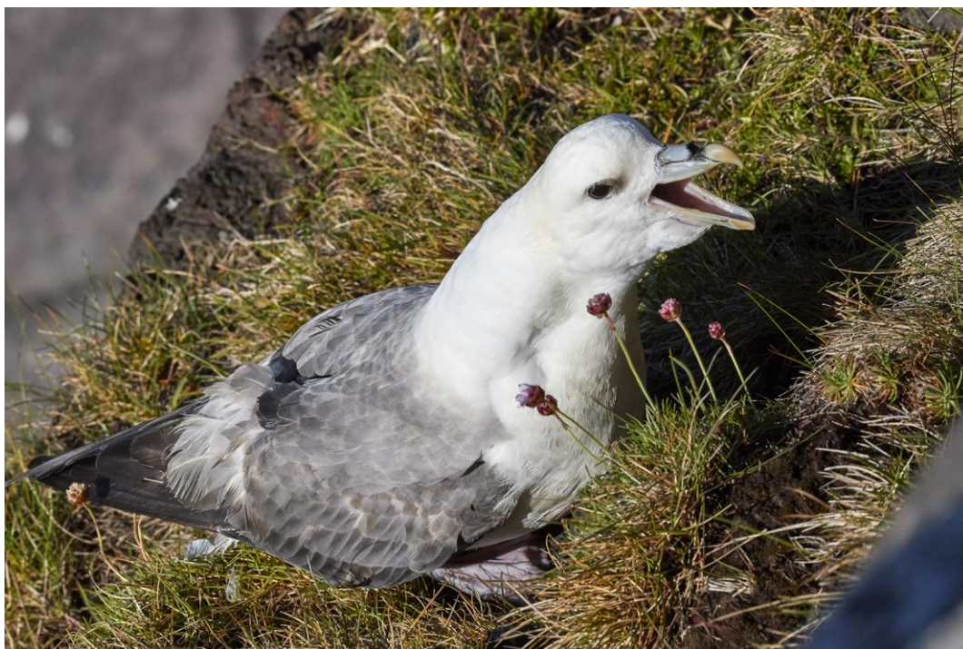
Det är gott om stormfåglar på Island, ca 1 milj par häckar där! Oftast kommer du dom nära.