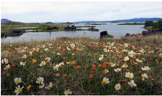
Kálfaströnd som ligger i Myvatn SÖ del. Här ifrån såg vi 2 jaktfalkar på en av öarna utanför!