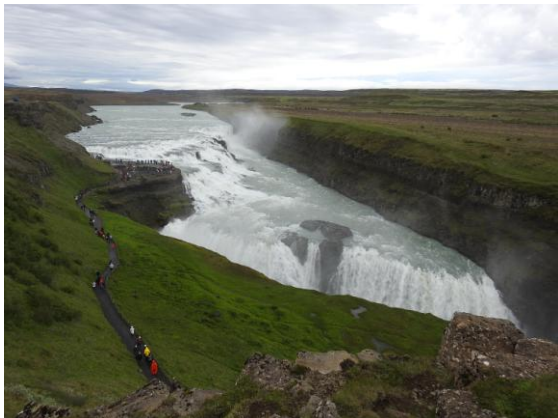
Mäktiga Gullfoss