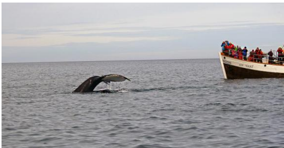
Ibland kommer knölvalarna väldigt nära!

Nästa stopp var en pöl inte så långt ifrån, Silalaekur, där var det otroligt många smalnäbbade simsnäppor och rödspovar. Nästa pöl, Vestmannsvatn, gav en överraskning - en islandsknipa i eclipsedräkt låg där, yeah!!! Övrigt låg ytterligare ett par av svartnäbbad islom och med dagens sötaste - 2 mkt små ungar på ryggen. Vi börjar bli bortskämda med islommar nu 🙌. Sista stoppet denna händelserika dag blev Godafoss, ett mäktigt vattenfall bara några km från vårt boende. Här hittades 5 strömänder, även dessa har vi blivit lite bortskämda med 😊. Efter sett oss mätta på det mäktiga vattenfallet Godafoss åkte vi hem till hotellet. Vi bodde en natt till på samma ställe, Hotel Edda. Utmed vägen ser man mängder av vissa arter tex röd- och småspov, rödbena, enkelbeckasin, ljungpipare, rödvingetrast och ängspiplärka. Under dagen sågs ca 25 svarthakedoppingar, känns som de har ökat!