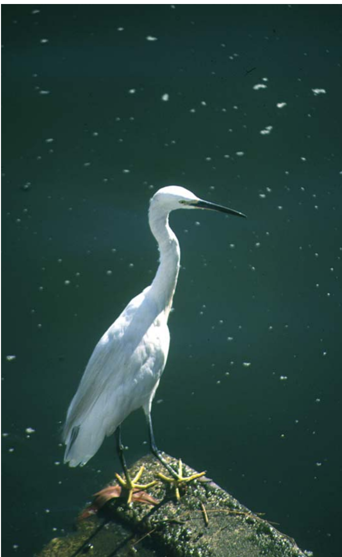
Mala bela čaplja je reden gost Strunjanskih solin.

Položi so življenjski prostor značilnih slanoljubnih rastlin; osočnika, členkarja in ozkolistne mrežice, ter številnih ptic, ki si v mulju in pesku iščejo hrano.