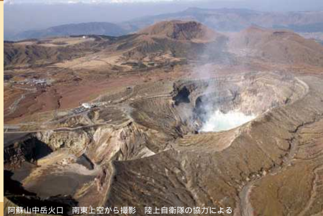
阿蘇山中岳火口 南東上空から撮影 陸上自衛隊の協力による

噴火警戒レベルとは、噴火時などに危険な範囲や必要な防災対応を、レベル1から5の5段階に区分したものです。各レベルには、火山の周辺住民、観光客、登山者等のとるべき防災行動が一目で分かるキーワードを設定しています（レベル5は「避難」、レベル4は「避難準備」、レベル3は「入山規制」、レベル2は「火口周辺規制」、レベル1は「活火山であることに留意」）。対象となる火山が噴火警戒レベルのどの段階にあるかは、噴火警報等でお伝えします。