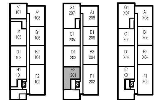
Rez-de-chaussée Niveaux 2 Niveaux 3 @ 6