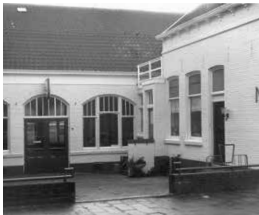
't Grachtenhuys, dat rechts naast het patronaatsgebouw staat, hier nog in functie als onderkomen van de NKV, circa 1965