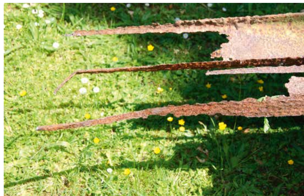
De tijdens het verwijderen ervan gebroken, vrijwel totaal doorgeroeste, draagbalk onder de grafsteen van het grafmonument van Post, 8 juni 2015