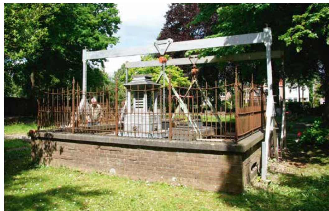
Het tillen van de steen van Post met een zware bok, 8 juni 2015

Beide herstelde grafmonumenten zullen (goeddeels) weer in volle glorie te zien zijn tijdens de Open Monumentendag op zondag 13 september (13 – 16 uur). Ook is er dan een presentatie van de verschillende fasen van het herstel van monumenten. Door samenwerking van de BATO en de Stichting tot Instandhouding van Historische Begraafplaatsen in Tiel en Omstreken worden tevens voorwerpen gepresenteerd die ooit eigendom waren van Ernst Ephraïm van Bergen, 225 jaar geleden overleden en wiens steen de oudste op Ter Navolging is.