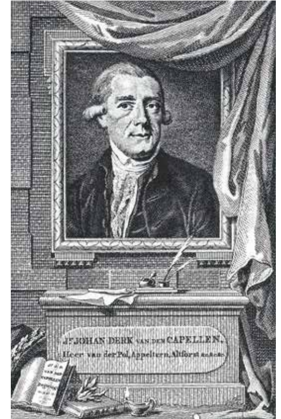
Johan Derk van der Capellen tot den Pol