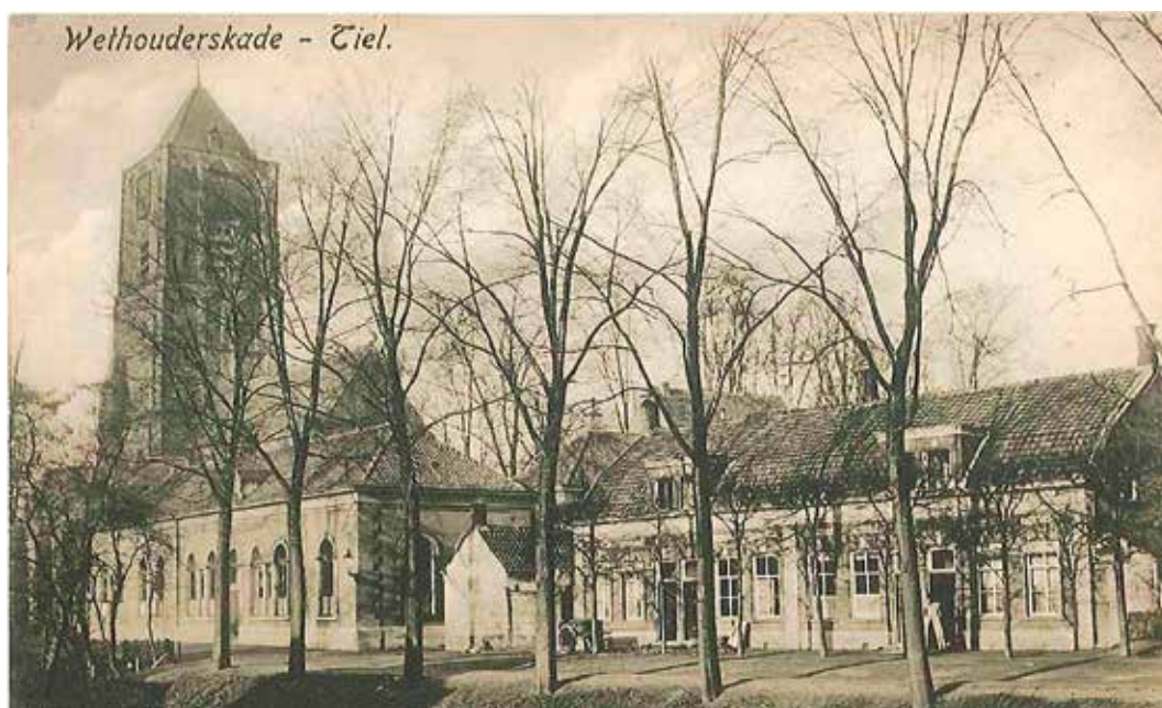
Ansichtkaart van de Wethouderskade begin twintigste eeuw. De wal is geslecht, de huisjes zijn vervangen. Tegenwoordig ligt hier een kaal parkeerterrein