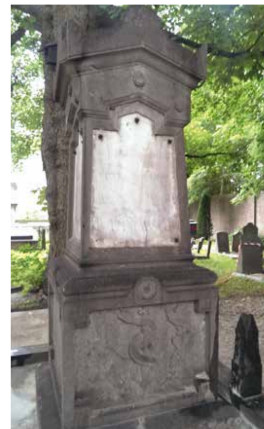
Het Monument van Küthe begin augustus 2015 na terugplaatsing, inclusief banden en paaltjes en een eerste wasbeurt met een (biologisch afbreekbaar) bestrijdingsmiddel van mos