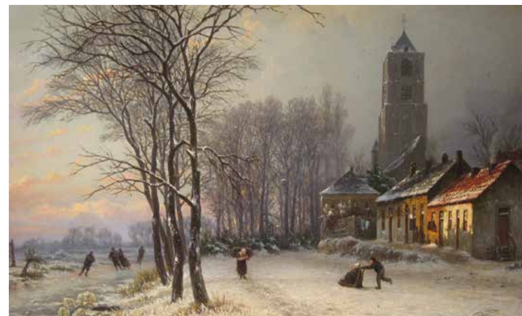
De Wethouderskade in de winter door G. A. Roth. Olieverf op paneel; 27,5 x 45 cm (Collectie Flipje en Streekmuseum Tiel)

1830 (Cleveland Museum of Art) en onderwerpen als 'Toren met ruïne van baksteen' of 'Watermolen in het bos'. Langzamerhand zette echter een nieuwe trend in met als sleutelbegrippen waarheid, natuurlijkheid en eenvoud. De natuur zelf moest inspiratie leveren. Kunstenaars gingen naar buiten en maakten reizen. In 1835-'36 trok Roth langs de Rijn, Maas en Neckar om er de glooiende landschappen en daarin gelegen stadjes vast te leggen. De majestueuze natuur in de vorm van zwaar geboomte, zoals zijn beroemde tijdgenoot B.C. Koekkoek (1803 – 1862) die zo