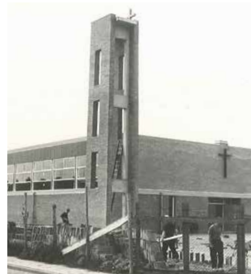
De Kerk van de Menswording te Tiel is bijna gereed, 1965

Twee dagen later opende de heer Stolk het nieuwe pand van de Hilversumsche Meubelfabriek op industrieterrein Latenstein. Dit bedrijf had zich in 1960 in de oude Bato fietsenfabriek op de hoek Veemarkt en Molenstraat gevestigd. Daar staat nu de supermarkt van Albert Heijn. Vijf jaar later verhuisde men naar een groter pand, dat door de Tielse architect S.H. van der Zee was ontworpen. Directeur Reparon wees er op dat tien jaar geleden het productieproces van ambachtelijk naar fabrieksmatig was omgevormd. Specialiteit waren de bankstellen die onder de naam Dat Zit, later afgekort tot DZ, op de markt werden gebracht.