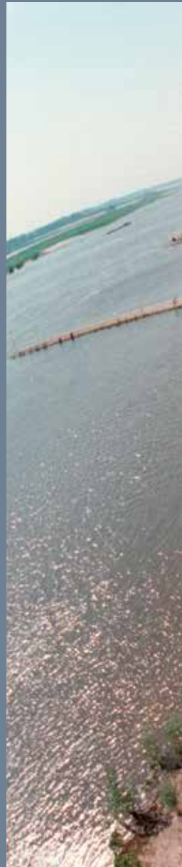
Foto omslag: RAR/Collectie Bouwhuis. Foto gemaakt door Jan Bouwhuis in 1993 met een radiografisch aangestuurde fotocamera die onderaan een vlieger was bevestigd