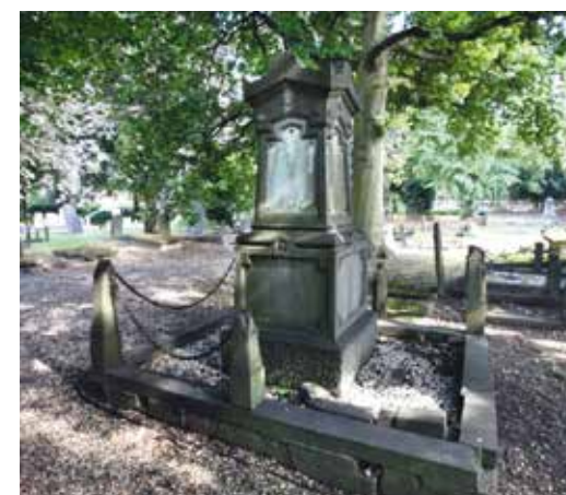
Graf Küthe in desolate staat