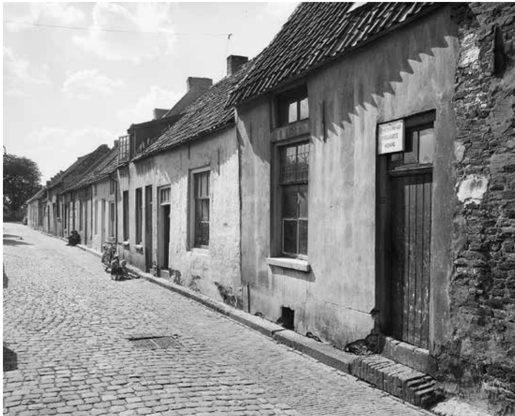
De Oranjestraat te Buren in 1959. Rechts een onbewoonbaar verklaarde woning

'Sinds mensenheugenis was Buren bekend om zijn zuinig beheer. Deze zuinigheid ging ten koste van de gemeentelijke gemeenschap. De bestuurders van Buren waren trots op de financiële zelfstandigheid maar was het niet juist geweest indien zij trots waren geweest op een gemeente welke in bloei vooruit ging. Buren schrompelde als een oude juffrouw ineen en liet alle kansen om vooruit te komen voorbijgaan.'