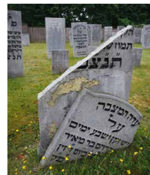
Ondeskundig herstel op Joodse Begraafplaats, 2014