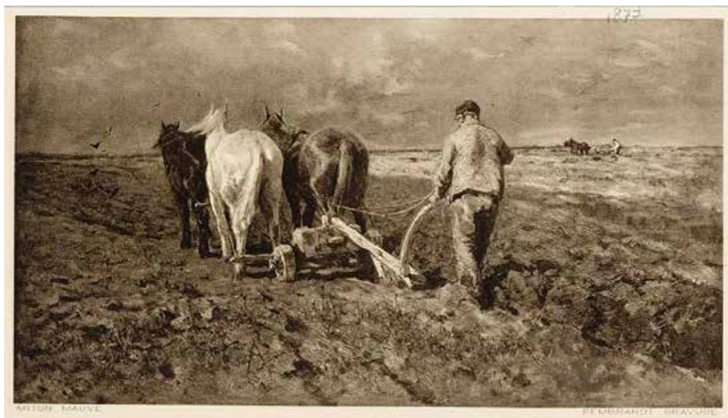
De boer bewerkt het land met een eergetouw (ploeg zonder wielen). Schilderij door Anton Mauve, circa 1875

De pachtwet van 1938 maakte pas een eind aan deze éénjaars-toekomst. Een boer zonder toekomst kan nooit een goede boer worden.