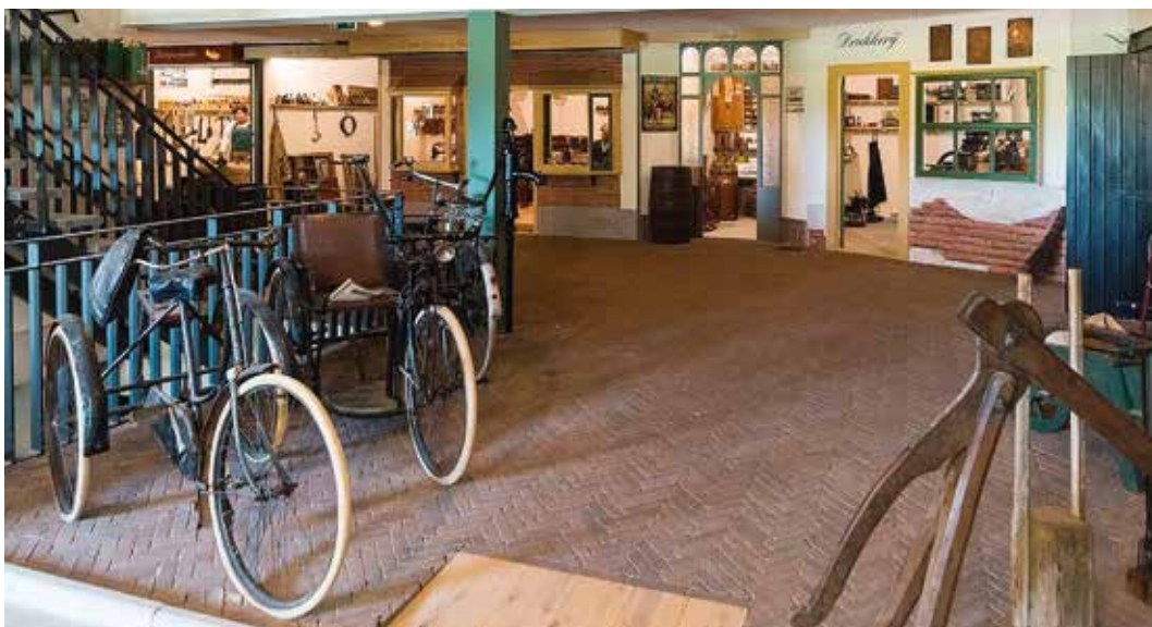
Pleintje met oude ambachten in Streekmuseum Baron van Brakell te Ommeren

maar is er ook voldoende ruimte voor de Historische Kring Kesteren en Omgeving met het Arend Datema Instituut dat zijn historisch archief, bibliotheek en onderzoeksruimte van het station in Kesteren eerder dit jaar naar Ommeren verhuisde. In de ruime nieuw gebouwde kelder heeft de waardevolle collectie van het vroegere Boerenwagenmuseum van Buren een plaats gekregen. Deze collectie is uitgebreid met twee fraaie door Den Haan Uitvaartverzorging in bruikleen gegeven rouwkoetsen. Ook tref je er een op het maken van boerenwagens gerichte smederij, wagenmakerij en timmermanswerkplaats aan.