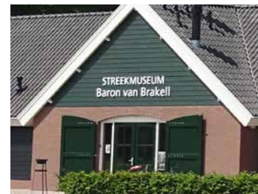
Hoofdingang Streekmuseum Baron van Brakell te Ommeren, 2015

http://www.streekmuseumbaronvanbrakell.nl