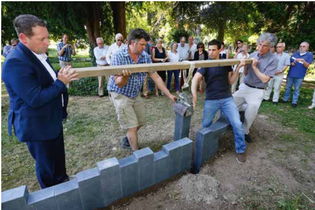
Opening strooiveld op Ter Navolging, 6 juni 2015