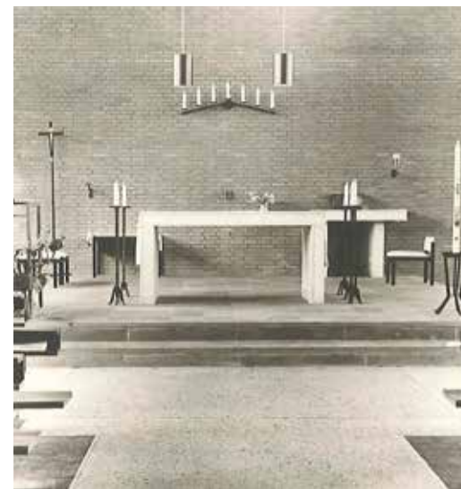
Het interieur van de Kerk van de Menswording te Tiel, 1965