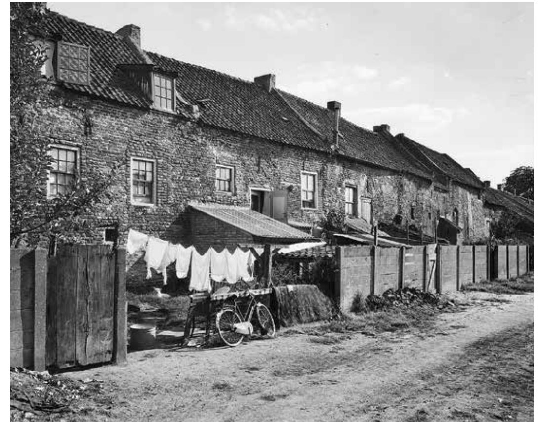
Muurhuizen in de Oranjestraat te Buren in 1959, gezien vanaf de tuinzijde

Het Gelders Dagblad van 25 februari 1964 schreef over de deplorabele woontoestanden in het vervallen stadje Buren. De muurhuizen stonden op instorten. Een journalist nam een kijkje in een van de huisjes: 'De slaapkamer was een en al vocht en de keuken een droefenis, ook vol vocht, donker en alles moest afgedekt worden voor het neervallende stof.'