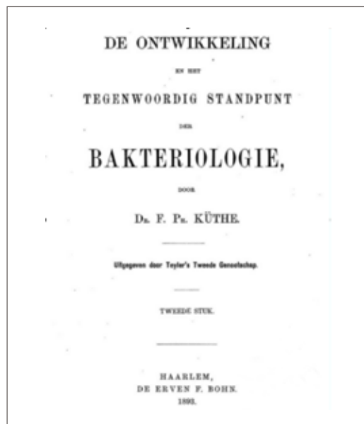
Boekomslag: De ontwikkeling en het tegenwoordig standpunt der bacteriologie

Dit betekende dat, nadat de bovenbouw was verplaatst, het metselwerk weer vanaf een 'deugdelijke en vastzittende laag' moest worden opgebouwd. Tot hoe ver de steenlaag nog intact was zou pas in de praktijk blijken. Uiteindelijk dienden de verticale wanden met een laag van gemiddeld meer dan tien stenen verlaagd te worden. Toen deed zich gelijk het probleem voor dat de grafkelder een gewelfde dakconstructie heeft die door de verticale wanden van de grafkelder onder spanning wordt gehouden.