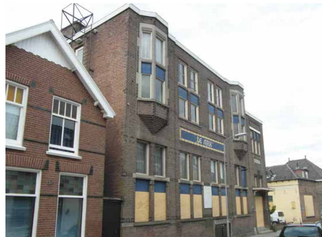
Het dichtgespijkerde patronaatsgebouw aan de Hoveniersweg, juni 2015

maakt wel een goede kans in het straatbeeld gehandhaafd te worden. Ik eindig door de woorden aan te halen die een journalist van Ons Weekblad in augustus 1917 bij de officiële inwijding schreef: 'De algemene indruk was, dat het mooie Patronaat inderdaad een gebouw is, dat zeker tot de merkwaardigste van Tiel mag gerekend worden, een aanwinst derhalve van onze stad'. We zullen zien of dat voor onze generaties nog steeds geldt.