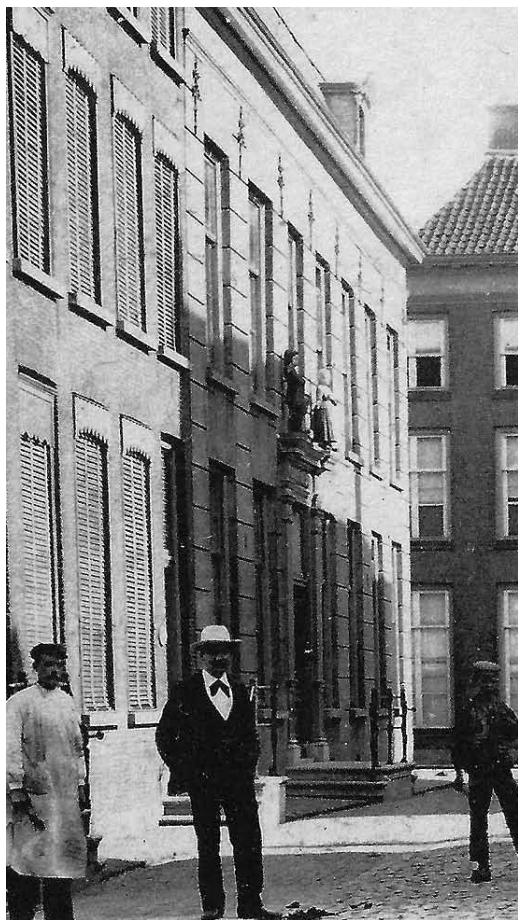
Het voormalige weeshuis op de hoek Ambtmanstraat-Hoogeinde. Op 3 maart 1563 werd de eerste steen gelegd.