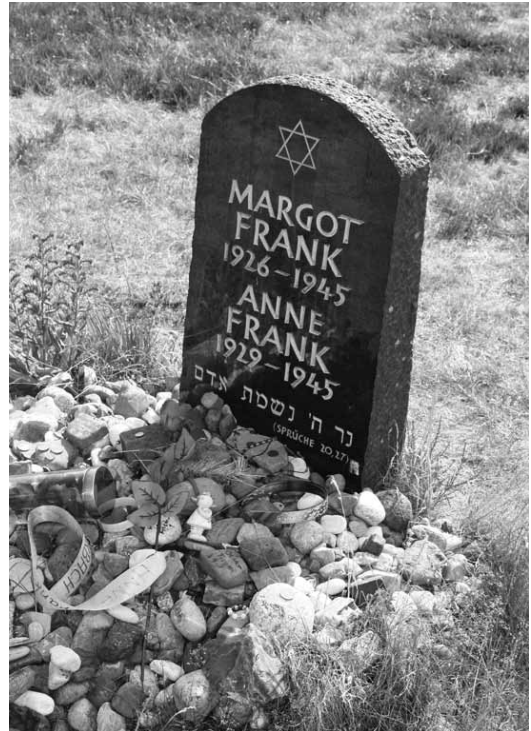
Ook Anne en Margot Frank stierven in de laatste oorlogsmaanden onder afschuwelijke omstandigheden in Bergen-Belsen.

Ap werd enige tijd op een onbekende plaats gevangen gehouden en vervolgens, evenals zijn broer, naar concentratiekamp Sachsenhausen vervoerd. Ap arriveerde er volgens een kampdocument op 13 augustus 1941. Hij kwam terecht in blok 13, met gevangenennummer 038989. Tussen 1939 en 1945 hebben daar ongeveer 200.000 mensen gevangen gezeten, van