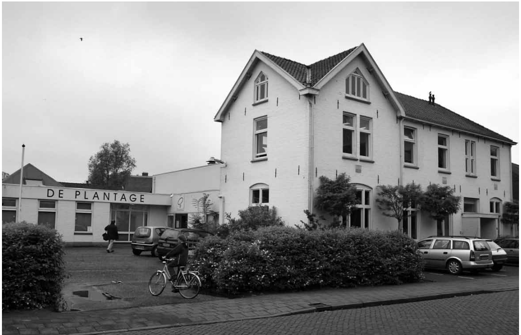
Het gebouw van De Plantage aan de Kleine Plantage 1a.