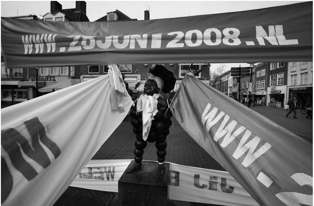
Roze zaterdag, 28 juni 2008