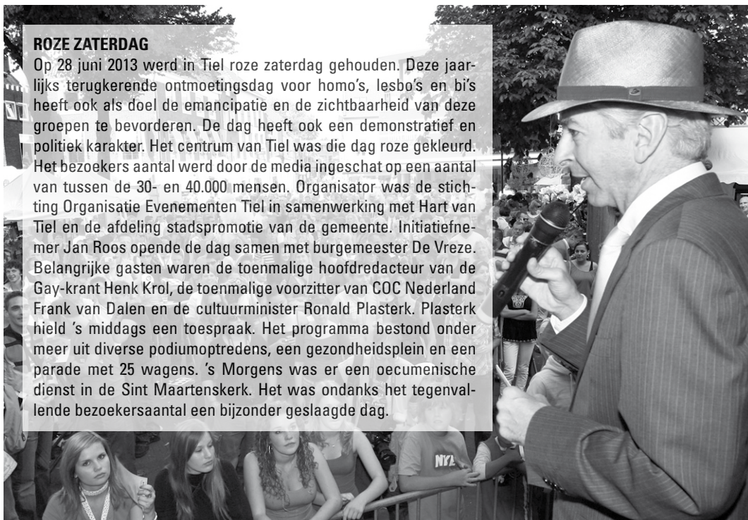
Roze zaterdag: Minister Ronald Plasterk houdt een speech.